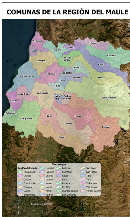
Comunas de la Región del Maule