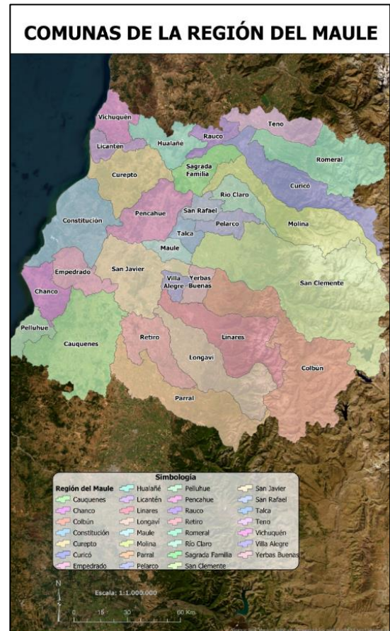
Comunas de la Región del Maule

La comuna de Sagrada Familia se funda el 22 de diciembre de 1892 originalmente con el nombre de Lo Valdivia. El año 1965 previas gestiones con el gobierno la comuna pasa a llamarse oficialmente Sagrada Familia, debiendo su nombre a la parroquia de la Sagrada Familia, la que debe su origen a La Divina Virgen, El Divino San José y El Niño Jesús (Municipalidad de Sagrada Familia, 2020).