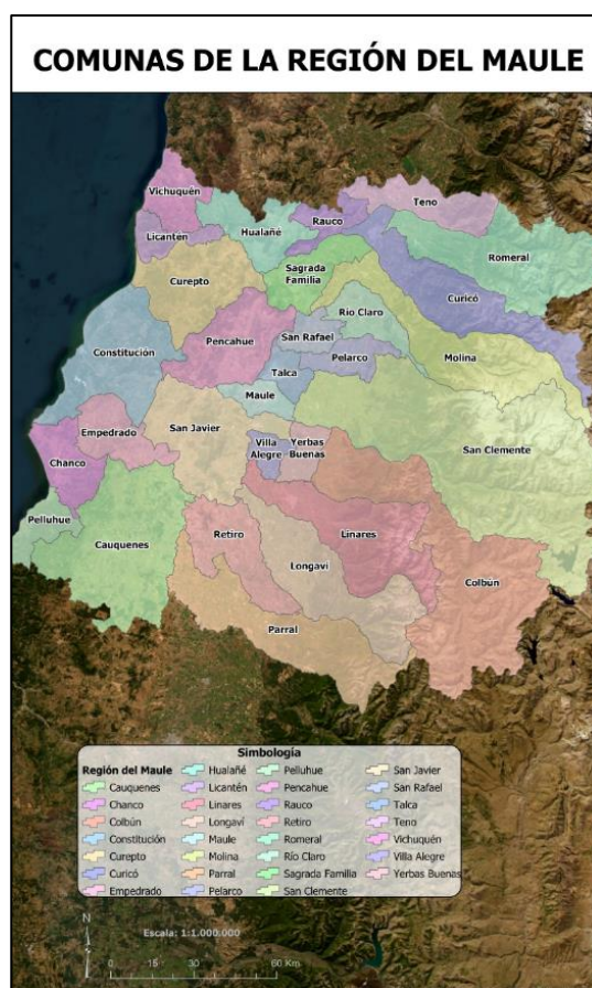
Comunas de la Región del Maule