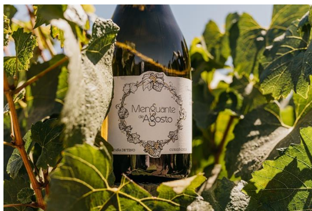
Vino Menguante de Agosto, Viña Marita