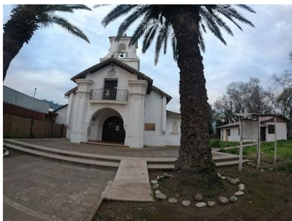
Iglesia Santa Begoña de Comalle

El 11 de octubre de 1953 se inauguró la Iglesia dedicada a Nuestra Señora de Begoña de Bilbao, España, por el obispo de Talca Monseñor, Manuel Larraín Errazuriz (Municipalidad de Teno, 2025).