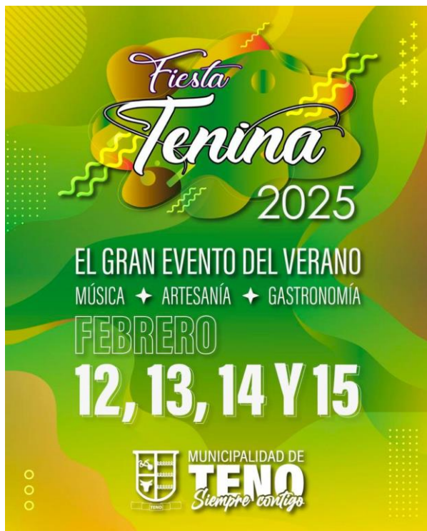
Afiche Fiesta Tenina 2025

Se realiza en febrero, donde se puede disfrutar de una imperdible programación con música en vivo, lo mejor de la gastronomía local, artesanía, y muchas sorpresas preparadas para toda la familia. La Fiesta Tenina es el evento estival más importante de Teno, un espacio de encuentro donde vecinos y vecinas bailan, comparten y lo pasan espectacular, celebrando su identidad y cultura ( https://short.do/QUMOLb ).