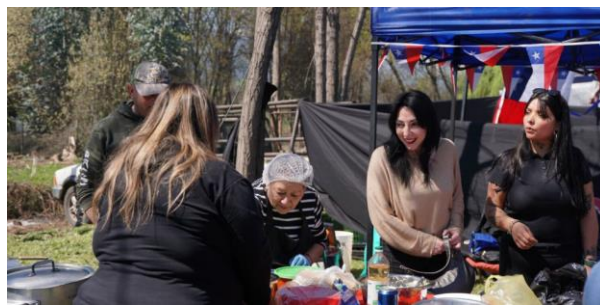
Fiesta de La Prieta

La fiesta ofrece: degustaciones de distintas variedades de prietas, gastronomía local y muestras de productos del campo, música en vivo con grupos folclóricos y bandas locales, feria artesanal con expositores de la zona, juegos típicos y actividades familiares durante toda la jornada. Además, se desarrolla un concurso a la mejor preparación en base a prietas artesanales, donde se premia la creatividad y el sabor de la cocina tradicional ( https://short.do/baVtg3 ).