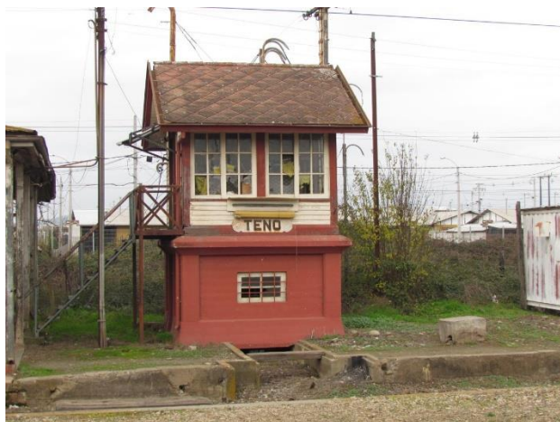
Estación de Teno

El lugar conserva la estación de pasajeros, andén isla, cabina de movilización, bodega y casa del jefe de estación. En el 2017 fue declarada Monumento Histórico Nacional (Consejo de Monumentos Nacionales).