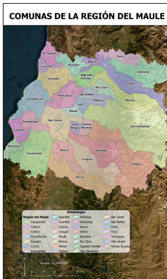
Comunas de la Región del Maule