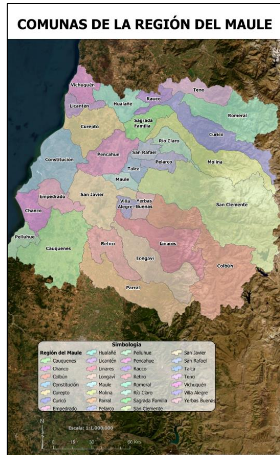
Comunas de la Región del Maule

La comuna de Sagrada Familia se funda el 22 de diciembre de 1892 originalmente con el nombre de Lo Valdivia. El año 1965 previas gestiones con el gobierno la comuna pasa a llamarse oficialmente Sagrada Familia, debiendo su nombre a la parroquia de la Sagrada Familia, la que debe su origen a La Divina Virgen, El Divino San José y El Niño Jesús (Municipalidad de Sagrada Familia, 2020).