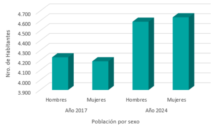
Población por sexo 2017 y 2024, comuna de Pelarco