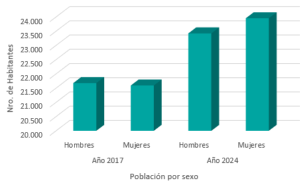
Población por sexo 2017 y 2024, comuna de San Clemente