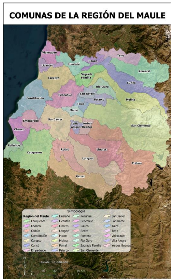
Comunas de la Región del Maule

Es así como progresivamente y en torno a la iglesia parroquial, se construyeron casas de adobe y tejas, además de chozas de totora y barro. De esta forma el edificio parroquial se constituye en un hito histórico de imponente imagen arquitectónica, en torno al cual se organizan los espacios, la trama y las primeras edificaciones residenciales. Respecto a las redes de infraestructura, no existía sistema eléctrico y el agua era extraída de pozos o directamente de los abundantes cursos de agua que cruzaban este valle. La canalización de esteros y ríos fue obra muy posterior debido a la necesidad de regadío y para evitar las constantes inundaciones que provocaban los deshielos. En el año 1894, dado el crecimiento poblacional de San Clemente se crea la primera Municipalidad, luego a fines del siglo XIX se crea la primera escuela de la ciudad, y a comienzos del siglo XX se construye la vía férrea que une a San Clemente con Talca. En el año 1964, al cumplir 100 años de vida, se le otorga el título de ciudad, ratificada mediante Ley N° 16403 de diciembre de 1965 (Municipalidad de San Clemente, 2026).