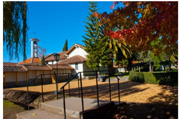
Monasterio Trapense Nuestra Señora de Quilvo

Fundado en el año 1981, pertenece a la Orden Cisterciense de la Estricta Observancia, su entorno está compuesto por diversos predios agrícolas de pequeños parceleros. Su construcción comprende: convento, capilla, hospedería y galpones para realizar los procesos de frutas en conserva (Municipalidad de Romeral, 2023).