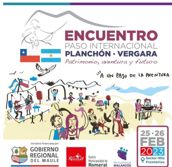
Afiche Encuentro Paso Internacional

Este paso fronterizo se ubica al oriente de Curicó a sólo 91 kilómetros de la ruta 5 sur. En el mes de febrero de cada año se realiza el Encuentro Chileno Argentino en el Paso Planchón Vergara, en donde se desarrolla un evento de integración cultural de gran atractivo para la comunidad chilena y argentina que rodea la zona. En este marco, se realizan trekking a la laguna del Planchón, competencias de MotoCross, jeep fun race, entre otras actividades (Municipalidad de Romeral, 2023).