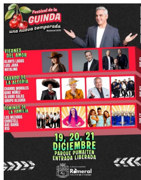
Afiche Festival de La Guinda

Fiesta costumbrista que pone en valor la identidad agrícola de la comuna y contempla la realización de espectáculos artísticos y de entretenimiento; también busca promover el desarrollo de la música a través de un concurso musical, donde se presenten producciones inéditas de cantautores o intérpretes chilenos, de manera de impulsar el talento y la creación artística ( https://short.do/gvt9CJ ).