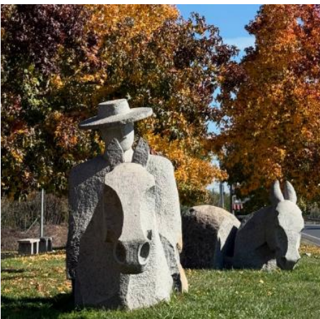
Monumeto del Arriero

Ubicado en la ruta J55 a la salida de la zona urbana de Romeral, a siete kilómetros, hacia la salida a la cordillera de los Andes. Está construida en piedra por el escultor Luis Dörr y financiada por un proyecto FRIL Bicentenario (Municipalidad de Romeral, 2023).