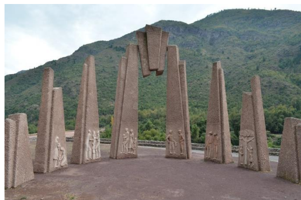
Mirador Cementos Biobío

Construido a un kilómetro de Los Queñes, sobre la Ruta J55 camino al Paso Vergara. Lugar de descanso y avistamiento de flora y fauna local en medio de un bello entorno precordillerano. La escultura la realizó la empresa Cementos Bio Bio en homenaje a los trabajadores de la zona (Municipalidad de Romeral, 2023).