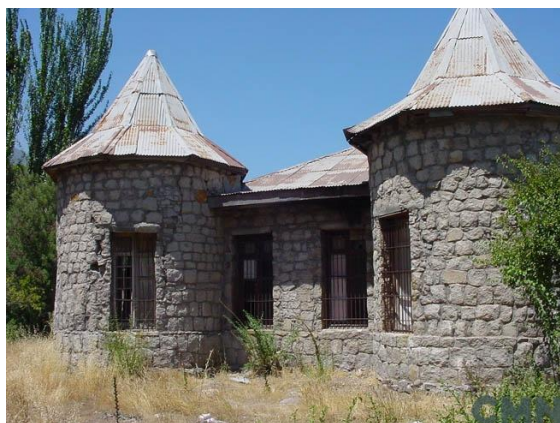
Aduana Los Queñes

Declarada monumento Histórico en el año 1998. Este edificio fue construido con el objeto de albergar la Aduana fronteriza del paso Los Queñes- San Rafael, que comunica Chile con Argentina. Construido en cantería de piedra hacia 1860 y recibido en 1864; tuvo la principal finalidad de controlar el flujo ganadero entre Chile y Argentina existente en la época. El inmueble evoca un pequeño castillo medieval o fortaleza. Está compuesto por dos volúmenes iguales separados por un espacio. Consta de cuatro torreones circulares recubiertos por chapiteles que se levantan en cada una de las esquinas perimetrales del edificio, orientados hacia los puntos cardinales. Su altura se eleva por unos 10 metros del nivel del camino. Predomina la mampostería de piedra y madera de roble. Su materialidad es propia de la arquitectura de montaña (Municipalidad de Romeral, 2023).