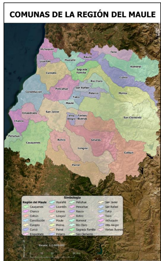
Comunas de la Región del Maule

La municipalidad fue fundada oficialmente el 22 de diciembre de 1891, con el nombre de Municipalidad de Rinconada de Parral. El presidente Ramón Barros Luco tenía su casa de descanso en esta zona. Por ello, Retiro era visitado frecuentemente por conocidos políticos de la época, los que contribuían a la toma de decisiones para la marcha del país, razón por la cual, a la propiedad de Don Ramón Barros Luco, se le denominaba "La Moneda Chica". Esta singularidad hizo que el pueblo contase tempranamente con servicio telefónico. El nombre Retiro" le fue otorgado al pueblo y a la comuna, justamente por ser el lugar de retiro - de descanso - del presidente Barros Luco (Municipalidad de Retiro, 2014).