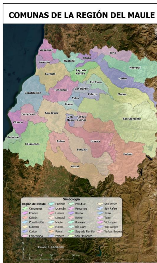
Comunas de la región del Maule

Durante la presidencia de Jorge Montt el 22 de diciembre de 1891, con la Ley de Comuna Autónoma, fueron creadas 195 nuevas municipalidades, entre ellas la de Rauco. Con esta Ley, las municipalidades pasan a tener mayor autonomía y se les confiere mayores tareas para la administración local. Posteriormente, el 30 de diciembre de 1927, se promulgó el Decreto con Fuerza de Ley N° 8.583 del Ministerio del Interior que fija la división de la República en provincias, departamentos y territorios, con modificaciones que hacen indispensable la reorganización correlativa de las comunas. Es en este documento donde se conforma la actual Comuna de Rauco (Municipalidad de Rauco, 2020).