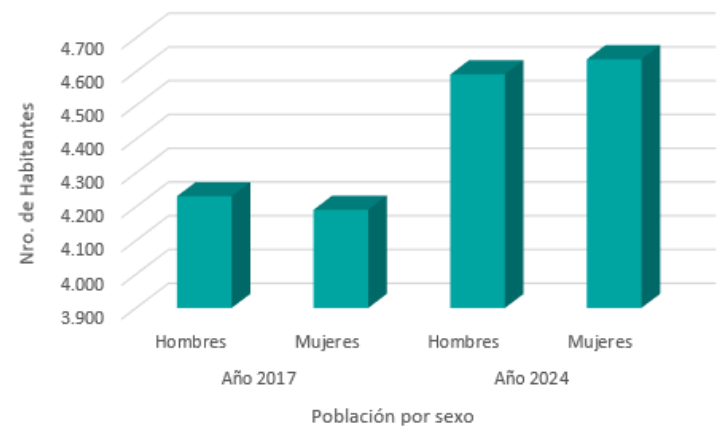
Población por sexo 2017 y 2024, comuna de Pelarco