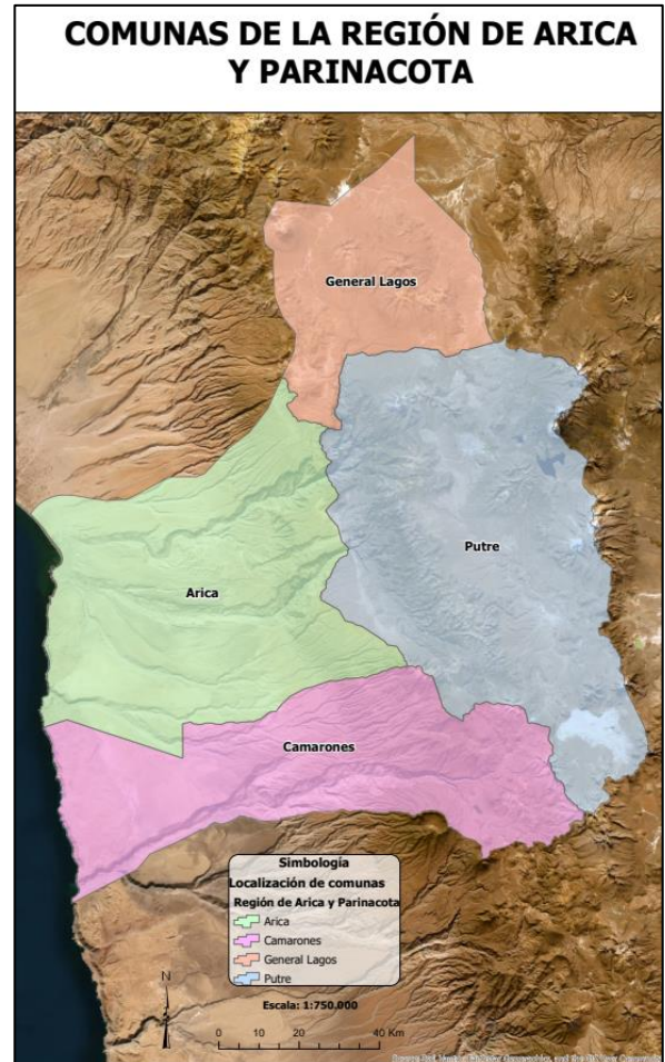
Comunas de la Región de Arica y Parinacota

En la historia de las divisiones administrativas de Chile se reconocen cuatro períodos, de los cuales, la comuna de General Lagos se ve reorganizada tres veces. En 1927 se crea mediante el DFL N° 8583 la comuna de General Lagos, que recibe su nombre en honor al General que planeó el asalto y Toma del Morro de Arica. La comuna constituye una de las cinco comunas que conforman el Departamento de Arica, entre ellas, Arica la cabecera, Putre, Belén y Codpa. Posteriormente en 1979, bajo la cuarta división territorial del Estado, se establece que la Primera Región de Tarapacá se dividirá en tres provincias y diez comunas, donde General Lagos constituye una de las dos comunas de la provincia de Parinacota. Finalmente, el año 2005 se decreta la ley N° 20.050 la cual reformó la Constitución del Estado, una de estas reformas fue la creación de dos nuevas regiones para el país, entre ellas la Región de Arica Parinacota, hecho que se concreta el 8 de octubre del año 2007 (Municipalidad de General Lagos, 2026).