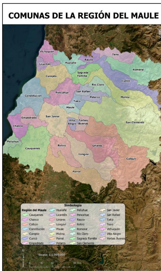
Comunas de la región del Maule

Colbún nacería como comuna el 6 de mayo de 1906, aunque existen otros antecedentes que lo datan en 1904. Originalmente el municipio se localizó en Panimávida, lo que dio el nombre a la comuna (8 de enero de 1923), luego, se traslada a Colbún durante el Gobierno de don Carlos Ibáñez del Campo que, por el D.F.L. N°8583 del 30 de diciembre de 1927, cambia el nombre de la comuna de Panimávida por Comuna de Colbún (Municipalidad de Colbún, 2026).