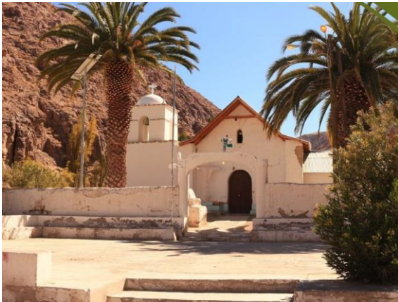
Iglesia de Timar

Fue declarada Monumento Histórico en el año 2015 (Consejo de Monumentos Nacionales).