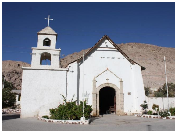
Iglesia San Martín de Tours de Codpa

Fue declarada Monumento Histórico en el año 2015 (Consejo de Monumentos Nacionales).