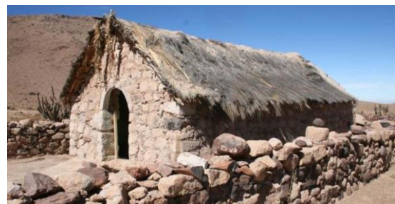
Iglesia de Saguara

Declarada Monumento Histórico D.E. 3365 del 05/11/2008. La iglesia se emplaza en una meseta sobre el denominado sitio arqueológico de "Saguara" correspondiente al periodo incaico. Resulta sugerente que el lugar elegido para construir la iglesia sea justamente el de la estructura ceremonial prehispánica como evocando de antemano el valor simbólico que otorgan las poblaciones locales a este espacio. El sistema constructivo de la iglesia se compone de un basamento de piedra sobre la cual se levantan los muros de piedra pegadas entre sí por una argamasa de barro (Servicio Nacional de Turismo, 2012).