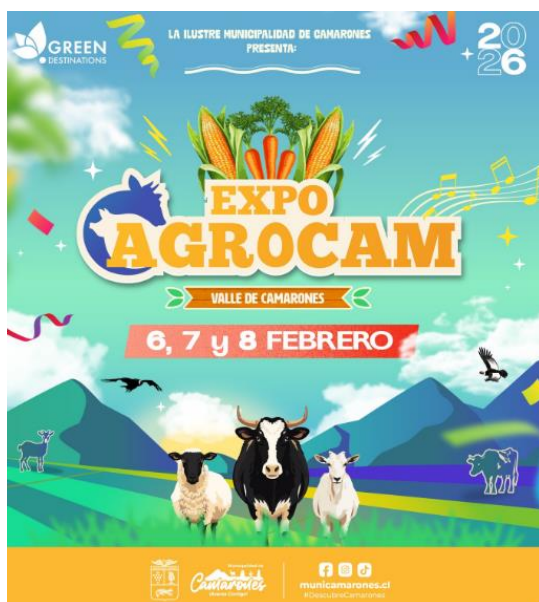
Afiche Expo AGROCAM, 2026

Se ha consolidado como el Festival del Verano de la región, ofreciendo una experiencia completa y única en el corazón de Camarones. Con un enfoque rural y auténtico, profundamente ligado a la agroproductividad, el evento combina lo mejor de la cultura, las tradiciones locales, la gastronomía y el entretenimiento, convirtiéndose en un espacio ideal para compartir en familia. Es organizado por la Municipalidad de Camarones y se realiza en el mes de febrero ( https://short.do/0hRP4r ).