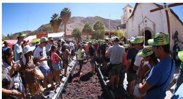
Fiesta de la Vendimia

Durante la vendimia se puede disfrutar de gastronomía, grupos folclóricos, visitas guiadas al valle, una elección de reina, la tradicional pisada de uvas, talleres infantiles, muestras hortofrutícolas y mucho más (Servicio Nacional de Turismo).