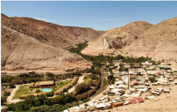
Valle de Codpa

El valle de Codpa ha sido, desde la antigüedad, una de las principales zonas para el intercambio cultural y comercial entre el altiplano y los pueblos costeros del norte. Especialmente durante la decadencia del imperio Tiwanaku, cuando grupos indígenas carangas se establecieron en el lugar y comenzaron a complementar sus actividades de pastoreo altiplánico con la producción de recursos agrícolas. Para eso, Codpa –o "pedregal" en aymara– era el lugar indicado: a pesar de estar en medio del desierto, es un valle sorprendentemente verde y fértil, de clima apacible, y donde se producen frutas, verduras, y un vino muy particular llamado pintatani, similar a la chicha (Servicio Nacional de Turismo, 2012)