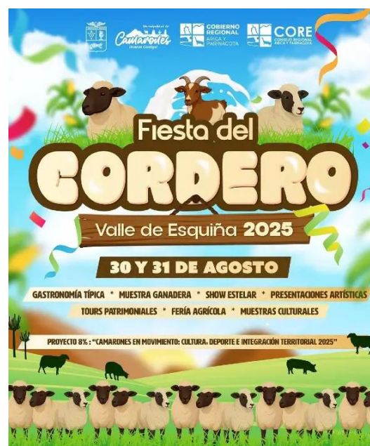
Afiche Fiesta del Cordero de Esquiña, 2025

Además se puede encontrar la mejor gastronomía basada en el cordero preparado por manos maestras que preservan recetas y técnicas tradicionales ( https://short.do/geLipm ).