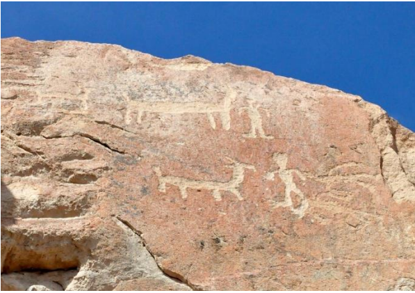
Petroglifos de Ofragía

Se ubican en el margen oeste del valle de Codpa, a seis kilómetros de la localidad del mismo nombre. Comprenden un conjunto de unos 60 bloques con grabados prehispánicos que datan entre el año 1.000 y 1.500 d.C. aproximadamente. Fueron realizados por agricultores y ganaderos, que además realizaban viajes hacia otros valles y sectores mediante caravanas de llamas para intercambiar sus productos (Servicio Nacional de Turismo, 2012).