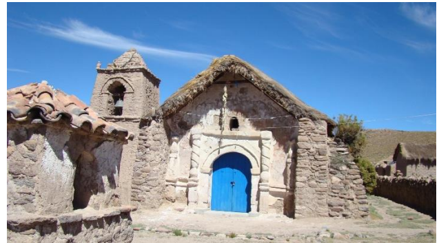
Iglesia de Mulluri

Declarada Monumento Histórico D.E. 1778 del 24/11/2005. La iglesia aún se mantiene en pie, a pesar de que los relatos de los habitantes del sector cuentan que data de fines de 1800. Posee una campana de cobre, tiene cuatro altares y una plaza. En su interior se aprecia la imagen en escultura de la virgen de la Natividad y San Santiago, entre otros. Sus paredes interiores están pintadas con figuras religiosas. Fue hecha en adobe (barro y paja) y su techo es de vigas de cactus y paja, el piso es de greda cocida. Pertenece a la Comunidad Indígena de Mulluri (Servicio Nacional de Turismo, 2012).