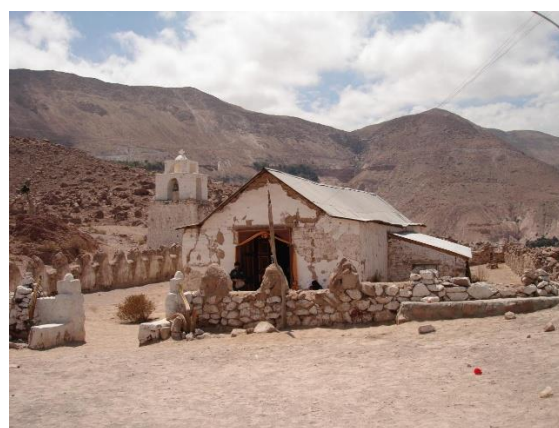
Iglesia San José de Pachica

Declarada Monumento Histórico en 2015. Destaca por su hermosa arquitectura colonial. Construida en el siglo XVII, esta iglesia se caracteriza por su impresionante fachada y sus detallados elementos decorativos. Situada en un entorno pintoresco, la iglesia atrae a numerosos visitantes y fieles que buscan conocer su historia y disfrutar de su belleza arquitectónica. A lo largo de los años, ha sido sometida a varios procesos de restauración para preservar su esplendor original ( https://short.do/wy4NW1 ).