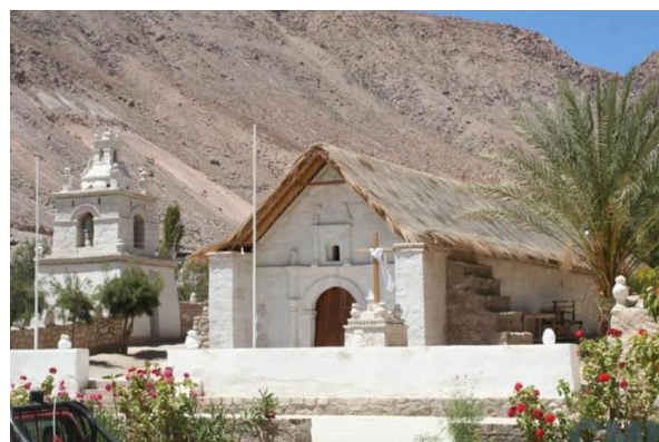
Iglesia de Guañacagua

Declarada Monumento Histórico D.E. 3365 del 05/11/2008. La Iglesia se emplaza en un plano horizontal entre la ribera oriente del río y el cerro. La iglesia además de ser significativa por su atrio se jerarquiza por una explanada, plazoleta ceremonial de las festividades religiosas ubicada en su parte frontal, por su configuración de anfiteatro que favorece a la congregación de los feligreses sobre todo en las “quemadas” (entierros de cada año y los carnavales tradicionales). La construcción de la iglesia se remontaría al siglo XVII, según consta en los libros parroquiales de Codpa (Servicio Nacional de Turismo, 2012).