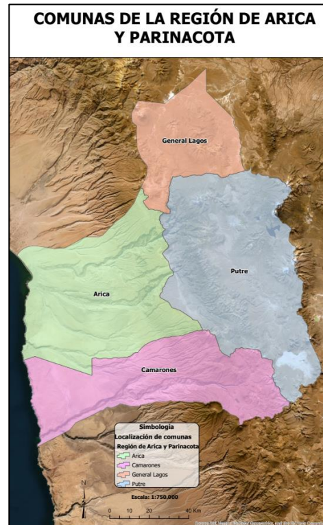
Comunas de la Región de Arica y Parinacota

La comuna presenta una ocupación humana continua en sus territorios de más de 7500 años de antigüedad, existiendo un valioso patrimonio arqueológico a causa del vestigio de las momias más antiguas del mundo, pertenecientes a la cultura Chinchorro; así también hasta el día de hoy cuenta con expresiones de aquella época prehispanica y posterior época colonial, las cuales se pueden apreciar en las construcciones de adobe de sus localidades, incluyendo iglesias y lagares, estos patrimonios tangibles son los cimientos de tradiciones cargadas de sincretismo cultural y espiritual propias de la zona Andina (Fundación Superación de la Pobreza, 2021).