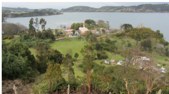
Entorno de la Iglesia Nuestra Sra. del Rosario

La localidad de Chelín se remonta al año 1734, cuando según los registros parroquiales se hablaba de Chelín como un "pueblo de indios con capilla". La actual iglesia tiene una data aproximada del año 1888 y cuenta con un cementerio adyacente. Así como las otras iglesias de la llamada Escuela Chilota de Arquitectura Religiosa en madera. El área protegida de la Zona Típica tiene una superficie aproximada total de 388.842,03 m 2 (Consejo de Monumentos Nacionales).