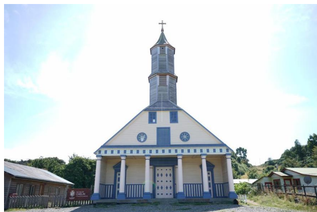
Iglesia Nuestra Señora del Rosario de Chelín

Fue declarada Monumento Histórico mediante DE N° 508 el 13 de noviembre de 2000 (Consejo de Monumentos Nacionales).