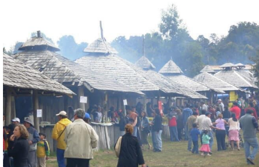
Festival Costumbrista Chilote

Se desarrolla en el Parque Municipal "Mario Uribe Velásquez" en el mes de febrero. Creado en 1979, este festival tiene como misión principal la preservación de las tradiciones rurales de Chiloé, presentando una variada oferta de platos típicos como el curanto y el milcao, junto a demostraciones de faenas tradicionales como la esquila de ovejas. Con una concurrencia que supera los 100.000 asistentes anuales, el festival se ha consolidado como un hito cultural de gran relevancia para la comuna y para todo el archipiélago (Municipalidad de Castro, 2025).