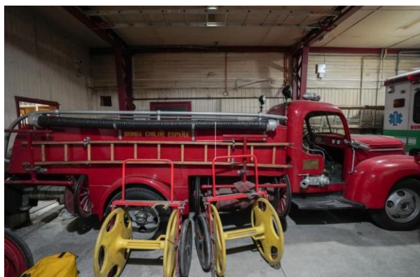
Reliquias bomberiles del Cuerpo de Bomberos de Castro

La ciudad de Castro, desde su fundación en 1567, había sufrido una serie de siniestros que modelaron el rostro urbanístico de la ciudad, ya que a intervalos muy cortos los incendios reducían a escombros manzanas y calles completas que luego debían ser reedificadas. Luego del último gran incendio del siglo XIX en Chiloé y de la necesidad creciente de proteger a la ciudadanía y sus bienes materiales de la acción del fuego, un grupo de vecinos funda el 08 de marzo de 1896 el Cuerpo de Bomberos de Castro como institución pública, motivados en gran parte por el apoyo moral y económico de la población a los comisionados respectivos. Gran parte de esta historia que ha contribuido a la noble tarea de salvar vidas y bienes se encuentra guardada en los cuarteles de los Cuerpos de bomberos como en el de Castro, en el cual se atesoran las siguientes reliquias declaradas Monumento Histórico en el 2005: Bomba a Palanca Hamenway and sons, Estados Unidos, 1852, Bomba Manual G.A Fischer Görlitz, 1930, Bomba Automóvil Ford A.V8, Estados Unidos, 1940 (Consejo de Monumentos Nacionales).