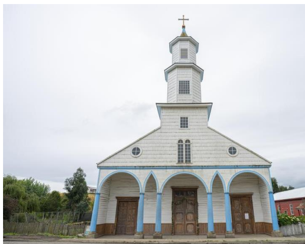
Humedal Parque Ecológico La Isla

La construcción fue declarada Monumento Histórico a través del Decreto Supremo N°1750, del 26 de julio de 1971, y Patrimonio de la Humanidad por la Unesco el 30 de noviembre del año 2000 (Consejo de Monumentos Nacionales).