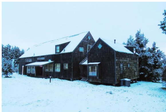
Museo de Arte Moderno Chiloé

Inaugurado en 1989, está ubicado en terrenos del Parque Municipal de Castro. Ocupa una "Casa-Fogón" de los años 70, reconocida en la X Bienal de Arquitectura de Santiago. Se dedica al arte contemporáneo con exposiciones y talleres de más de 300 artistas chilenos (Municipalidad de Castro, 2025).