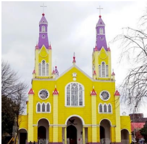
Templo de San Francisco de Castro

La obra se aparta de la tradición chilota en algunos aspectos, pues conjuga un diseño neogótico y clásico con la tradición constructiva local. Sus naves poseen bóvedas de crucería y están separadas por columnas y arcos de medio punto. Sus ventanas están adornadas con vitrales, lo que otorga una interesante iluminación sobre la madera (Consejo de Monumentos Nacionales).