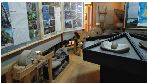
Museo Municipal de Castro

Creado en 1967 durante la conmemoración de los 400 años de Castro. Exhibe patrimonio material e intangible del archipiélago: herramientas, fotografías históricas ("Colección Provoste"), réplicas de embarcaciones, iconografía religiosa, cestería y material lítico. Recibe más de 12.000 visitas anuales, consolidándose como un referente cultural (Municipalidad de Castro, 2025).