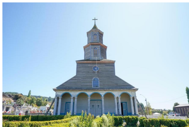
Iglesia Nuestra Señora de Gracia de Nercón

Fue construida entre 1879 y 1890 con la aprobación del Obispo de Castro. El material predominante en esta edificación neorrománica de 40 metros de largo por 15 metros de ancho fue la madera de alerce y la de ciprés. La iglesia cuenta con una torre de 25 metros, visible desde una gran distancia. En el interior del templo, se observan pilares que sostienen arcos de medio punto y una bóveda de la nave central con arco rebajado. Además, la iglesia cuenta con una valiosa imagerie, mobiliario y pinturas marmoladas que se conservan hasta hoy. La iglesia ha sido restaurada en distintas oportunidades, gracias a los aportes públicos y de organizaciones privadas. En 1984, junto con otras 15 iglesias de la zona, fue declarada Monumento Histórico por constituir un sobresaliente exponente de la arquitectura tradicional religiosa de Chiloé. En el año 2000, la Unesco declaró a estas iglesias como Patrimonio de la Humanidad (Consejo de Monumentos Nacionales).