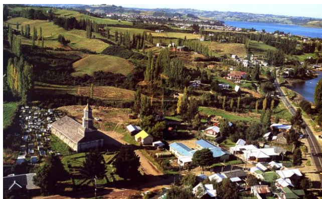
Entorno de la Iglesia Nuestra Señora de Gracia

Nercón significa "entre lomas", en lengua huilliche. Se caracteriza por su sinuosa geografía. Destacándose sus suaves colinas separadas por esteros y ríos que desembocan generando mesetas que forman pequeñas penínsulas hasta llegar al mar. La localidad de Nercón se ha desarrollado explosivamente desde la década de 1890, situación asociada directamente al desarrollo de la industria del salmón y a la cercanía de Castro, qué está a solo 4 kms. de distancia. La proyección de crecimiento indica que Nercón se seguirá poblando hacia sus lomajes más altos. La iglesia y su plaza (explanada) se imponen como un elemento central y fundacional que determina la conformación del poblado. Los tenues lomajes y quebradas que van descendiendo hacia el mar enmarcan al templo y su cementerio, que rodea la capilla por su lado poniente y toda su fachada posterior (Consejo de Monumentos Nacionales).