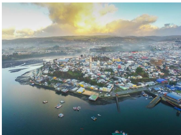
Casco Histórico de Castro

Debido a su emplazamiento, cuenta con un entorno paisajístico natural de notables características y conos visuales, donde destaca el fiordo de esta parte de la península, junto con las vistas desde y hacia la península de Rilán. Destacan en el entorno las vistas desde y hacia el paisaje natural y construido de los palafitos Gamboa y Pedro Montt, los cuales aportan a la identidad de Chiloé (Consejo de Monumentos Nacionales).