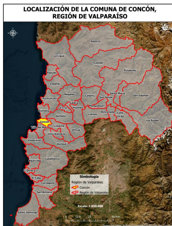
Límite comunal Concón

los años, pese a los distintos sucesos por los que pasó, Concón continuó progresando. En el inicio de 1990 la ciudad comenzó a buscar una unidad comunitaria que tuvo como objetivo el descentralizar a Concón de Viña del Mar. Durante este proceso, se logra finalmente una buena acogida por el Gobierno Central, el cual, a través de una iniciativa legal, materializó a través de la ley 19.424 la constitución por segunda vez de la comuna de Concón, situación que fue decretada el 28 de diciembre de 1995 (Municipalidad de Concón, 2022).