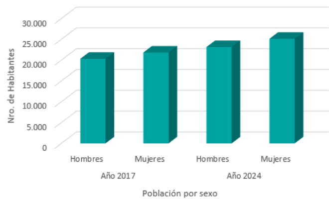
Población por sexo 2017 y 2024, comuna de Concón