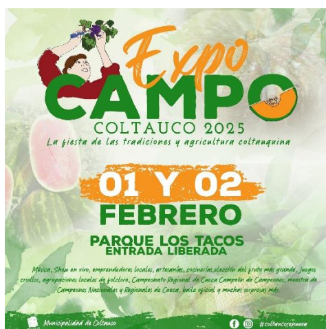
Afiche Expo Campo

Se realiza en la localidad de Almendros y es organizada por la comunidad. Se hace una peregrinación por el sector, posteriormente se realiza una misa de campaña en el exterior del recinto oficiada por un obispo de la zona. Continúa la celebración por la tarde con una muestra artística ofrecida a la virgen (Municipalidad de Coltauco, 2018).