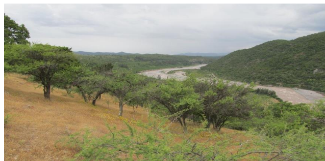
Bosque del Tinguiririca

Ubicado en la precordillera andina, cercano a los sectores de La Virgen, Las Peñas y El Espinalillo, siendo rodeado por la carretera I-45, este sitio privado, está destinado principalmente a la conservación y protección de los relictos boreales del Ciprés de la Cordillera Andina ( Austrocedrus chilensis ). Cuenta con un sendero que recorre el área sur cerca del río Tinguiririca donde se puede encontrar superficie cubierta por bosque esclerófilo, componiéndose por Robles ( Nothofagus macrocarpa ) y Cipreses. En el parque se realizan investigaciones científicas, educación ambiental y actividades productivas sustentables. Además, de actividades turísticas al aire libre tales como ciclismo, cabalgata, kayak y observación de flora y fauna. Posee una superficie de 2000 hectáreas (Municipalidad de San Fernando, 2024).