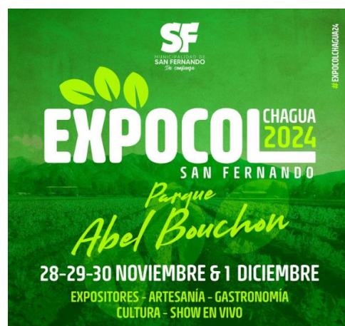
Afiche EXPOCOL, 2024

Feria que muestra la actividad agropecuaria de la región. La exposición Agrícola, Ganadera, Industrial, Artesanal y del Caballo, de la región del Libertador Bernardo O'Higgins, se desarrolla en el Parque Abel Bouchon de San Fernando, donde se presentan distintos Servicios Públicos (Municipalidad de San Fernando, 2024).