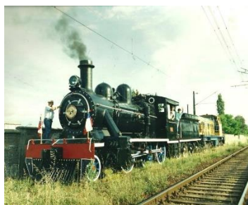
Locomotora a Vapor

Apelando a su valor histórico como parte del patrimonio ferroviario nacional, es que la Locomotora a vapor tipo 57 N° 607, y su (tándem) ténder, fueron declarados Monumentos Nacionales en su categoría de Monumento Histórico el 8 de febrero del año 1996 (Consejo de Monumentos Nacionales).