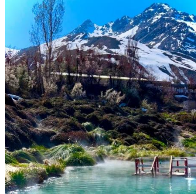
Termas del Flaco

Este es el principal atractivo turístico de la comuna y de la región, y sin duda alguna uno de los sectores más visitados por turistas a nivel nacional. También llamadas Baños del Tinguiririca y Las Vegas del Flaco, son unos baños termales ubicados junto al Río Tinguiririca y a 1.750 metros sobre el nivel del mar. Las propiedades de estas termas comenzaron a ser estudiadas en 1861 por Ignacio Domeyko (Municipalidad de San Fernando, 2024).