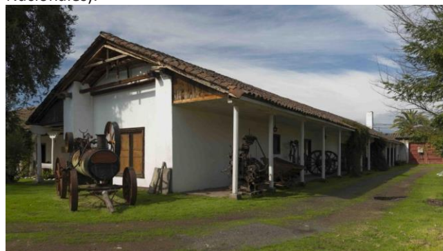
Casa Patronal Fundo Nilcunlauta

Por su antigüedad y valor en cuanto a la fundación de la ciudad de San Fernando, se declaró Monumento Histórico en 1981 (Consejo de Monumentos Nacionales).