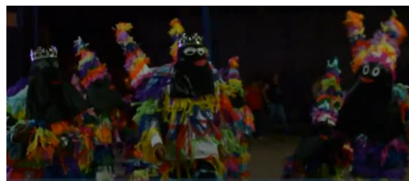
Pascua de Los Negros

Se celebra desde la época colonial, consolidándose como una de las festividades más emblemáticas de San Fernando, al ser una festividad única en el territorio comunal. Esta festividad surge a partir de la consagración de festividades antiguas de los esclavos negros que llegaban a la zona, principalmente los que trabajaban en la Hacienda Los Lingues. Consiste en una carrera al cerro, donde se porta una antorcha; posteriormente, se establecían fondas y se bailaba al ritmo de la resbalosa, cuecas y tonadas locales. Cabe señalar que esta celebración se llevó a cabo hasta el año 1930 y se logró retomar el año 2008 gracias al trabajo de la Ilustre Municipalidad de San Fernando y la Fundación Margot Loyola, congregando a la comunidad los días 5 y 6 de enero de cada año (Municipalidad de San Fernando, 2024).