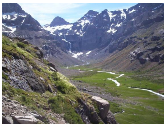
Valle de Popeta

Es un balneario precordillerano donde el curso superior del río Claro da origen a las pozas naturales de Santa Fe, Las Vertientes y Puente Negro, todo rodeado de una abundante y variada vegetación (Municipalidad de San Fernando, 2024).