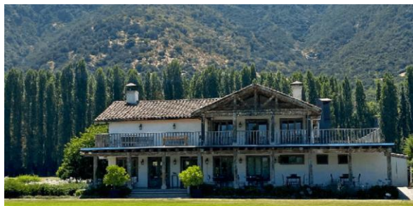
Viña Casa Silva

Cuenta con la bodega y viñedos más antiguos y tradicionales del valle. En 1997, la familia Silva decide comenzar a embotellar los vinos con su propia marca. La viña pertenece a la ruta del vino de Colchagua (Municipalidad de San Fernando, 2024).