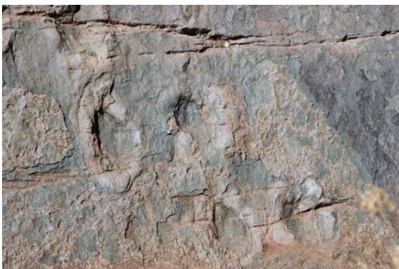
Huellas de animales extintos

Declarado Monumento Histórico D.S. 4866 del 13/07/1967. De más de 120 millones de años de antigüedad, puede visitarse como atractivo turístico. Las huellas, dejadas en el barro por un Iguanodonte, se solidificaron y volvieron a aflorar (Municipalidad de San Fernando, 2024).