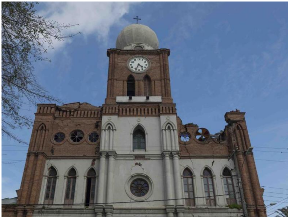
Iglesia de San Francisco

Fue construida bajo la dirección de fray Juan Bautista Labra, quien contó con el financiamiento de los feligreses de la localidad. Se inició su construcción en 1891. El edificio se compone de tres naves separadas por arquerías, además de dos naves laterales decoradas con grandes altares. El estilo ecléctico de la iglesia refleja las distintas influencias arquitectónicas de fines del siglo XIX, predominando el neo románico y el neogótico. La construcción cuenta además con una torre de 32 metros que termina en una cúpula añadida en 1930. Fue declarada Monumento Nacional en 1984 pues constituye una presencia permanente de la imagen urbana de la ciudad y un hito señalizador, además de su valor histórico y arquitectónico (Consejo de Monumentos Nacionales).