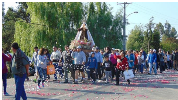
Peregrinación a Roma

Se realiza cada primer domingo de diciembre. En esta procesión religiosa, los feligreses de las parroquias católicas se juntan para recorrer con la Virgen del Carmen un recorrido de 12 kilómetros desde San Fernando hasta la iglesia que se ubica en la localidad de Roma. Al llegar, se realiza una misa masiva con un desayuno para los asistentes, siendo principalmente “huasos” con sus trajes típicos (Municipalidad de San Fernando, 2024).