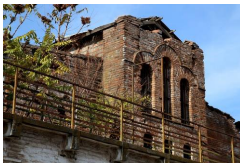
Cárcel de San Fernando

El edificio fue declarado Monumento Nacional mediante Decreto Nº 15 del 27/01/09, del Ministerio de Educación (Consejo de Monumentos Nacionales).