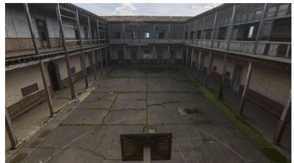
Patio Liceo Neandro Schilling