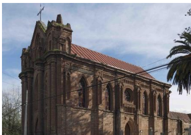
Capilla Hijas de la caridad de San Vicente de Paul