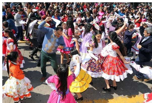
Mil Pañuelos al Viento

Más de mil parejas se reúnen voluntariamente para bailar la cueca, el baile nacional. Lo hacen con los pañuelos al viento, en el marco de las celebraciones de Fiestas Patrias. La fiesta es organizada por la Municipalidad de San Fernando (Municipalidad de San Fernando, 2024).