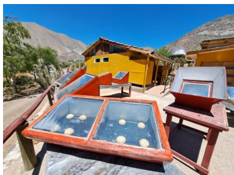
Cocinas solares Villaseca

Debe su nombre a una gran sequía que azotó a la localidad en el año 1850. Los primeros pobladores tuvieron que luchar con la sequía y la intensidad del sol. En la actualidad, los pobladores utilizan la energía solar para aprovecharla en actividades como la agricultura y la gastronomía. Su principal atractivo son las cocinas solares en donde se elaboran platos típicos y son visitados por miles de turistas al año (Servicio Nacional de Turismo, 2022).