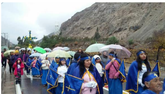
Cruz de Mayo

En el ámbito religioso, en Chapilca se encuentra presente una capilla, donde se celebra todos los años la celebración de la Cruz de Mayo. Esta cruz es la patrona de la comunidad, por lo cual todos los meses de mayo se realiza una procesión donde participan devotos y feligreses de distintas localidades cercanas, se tocan instrumentos y se realizan danzas y bailes chinos como ofrenda (Municipalidad de Vicuña, 2021).