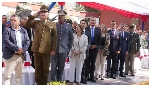
Celebración Aniversario 204, año 2025

Se celebra el 22 de febrero con una misa de acción de gracias, acto cívico militar, reconocimiento a personalidades y desfiles de honor (Servicio Nacional de Turismo, 2022).