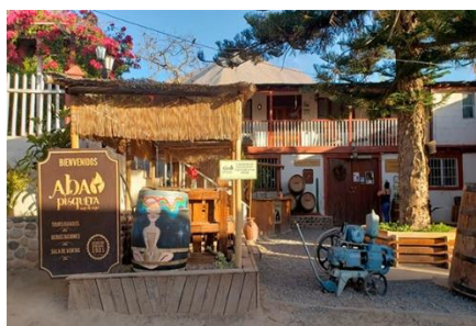
Pisquera Aba

En la localidad de El Arenal se encuentra una planta y destiladora artesanal de pisco Aba destinado a la exportación. Las instalaciones se pueden visitar durante todo el año (Servicio Nacional de Turismo, 2022).