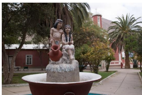
Plaza Daiguitas

Ubicado a 8 kilómetros al oriente de Vicuña. Ocupado por la cultura Diaguita entre los siglos XII y XV d.C. Ellos desarrollaron la agricultura y la alfarería. Fue declarada zona típica por el Consejo de Monumentos Nacionales de Chile en el año 2013, debido a lo pintoresco de la localidad, con su forma alargada y sinuosa, con casas alineadas casi uniformes a los costados de su calle principal adoquinada. Además, cuenta con bellas postales como su hermosa plaza, su centenaria capilla y una agradable ribera de río (Servicio Nacional de Turismo, 2022).