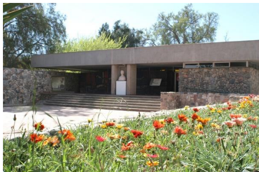
Museo Gabriela Mistral

Construido en 1971 basado en el diseño del arquitecto Oscar Mc Clure y el muralista Elías Castro, en el lugar donde naciera un 7 de Abril de 1889 la poetisa Gabriela Mistral. El edificio emplea la piedra, el vidrio y el agua, elementos del valle que están presentes en la obra de la poetisa y educadora, y que en 1945 recibiera el Premio Nobel de Literatura. Guarda objetos personales, premios, fotografías y libros entre otros y exhibe una réplica de su casa natal. Posee salas de animación, biblioteca, salas para exposiciones y reuniones, además de un hermoso patio o huerto que formó parte de la casa original (Servicio Nacional de Turismo, 2022).