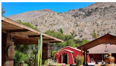
Centro Turístico Capel y Museo del Pisco

Aquí se produce el famoso pisco Capel, que en sus múltiples variedades ha dado fama al valle. Se ofrece un recorrido por la planta, conociendo todo el proceso de elaboración, degustaciones, sala de venta de productos y recuerdos, además de un Museo del Pisco que exhibe la historia de este licor tan antiguo. También dispone de una sala de actividades culturales (Servicio Nacional de Turismo, 2022).