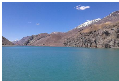
Embalse La Laguna

Se ubica a 2.200 de altitud, a 90 kilómetros al este de Vicuña por un camino pavimentado. Está operativo desde finales de noviembre y hasta mediados de mayo según condiciones climáticas. En el trayecto hacia el límite se visualiza el embalse La Laguna (Servicio Nacional de Turismo, 2022).