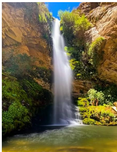
Salto Los González

Este secreto de la montaña, ubicado casi en el límite con Argentina, es uno de los rincones más desconocidos y bellos del Choapa. En la zona, el río González forma un salto por el aporte de una cascada originada en el afluente, la cual se accede a través de un trekking, de mediana dificultad. Ubicado a 27 km de Salamanca (Servicio Nacional de Turismo, 2022).