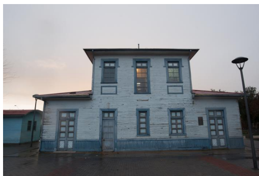
Estación de Ferrocarril de Salamanca

Fue declarada Monumento Histórico en el año 2004 (Servicio Nacional de Turismo, 2022).