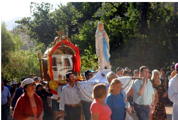
Fiesta del Señor de La Tierra

Santuario Religioso que fue construido a mediados del siglo XX, ubicado a 12 kilómetros al noreste de Salamanca, Valle de Chalinga. Es la fiesta religiosa más importante de la provincia del Choapa, pues recibe a unos 3 mil peregrinos. Se celebra en el mes de enero. El crucifijo con la imagen del Señor de la Tierra habría aparecido cuando unos niños lo desenterraron cerca de un litre. Los pequeños pastores de cabras habrían tenido la imagen hasta que su padre, un pirquinero, se las quitó para prenderle velas y pedirle bonanza en su trabajo. Ante los buenos resultados que obtuvo comentó a sus vecinos acerca de la capacidad milagrosa del “santito”, originando así la Fiesta del Señor de la Tierra (Servicio Nacional de Turismo, 2022).