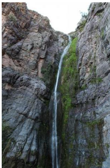
Raja de Maquehua

Se ha registrado un conjunto de especies de vertebrados nativos en el área, de los cuales 49 corresponden a aves, seis a reptiles, dos a anfibios y tres a mamíferos. Tanto los reptiles como los anfibios destacan por un alto nivel de endemismo (Consejo de Monumentos Nacionales).