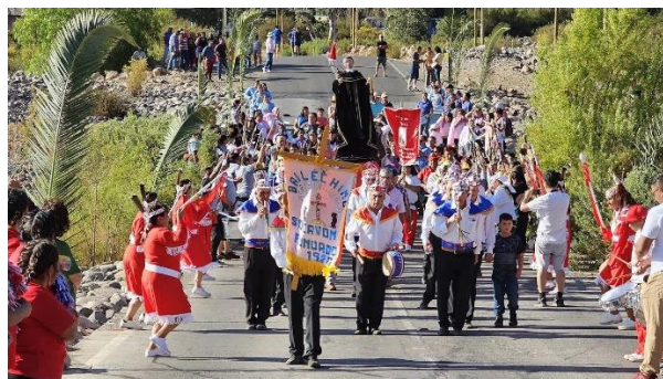
Fiesta San Juan de Dios

En Arboleda Grande, valle de Chalinga a 8 kilómetros al este de Salamanca en el mes de marzo, se realiza esta festividad en honor de su santo patrono. La imagen de San Juan es trasladada en procesión hasta la ribera del río Chalinga para que reciba las plegarias de sus feligreses (Servicio Nacional de Turismo, 2022).