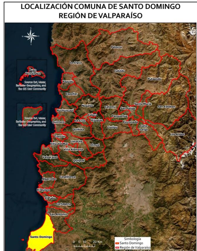
Limite comunal Santo Domingo

La comuna de Santo Domingo se creó bajo el Artículo 4º de la Ley N° 8.409 del 21 de enero de 1946. El acta inaugural data del domingo 17 de febrero del mismo año, donde en sesión extraordinaria, se crea por decreto N° 317 la primera Junta de Vecinos (Municipalidad de Santo Domingo, 2016).