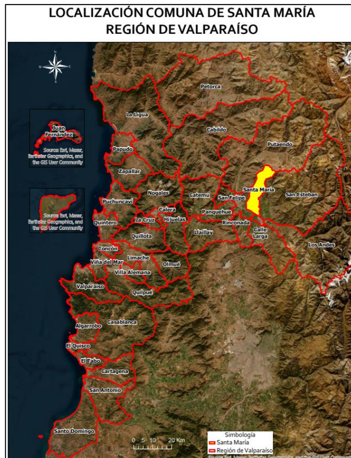
Limite comunal Santa María

Fuente: Elaborado a partir de la División Política Administrativa de la Subsecretaría de Desarrollo Regional y Administrativo (2023).