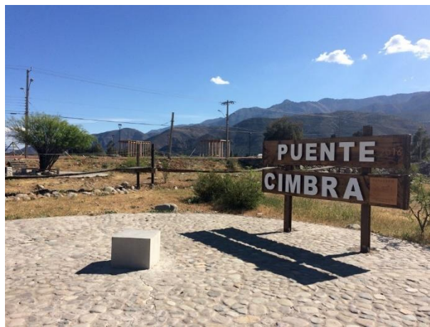
Parque Puente Cimbra

En el mismo parque se emplaza una escultura de casi tres metros de altura llamada “La Temporera”, construida de pequeñas placas de acero galvanizado que muestran a una mujer en pies descalzos, que está cosechando un durazno de la rama de un árbol con una de sus manos, mientras su otra extremidad está sosteniendo un capacho con los carozos que ya ha recogido, inmortalizando de esta manera el trabajo de las mujeres campesinas del Valle de Aconcagua (Municipalidad de Putaendo).