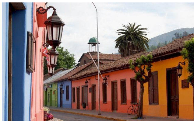
Calle Comercio

Calle Comercio forma parte de la Zona Típica de Putaendo, declarada como tal en el año 2002 por el Ministerio de Educación (Municipalidad de Putaendo).