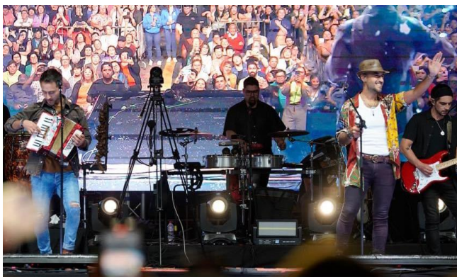
Carnaval de La Chaya

Se le considera el carnaval más largo de todo Chile, ya que contempla nueve jornadas musicales en la Plaza Prat de Putaendo. En el verano del 2024 se vivió la versión número 92, donde participan artistas nacionales y locales. Es uno de los panoramas gratuitos más atractivos de la región, asistiendo miles de personas cada año (Municipalidad de Putaendo, 2024).