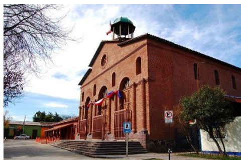
Iglesia San Antonio de Padua

La Parroquia de San Antonio de Padua de Putaendo, es uno de los mejores construidos de la Diócesis, siendo un orgullo para la comuna y la comunidad religiosa (Municipalidad de Putaendo).