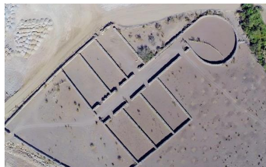
Vista aérea Corrales de Chalaco

Por su importancia en la historia de Putaendo el 23 de Agosto de 2017 los Corrales del Chalaco son declarados Monumento Histórico Nacional (Municipalidad de Putaendo).