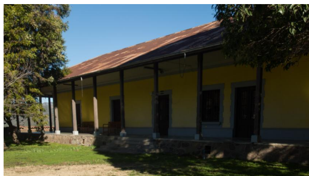
Hacienda Lo Vicuña

Declarada Zona Típica D.E. 984 del 11/04/2008. Se formó en 1790, al dividirse la antigua hacienda de Putaendo. Entre 1839 y 1880 se edificaron la actual iglesia, las bodegas, los corralones y la pulpería. La casa patronal fue reconstruida en 1915. El conjunto tiene el clásico esquema de una hacienda, con un gran patio, una explanada y la distribución jerárquica de las bodegas y las casas de inquilinos. Finalmente está la casa patronal, que en este caso no se integra con claridad, pues su estilo es diferente al resto (Servicio Nacional de Turismo, 2012).