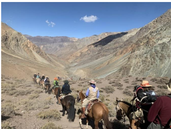
Ruta Patrimonial Ejército de los Andes

El 20 de marzo de 1831, la Asamblea de Aconcagua le otorgó a Putaendo el título de Villa San Antonio de la Unión de Putaendo. Fue el primer poblado al que llegó el ejército patriota en 1817 (Primer pueblo libre), ingresando por el sector Los Patos. Con tal antecedente, la denominada Ruta Patrimonial del Ejército Libertador está constituida por el paso fronterizo de Los Patos, el monolito Batalla de Achupallas, la capilla El Tártaro, el Pimiento Centenario y el monumento Combate de Las Coimas (Municipalidad de Putaendo).