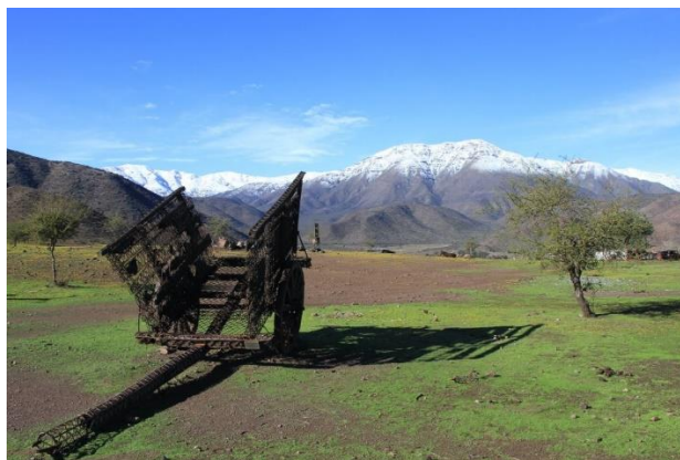
Parque Escultórico Cementerio de Carretas

El Parque cuenta con 16 hectáreas, albergando además variadas esculturas inmortalizadas en distintos puntos del parque, obras realizadas por artistas de diferentes países como Francia, Argentina, Estonia, Holanda y Chile, que participaron de diferentes simposios organizados en la comuna y que sus obras han prevalecido en el tiempo hasta el día de hoy (Municipalidad de Putaendo).