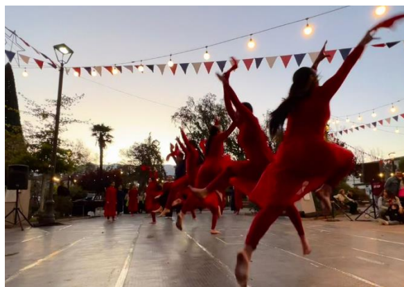
Festival Internacional de Danza "Temporeros sin Fronteras"

Esta actividad es auspiciada por la Municipalidad de Putaendo, convocando a escuelas de danza de Chile y Argentina, quienes en sus espectáculos entregan arte cultura y danza. El evento es completamente gratuito y su fin es celebrar el hito histórico del Cruce del Ejército Libertador de Los Andes (Ministerio de Cultura).