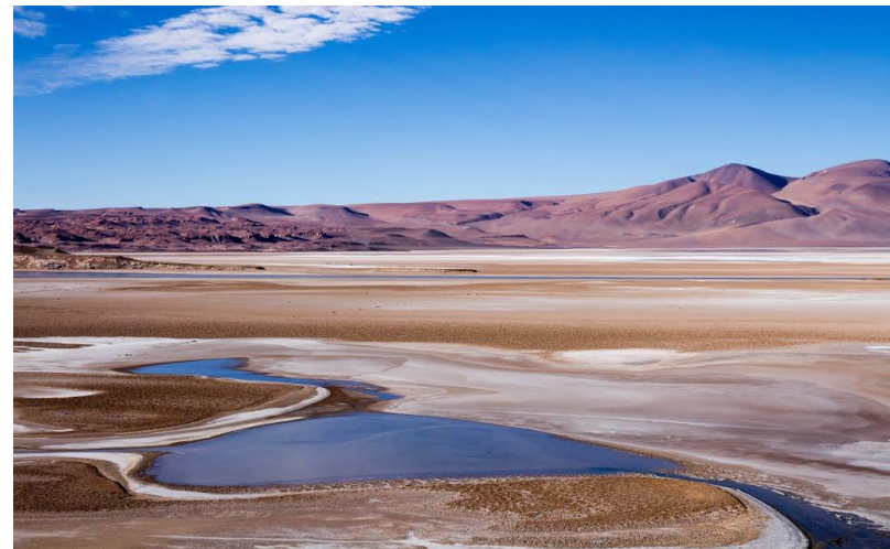
Figura N° 36 Salar de Quisquiro

En este lugar se ubica el Complejo Fronterizo Paso Jama. Posee un área de 35 km 2 y está situado a una altitud de 4.200 metros. El clima es extremadamente severo, con temperaturas que pueden registrar hasta -30°C en el invierno (junio-agosto) y con una fuerte influencia del 'invierno altiplánico' (diciembre-marzo) (Servicio Nacional de Turismo, 2012).