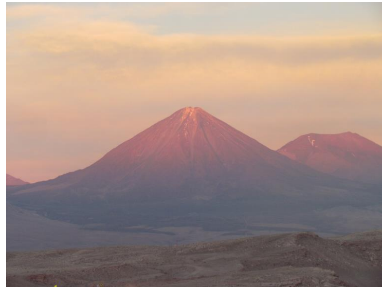
Figura N° 51 Volcán Licancabur

Es un estrato volcán situado en la frontera entre Chile y Bolivia, junto a la laguna Verde. Su última erupción tuvo lugar en el Holoceno. Sólo la ladera noreste pertenece a Bolivia, hasta los 5.400 metros desde el pie de la falda a 4360 msnm, mientras que el resto se encuentra del lado chileno, incluyendo la parte alta de la ladera noreste (Servicio Nacional de Turismo, 2012).