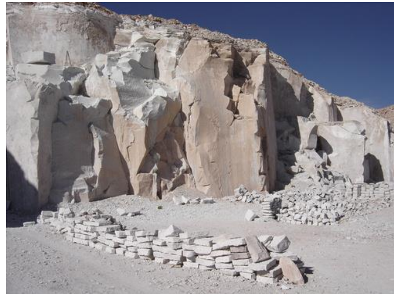
Figura N° 6 Canteras de Liparita

En el pueblo de Toconao, una de sus actividades es el tallado en piedra. Existen dos canteras de Liparita (piedra blanca de Toconao) y la piedra volcánica gris se encuentra a poca distancia del pueblo. En esta última se trabajan las figuras de torres, burros, llamos, manifestándose un cierto grado de especialización de algunos artesanos en algunas líneas del tallado. La piedra es trabajada por hombres, mujeres y niños (Servicio Nacional de Turismo, 2012).