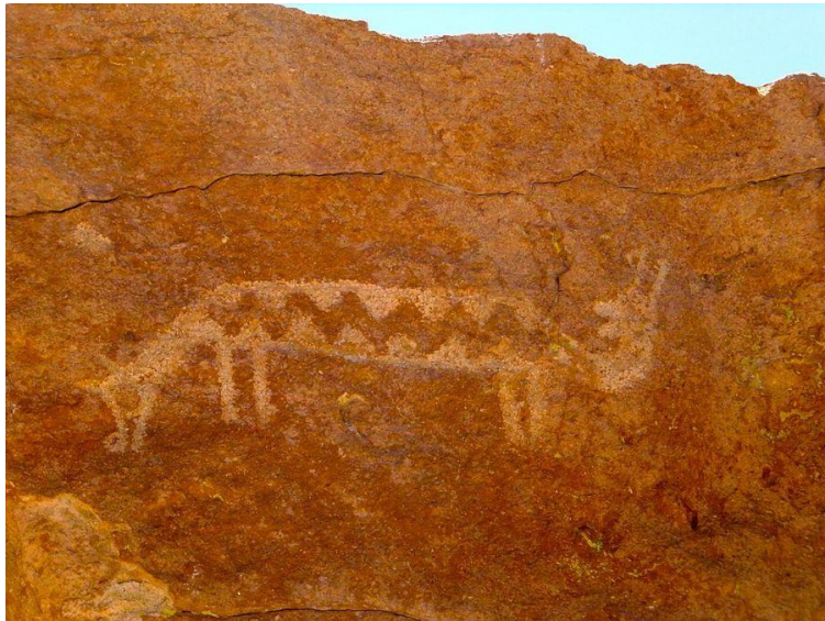
Figura N° 21 Petroglifos del valle de Yervas Buenas

Un enigma aún no descifrado son las pictografías del valle de Yervas Buenas. Se supone que corresponden a señales de rutas troperas (Servicio Nacional de Turismo, 2012).