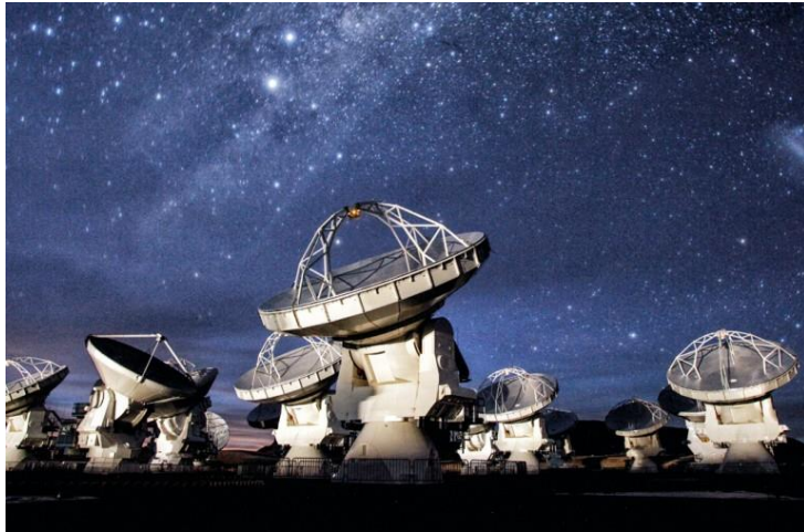
Figura N° 29 Radio Observatorio Alma