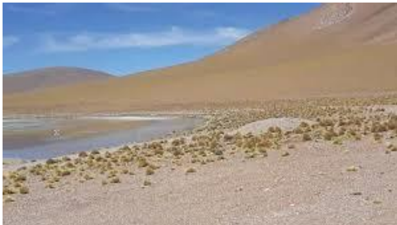
Figura N° 39 Salar de Laco

El salar de Laco se encuentra en el rincón sureste del Altiplano de la región de Antofagasta, delimitado por un anfiteatro de cerros y volcanes de alturas cercanas y sobre los 5.000 metros (Servicio Nacional de Turismo, 2012).