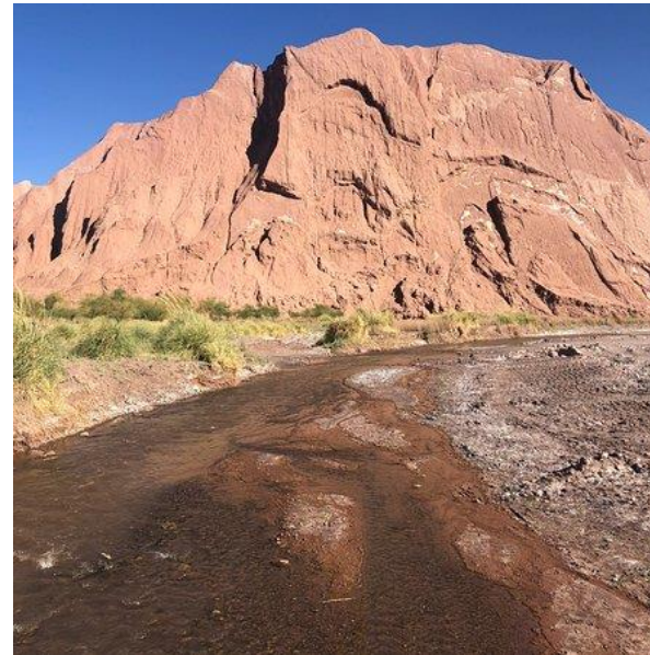
Figura N° 44 Tambo de Catarpe

Declarado Monumento Arqueológico Decreto N° 17288. Corresponde a un complejo arquitectónico prehispánico de más de 200 recintos asignados a los períodos Intermedio Tardío y Tardío con una fuerte impronta Inca, dispuesto estratégicamente sobre tres terrazas pleistocénicas a 40 metros sobre el nivel del río San Pedro (Servicio Nacional de Turismo, 2012).