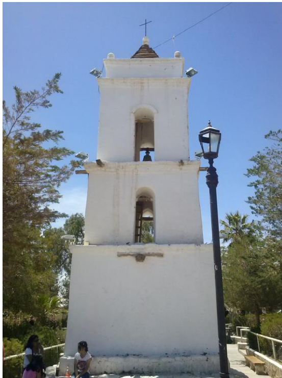
Figura N° 5 Campanario de Toconao

(madera de cactus). Vanos en el segundo y tercer nivel dan cabida a las campanas. Su construcción es de sillares de piedra unidos con argamasa de barro, estucado y blanqueado. Es todo un símbolo de la arquitectura atacameña, que suele ser reproducido a escala por los artesanos en piedra de Toconao (Servicio Nacional de Turismo, 2012).