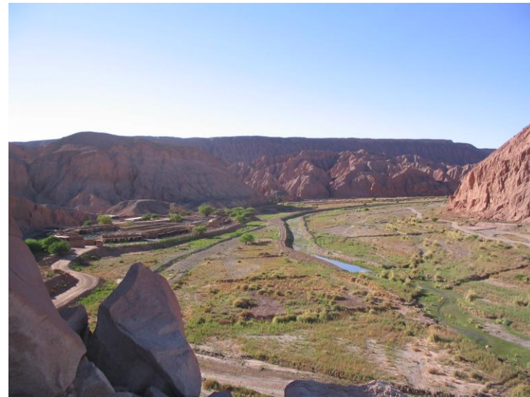
Figura N° 32 Río San Pedro

Riega el oasis de San Pedro de Atacama y termina su recorrido en el Salar de Atacama. Es un importante tributario del río Loa (Servicio Nacional de Turismo, 2012).