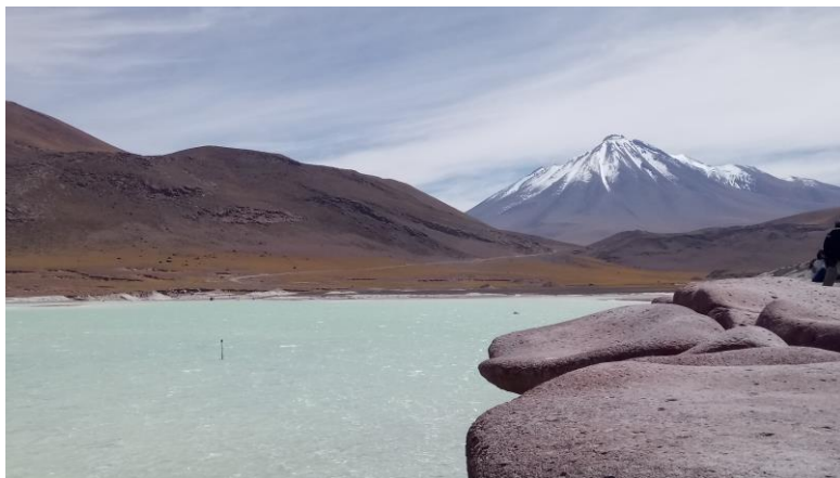
Figura N° 13 Salar de Aguas Calientes

Pertenece a la Reserva Nacional Los Flamencos. Se sitúa al este de San Pedro en plena cordillera de los Andes, con una altura máxima los 4.860 msnm. Se encuentran estructuras volcánicas y planos ondulados, existiendo columnas volcánicas al noreste del salar de Aguas Calientes. El sector presenta numerosas lagunillas, la más grande se conoce como Laguna de Tara. Las aguas de este salar (probablemente, por infiltración, de todos los que están aguas abajo) proviene del río Zapaleri que nace en el volcán homónimo, y de numerosos arroyos que surgen en los nevados de Poquis. El salar recibe aguas de esteros intermitentes que drenan los cerros La Pacana y Aguas Calientes (Servicio Nacional de Turismo, 2012).