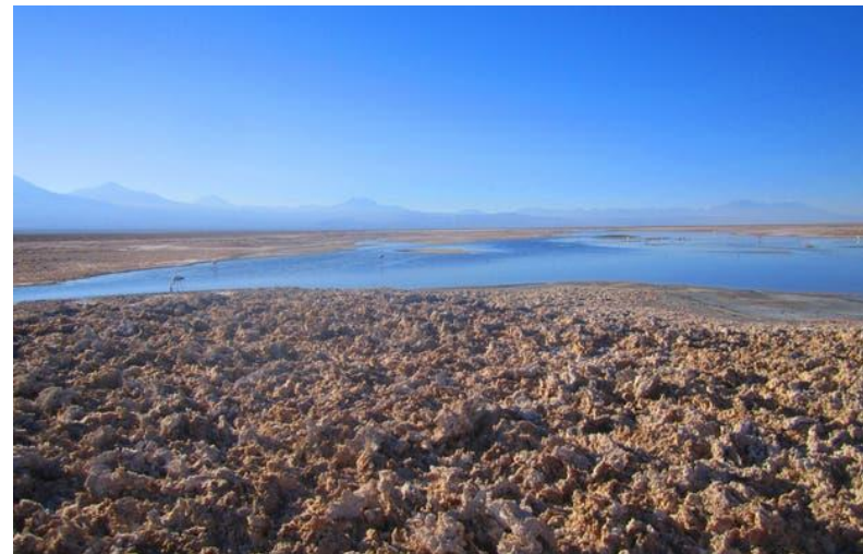
Figura N° 40 Sector de Soncor

Corresponde a una de las 7 áreas de la Reserva Nacional Los Flamencos. Inserto en el medio de la gran cuenca endorreica del salar de Atacama, el sector presenta tres lagunas interconectadas por el río Burro Muerto que nace de surgencias en pleno salar. Estas tres lagunas (de norte a sur) son Burro Muerto, Chaxas y Barros Negros. Además, como cuerpo aislado se encuentra la laguna Puilar. Todos estos cuerpos de agua son someros (máximo 70 centímetros) y, en conjunto tienen un espejo de unos 3 km 2 (Servicio Nacional de Turismo, 2012).