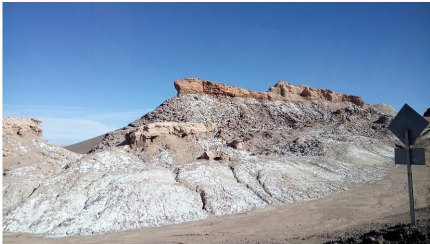
Figura N° 7 Cordillera de la Sal

Tiene sus orígenes hace más de 23 millones de años producto del plegamiento de capas horizontales de sedimento y roca, las cuales quedaron ubicadas verticalmente en la cordillera de Los Andes. Dotada de peculiares coloridos y esculpida por la erosión eólica y fluvial, su morfología la convierte en un atractivo inigualable, al poseer fantásticos brillos minerales generados por los cerros de arcilla, yeso y sal (Servicio Nacional de Turismo, 2012).