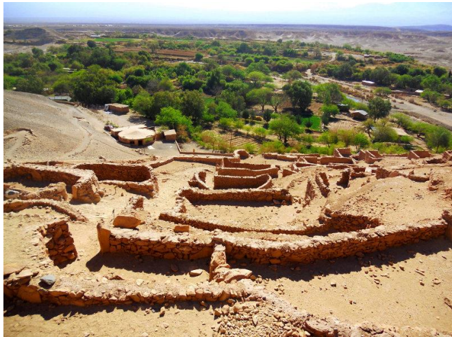
Figura N° 26 Pukará de Quitor