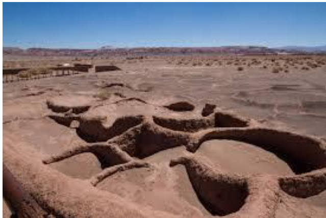
Figura N° 1 Aldeas de Tulor.

Declarada Monumento Arqueológico Decreto N° 1 del 17/03/2010. Se trata de una aldea construida directamente sobre el suelo arcilloso en la zona de desagüe del río San Pedro, la que con el tiempo fue sepultada por el avance del desierto. Hoy se sabe que la aldea abarca un área de alrededor de un kilómetro de extensión, que contiene unos 10 sitios con vestigios arquitectónicos y varios sectores con alfarería fragmentada en superficie, siendo Tulor-1 el más importante. El poblado se fechó por radiocarbono con muestras provenientes de esta ocupación, que dieron por resultado un rango ubicado entre el 345 A.C. y el 150 D.C. (Servicio Nacional de Turismo, 2012).