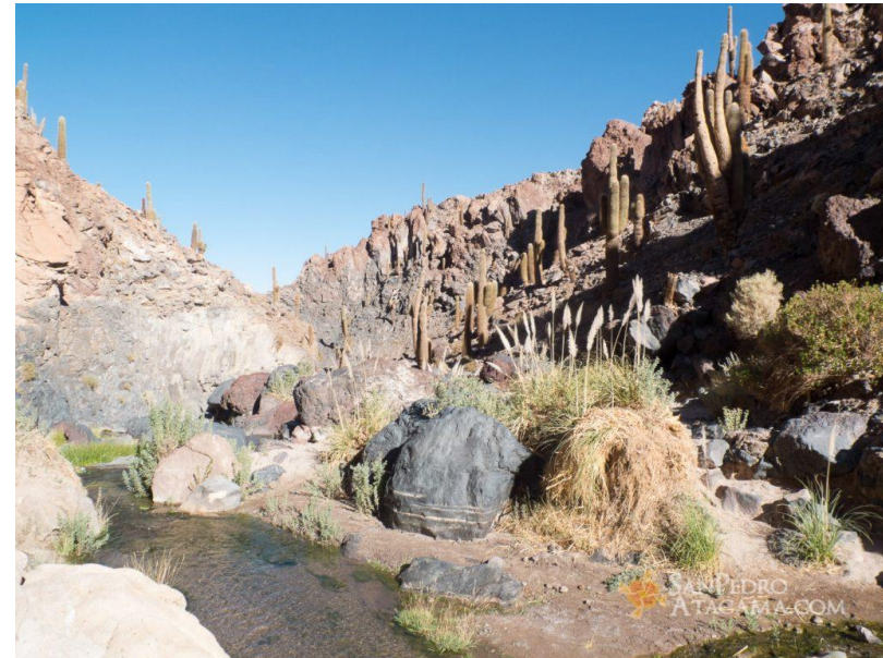
Figura N° 41 Guatín

Es conocido también como el valle de los Cactus o quebrada de Cardones, debido a la presencia de cientos de cactus echinopsis atacamensis o cardones que alcanzan 7 metros de altura y 70 centímetros de diámetro, los cuales crecen sólo 0,9 centímetros al año. Estos cactus tienen cientos de años, lo que lo convierte en un lugar místico. El yacimiento de Guatín posee los parámetros para el estudio integral de la cultura atacameña, debido a la presencia de múltiples factores bióticos y abióticos en una isla de población típica dentro de la ecología del borde de la puna. La naturaleza geomorfológica de Guatín corresponde a una falla geológica en el sistema de levantamiento de la cordillera de los Andes (Servicio Nacional de Turismo, 2012).