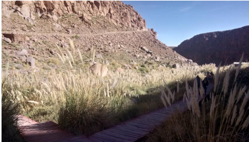
Figura N° 45 Termas de Puritama

entre 25° a 30°C y poseen propiedades curativas para enfermedades reumáticas (Servicio Nacional de Turismo, 2012).