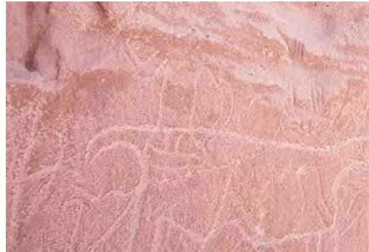
Figura N° 22 Petroglifos quebrada del Túnel

Se destacan figuras geométricas, humanas y de camélidos. Resalta la figura de un camélido en actitud de correr (Servicio Nacional de Turismo, 2012).