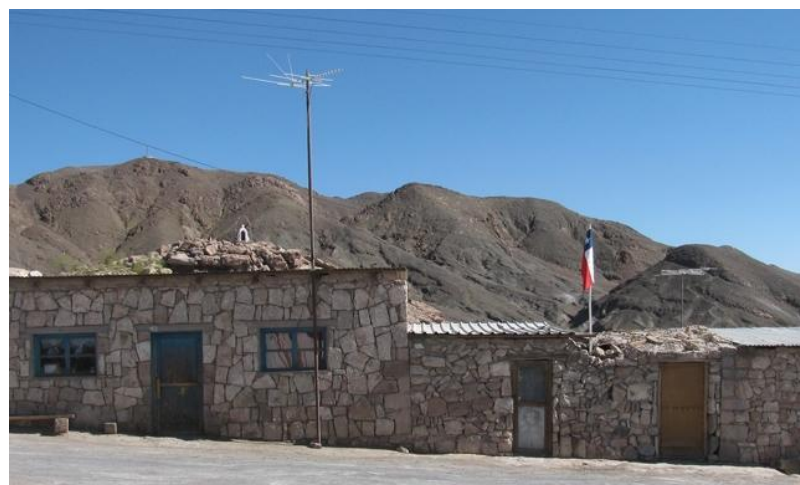
Figura N° 24 Peine, San Pedro de Atacama

ribera norte de la quebrada. Por Peine cruzaba el Camino del Inca, usado por Diego de Almagro y Pedro de Valdivia; también, hacia 1835, por el minero y explorador Diego de Almeyda y, en 1855, por Rodolfo Amando Phillippi, en su paso desde Paposo a San Pedro de Atacama. Hoy, el pueblo está dedicado casi exclusivamente a la minería del litio, dejando de lado la agricultura (Servicio Nacional de Turismo, 2012).