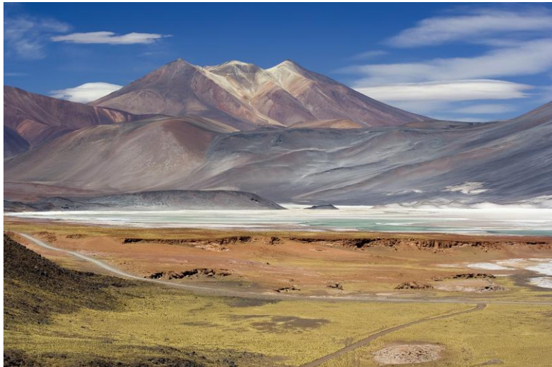
Figura N° 37 Salar de Talar

de una serie de salinas y lagos salados ubicados a lo largo de las estribaciones de una cadena de volcanes que se extienden por el borde oriental de la gran depresión ocupada por el salar de Atacama. Una importante lengua de escoria volcánica proviene del complejo de Caichinque, la cual forma dos lóbulos en dirección al salar de Talar. La vegetación del lugar se caracteriza por la presencia de gramíneas cespitosas (Servicio Nacional de Turismo, 2012).