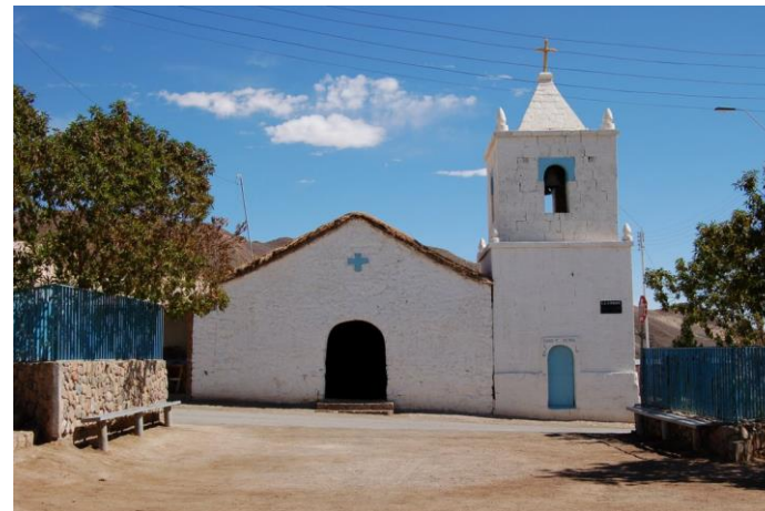
Figura N° 10 Iglesia de San Roque de Peine

Se construyó hacia el año 1750, conformada por una torre de piedra reconstruida en 1940. La iglesia está construida con piedra de la misma zona, pegada con barro con mezcla de ceniza y paja. Posee una torre o campanario al costado y es de dos pisos con dos campanas superiores y una menor. (Servicio Nacional de Turismo, 2012).