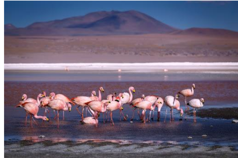
Figura N° 30 Reserva Nacional Los Flamencos

Consta de 7 sectores separados, con una altitud entre los 2.300 metros y los 5.500 metros aproximadamente y 73.986,5 hectáreas. Algunos sitios de la reserva poseen importancia arqueológica ya que en ellos se encuentran vestigios de pueblos precolombinos. Sectores: Salares de Tara, Aguas Calientes y Pujsa, Lagunas Miscanti y Miñiques, Salar de Atacama (Soncor y Quelana), Valle de la Luna, Tambillo (Servicio Nacional de Turismo, 2012).