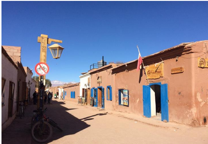
Figura N° 25 San Pedro de Atacama

altiplano de la región de Antofagasta. En esta zona geográfica se encuentran algunas de las más altas cumbres de la cordillera de Los Andes. Otrora cuna de la cultura atacameña, hoy alberga a 2.500 habitantes aproximadamente. Su gran importancia actual, se debe a que es considerada la capital arqueológica de Chile y a lo extremo de su entorno geográfico, privilegiado en cuanto a la hermosura de sus paisajes. La principal actividad económica del poblado es el turismo, seguido de la agricultura menor (pequeños cultivos y crianza de ganado menor) (Servicio Nacional de Turismo, 2012).