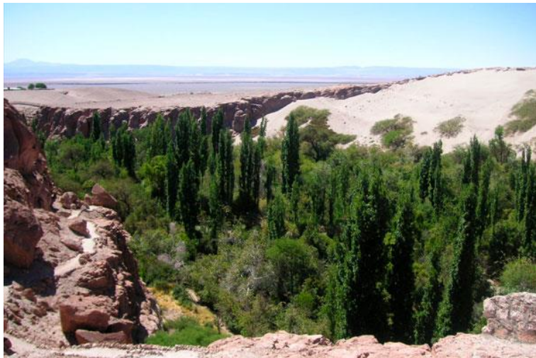
Figura N° 28 Quebrada de Jerez

abastece este vergel se debe utilizar el camino central. En esta quebrada se forman deliciosas piscinas naturales que son muy visitadas por lugareños y turistas que, especialmente en verano, buscan arrancar del calor que produce el incesante sol (Servicio Nacional de Turismo, 2012).