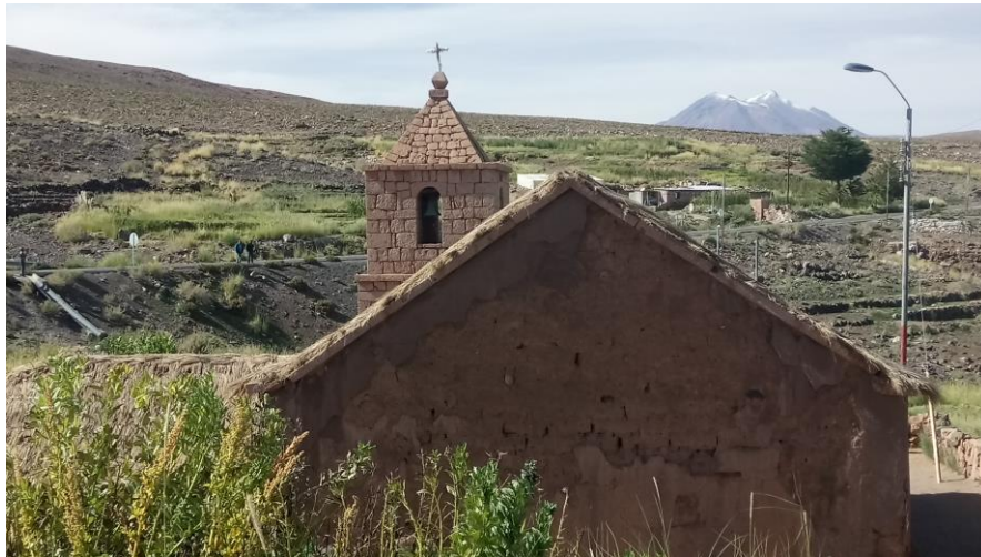
Figura N° 11 Iglesia de Socaire

Ubicada en la aldea de Socaire, la iglesia es el principal patrimonio histórico de la localidad. Su valor histórico y cultural, ofrece a los turistas una preciosa muestra artística de temática religiosa, que cuenta con obras que datan del periodo colonial (Servicio Nacional de Turismo, 2012).