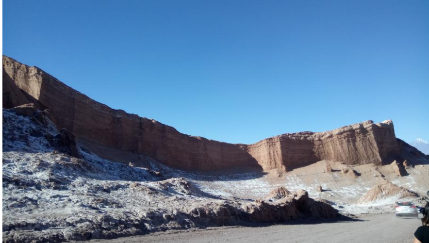
Figura N° 48 Valle de la Luna

grises, rojos y ocre minerales que le dan una apariencia lunar muy llamativa (Servicio Nacional de Turismo, 2012).