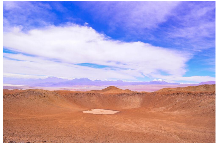
Figura N° 8 Cráter de Monturaqui

Se ubica en la precordillera cerca del borde sur del Salar de Atacama a una altura aproximada de 3.500 msnm. Las dimensiones del cráter son 360 metros en sentido N-S y 380 metros en sentido E-O, medidos en relación con la parte más alta del borde del cráter (Servicio Nacional de Turismo, 2012).