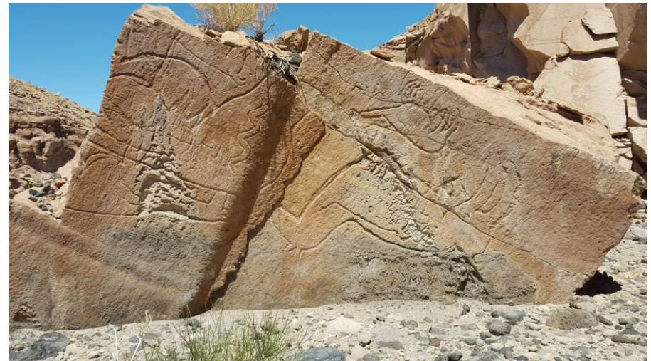
Figura N° 43 Talabre

producción realizan tanto para su propio uso como para la venta que les permite el mercado turístico de la zona. Los productos artesanales son fabricados con lana de oveja y llama y con técnicas ancestrales como el uso de palillos de cactus y el telar atacameño (Servicio Nacional de Turismo, 2012).