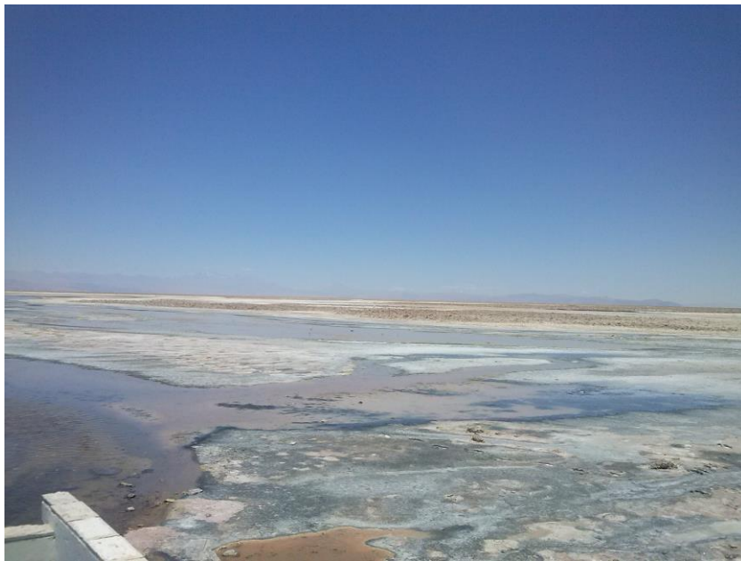
Figura N° 15 Laguna Chaxa

La Laguna de Chaxa posee una increíble formación salina en la superficie, en la cual es posible encontrar una importante población de flamencos rosados, protegidos por la Reserva Nacional Los Flamencos (Servicio Nacional de Turismo, 2012).