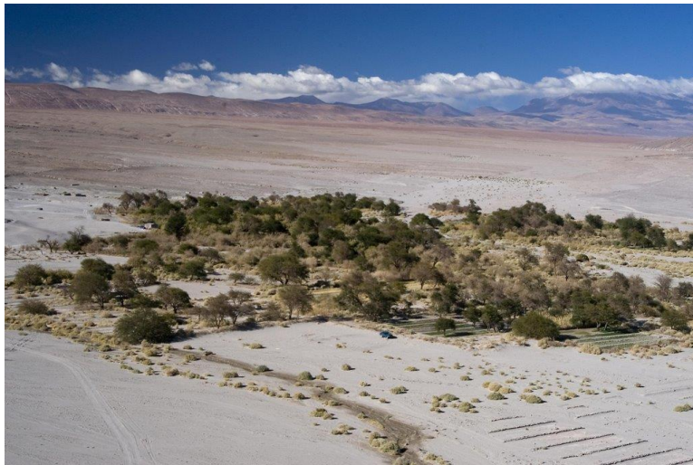
Figura N° 47 Tilomonte

Pequeño oasis ubicado a 2.400 msnm, donde se localiza un antiguo asentamiento. Actualmente solo se utilizan sus tierras de manera temporal para el cultivo. En sus inmediaciones se registran sitios arqueológicos (Servicio Nacional de Turismo, 2012).