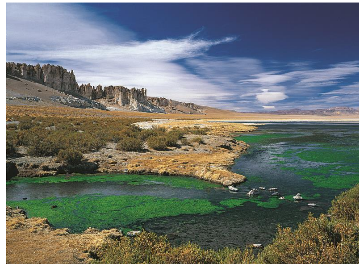
Figura N° 16 Laguna de Tara.

Ubicada en la Reserva Nacional Los Flamencos, la laguna de Tara es el principal recurso para la existencia de la flora y fauna nativas. Con una superficie que abarca 25 km 2 , la laguna se debe al río Zapaleri, el cual tiene su origen en Bolivia. La flora del lugar contempla coirones, tolas de agua y amaja, bofedales y paja amarilla, mientras que la población animal se caracteriza por la existencia de chululos, chorlos de la puna, vicuñas, caitíes, gaviotas andinas, zorros culpeo, gansos guallata, patos jergón y otros (Servicio Nacional de Turismo, 2012).