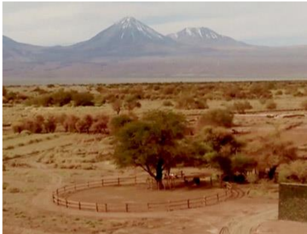
Figura N° 2 Ayllu de Beter