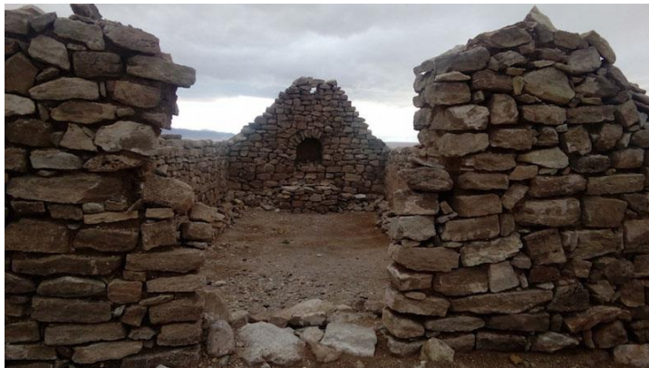
Figura N° 33 Ruinas de la Capilla de Misiones de Peine

conquista española por los primeros misioneros que llegaron a Peine, alrededor de 1580. Esta capilla es parte de la estructura que poseía este antiguo pueblo atacameño, del cual se mantienen algunos vestigios de lo que fuera su construcción hecha a manera de pircas. Los muros aún se mantienen conservando el arco adovelado de la fachada. En el interior, están las piedras que se han desprendido por el paso de los años y bajo ellas, se deja adivinar una mesa de altar de piedra y barro (Servicio Nacional de Turismo, 2012).