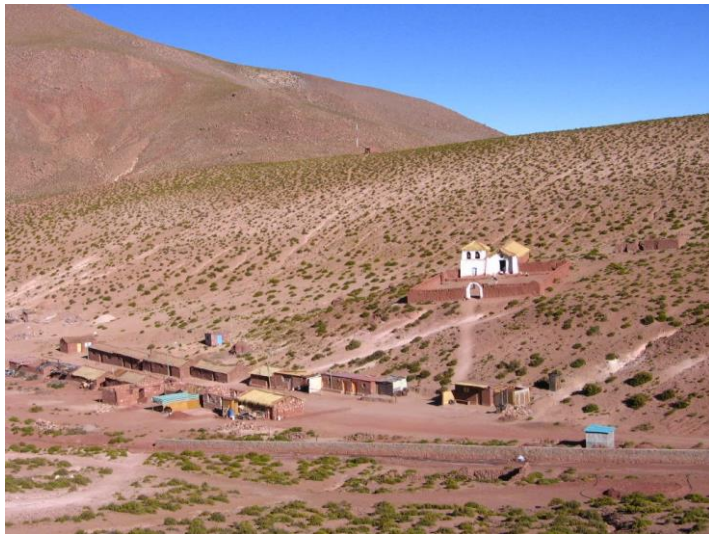
Figura N° 20 Machuca

Pintoresco poblado atacameño ubicado a 3.500 msnm, dedicado al pastoreo, agricultura, producción de quesos y turismo. Cuenta con un criadero de truchas, una la sala de ventas de artesanías y con servicio al paso con degustación de empanadas fritas y anticuchos de llamo. Machuca tiene un pequeño bofedal donde conviven pequeñas comunidades de flamencos, patos y gaviotas (Servicio Nacional de Turismo, 2012).