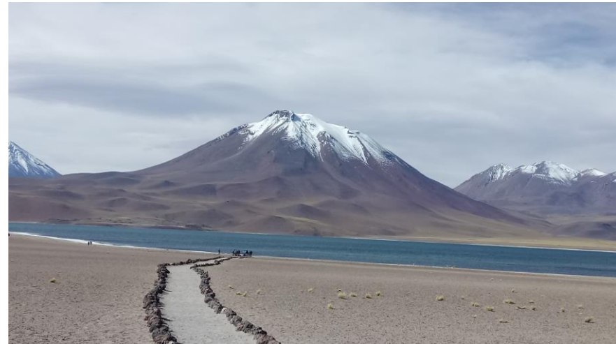
Figura N° 17 Reserva Nacional Los Flamencos, sector Lagunas Miñiques y Miscanti

La Laguna Miscanti, se encuentra a 4.000 metros por sobre el nivel del mar y está inmersa en medio de un mágico escenario natural sitiado por altas cumbres. Además de un maravilloso paisaje, el circuito de las lagunas Miscanti y Miñiques, hace posible la contemplación de una avifauna de flamencos o parinas y de la práctica de varias actividades deportivas (Servicio Nacional de Turismo, 2012).