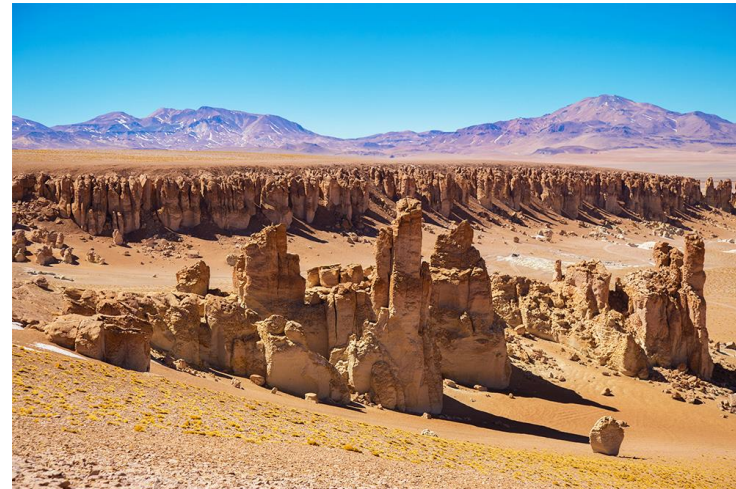
Figura N° 38 Salar de Tara

Ubicado en medio de volcanes en la Reserva Nacional Los Flamencos, el salar de Tara es otro de los múltiples atractivos que posee el lugar, al cual es posible acceder a 4.300 metros de altura. Con lagunas, ríos y vegas, en una superficie de 48 km 2 , el relieve erosionado ofrece un fabuloso espectáculo al coexistir terrenos ondulados y volcanes, junto a población animal y vegetal nativa. De esta manera, es frecuente encontrarse con bofedales, coirones, paja amarilla, tolas amaja y de agua, flamencos, vicuñas, chululos, zorros culpeos, chorlos de la puna, patos jergón y gaviotas andinas (Servicio Nacional de Turismo, 2012).