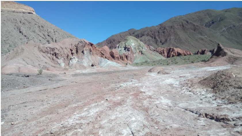
Figura N° 53 Valle del Arcoiris

El valle del Arcoíris se encuentra en la cuenca del río Grande, a aproximadamente 90 kilómetros de San Pedro de Atacama, y cercano a los petroglifos de Yervas Buenas, sector donde cruzaban caravanas de indígenas desde Argentina y el altiplano boliviano con el objetivo de llegar al Pacífico. Su nombre se le otorga debido a la variedad de colores que se puede observar en los cerros del valle; colores tierra, rojos, beige, verdes, blancos y amarillos. Todos combinados con restos de sal blanca y un cielo azul. Los colores de este sector muestran la riqueza ecológica de la arcilla, minerales y sales ( Al San Pedro de Atacama ).