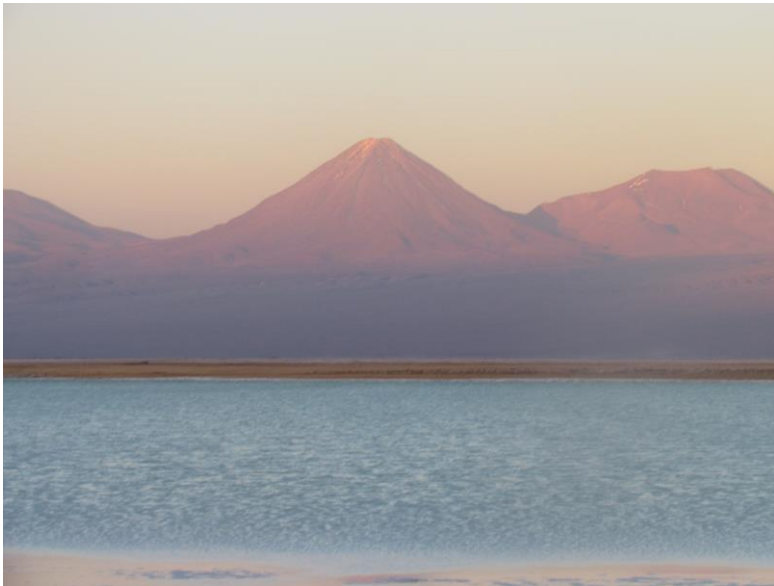
Figura N° 18 Laguna Tebinquiche

Se accede por un camino de arenales, en donde es posible encontrar fauna endémica del salar. Es recomendable ir con guía, debido a la cantidad de caminos que lo cruzan. Una fuerte concentración de sales minerales como el litio y el azufre hacen que el baño en ella sea reconfortable. Es importante llevar agua dulce para después del baño (Servicio Nacional de Turismo, 2012).