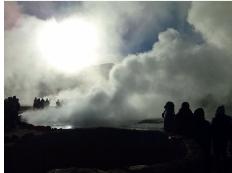
Figura N° 52 Geiser del Tatio

A 90 kilómetros de distancia de San Pedro de Atacama, los Géisers del Tatio son un campo geotérmico de origen volcánico donde el agua y el vapor brotan violentamente desde las profundidades de la tierra. Están a más de 4.000 metros sobre el nivel del mar, por lo que se convierten en los géisers más altos del mundo, ubicados a 4.200 msnm ( GoChile ).