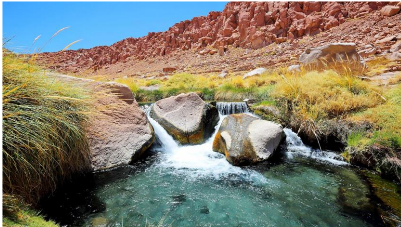
Figura N° 31 Río Puritama

Hacia la aldea de Machuca se pasa por el río Puritama, uno de los pocos de agua dulce de la región atacameña. En él se encuentran patos que intentan nadar por las aguas casi congeladas a pesar de la época del año (Servicio Nacional de Turismo, 2012).