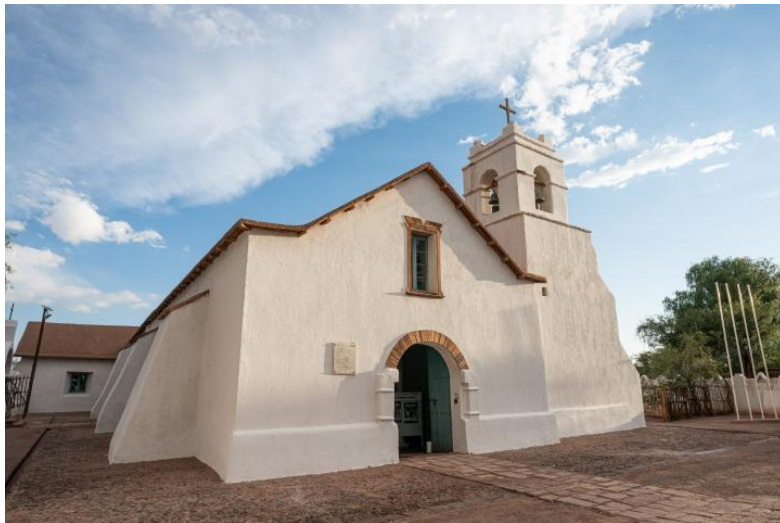
Figura N° 9 Iglesia de San Pedro de Atacama

Declarada Monumento Histórico D.S. 5058 del 06/07/1951. Instalada a un costado de la plaza de la Capital Arqueológica de Chile, la Iglesia de San Pedro de Atacama data de 1745 y es el atractivo arquitectónico más importante del pueblo. La iglesia está construida de piedra y adobe, con techo de madera de chañar y algarrobo, y con una planta de cruz latina que mide 41 metros de largo y 7,5 metros de ancho. Su patrono es San Pedro y es celebrado cada 29 de junio con bailes típicos (Servicio Nacional de Turismo, 2012).