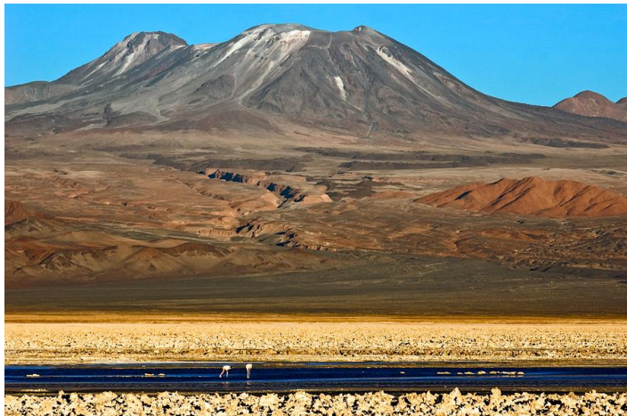
Figura N° 50 Volcán Láscar

Impresiona desde que se reconoce con su permanente fumarola que se divisa desde San Pedro de Atacama. Se trata de un volcán sumamente activo, que hace erupciones de ceniza volcánica prácticamente todos los años. Se encuentra en el altiplano, rodeado de otras impresionantes cumbres andinas de cerros y volcanes. Su vecino, el Corona, lo observa plácidamente, al igual que al frente y con su impresionante murallón el cerro Tumisa. También vecino del Lascar es el cerro Lejía (Servicio Nacional de Turismo, 2012).