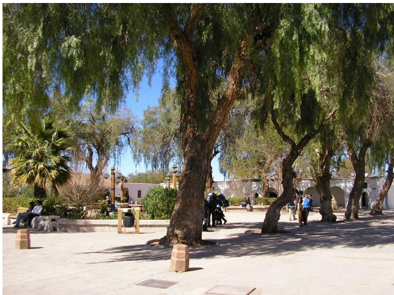
Figura N° 23 Plaza San Pedro de Atacama