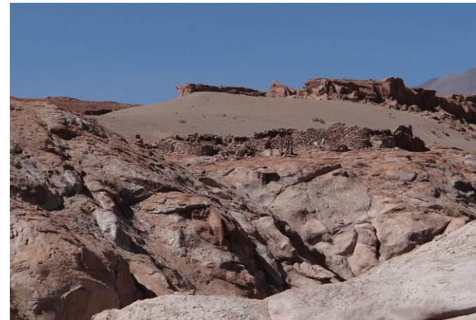
Figura N° 27 Pukará de Zapar

presencia de recintos habitacionales, sugiere que se trataría de una aldea con poca capacidad habitacional constante vinculada al desarrollo de actividades religiosas (Servicio Nacional de Turismo, 2012).