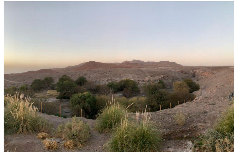
Figura N° 4 Camar

Es un pequeño oasis con 61 habitantes dedicados al pastoreo y al cultivo de maíz. En su iglesia de adobe y techo de cactus, se celebra cada 13 de junio la Fiesta de San Antonio (Servicio Nacional de Turismo, 2012).