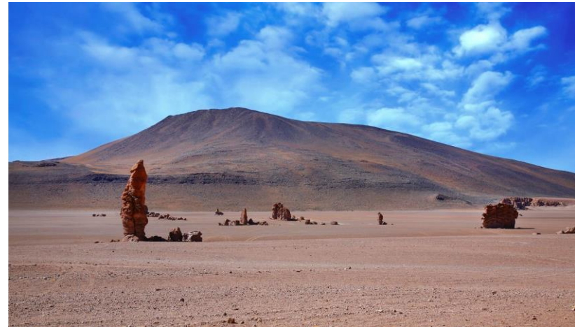
Figura N° 46 Testigo de la Pacama

Conjunto de estructuras rocosas en forma de columnas, que se han conservado hasta el día de hoy y que son testigos de violentas actividades volcánicas ocurridas durante el Terciario. Se ubican en el Salar de Tara (Servicio Nacional de Turismo, 2012).