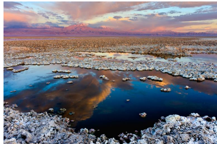
Figura N° 34 Salar de Atacama

quebradas por donde se filtra el agua desde la cordillera. Además, es el quinto salar más grande del mundo tras el salar de Uyuni en Bolivia, salinas Grandes en Argentina, salinas de Etosha en Namibia, y Gran Lago Salado en Estados Unidos. El salar abarca 3.000 km 2 , mide 100 kilómetros de largo y 80 de ancho. Posee el 40% de las reservas mundiales de litio y grandes cantidades de bórax y sales potásicas. Aun así, su fauna ostenta grandes cantidades de flamencos, además de otras aves, como ñandúes, gansos o patos; y algunos mamíferos como llamas, guanacos, vicuñas y alpacas (Servicio Nacional de Turismo, 2012).