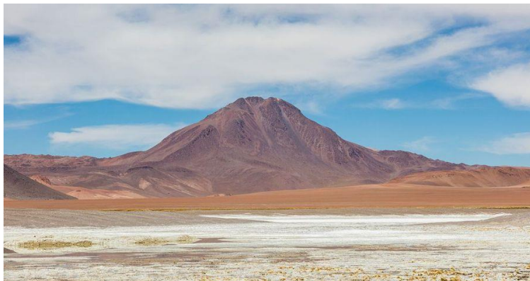
Figura N° 35 Salar de Pujsa

Declarado sitio RAMSAR. Constituye un humedal de alta importancia en el norte de Chile para la conservación de las tres especies de flamencos presentes en la puna: el flamenco chileno, el flamenco andino y el flamenco de James, actualmente clasificadas con problemas de conservación. Destaca por su abundancia y el desarrollo de eventos reproductivos de estas especies. Además, este humedal es sitio de paso (descanso y alimentación) de aves migratorias (que viajan desde el hemisferio norte), tales como el playero de Baird, el pollito de mar tricolor, el playero pectoral, el pitotoy chico y el pitotoy grande, entre otros. Resalta, además, la presencia de numerosos grupos de vicuña austral (Servicio Nacional de Turismo, 2012).