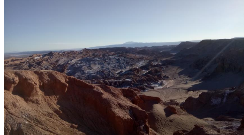
Figura N° 49 Valle de la Muerte

recomendables para practicar trekking y sandboard (Servicio Nacional de Turismo, 2012).