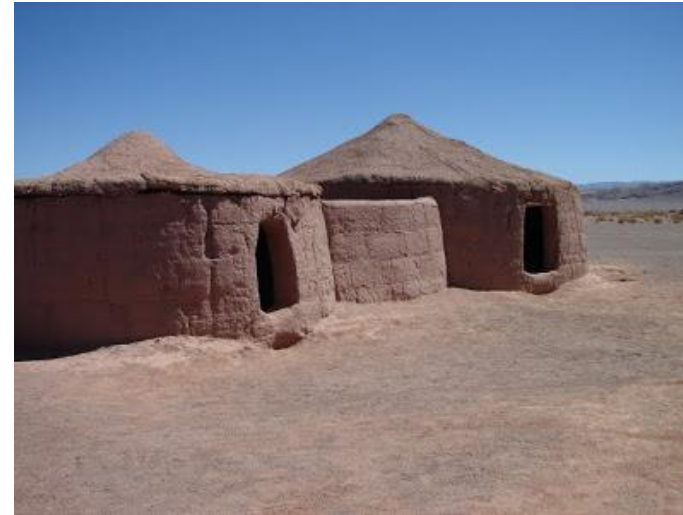
Figura N° 3 Ayllu de Coyo

de habitaciones en los cuales vivían los Lickanantay (Servicio Nacional de Turismo, 2012).