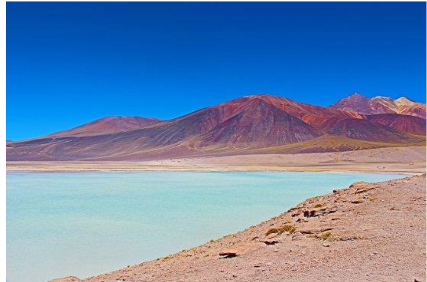
Figura N° 19 Laguna Tuyajto

Muy cerca del paso internacional de Sico, en el noreste chileno, encontramos esta hermosísima laguna de altura. Es muy pequeña (5,6 km 2 ) y la superficie del agua se encuentra a 3.960 msnm. El proceso de evaporación de sus aguas provoca que las sales arrastradas por el viento se adhieran a las laderas de las montañas vecinas (Servicio Nacional de Turismo, 2012).