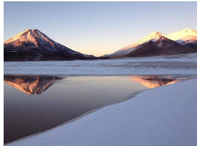
Figura N° 12 Laguna Lejía

Sus principales características morfométricas y climatológicas son: altura: 4.325 msnm, superficie de la cuenca: 193 km 2 , superficie de la laguna 1,9 km 2 , precipitaciones: 150 mm/año, temperatura media: 1°C (Servicio Nacional de Turismo, 2012).