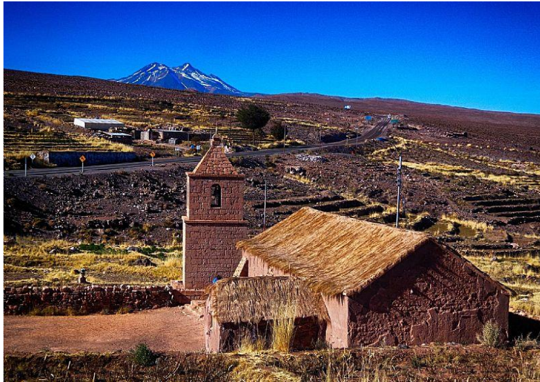
Figura N° 42 Socaire

un albergue para los visitantes que es atendido por miembros de la comunidad (Servicio Nacional de Turismo, 2012).