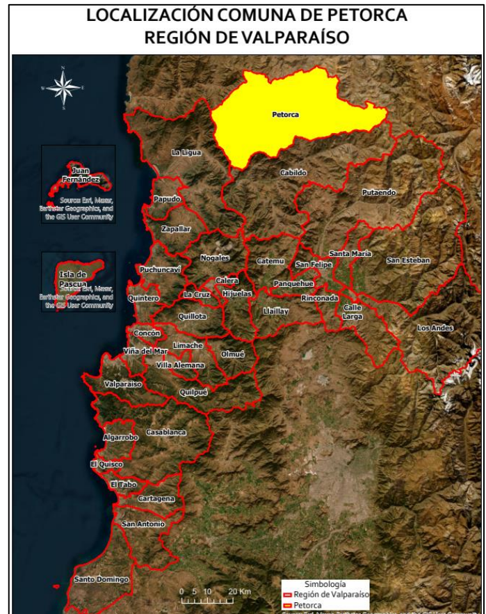
Límite comunal Petorca

La comuna tiene una historia muy ligada al ámbito minero. En un comienzo pertenecía a la jurisdicción del Real Tribunal de Minería hacia el siglo XVIII, lo que provocó que sus límites jurisdiccionales no estuvieran claros y se establecieran más tarde. En el sector de Hierro Viejo fue hallado en 1730 el rico manto aurífero de los Tornos. Después de sabida esta noticia el lugar comenzó a poblarse por trabajadores y sus familias, tahúres y sobre todo aventureros; entonces el deshabitado asiento se incrementa y sin autorización comienzan a ocuparse terrenos eriazos pertenecientes a la hacienda Pedegua de la Comunidad Religiosa Agustina (Subsecretaría de Desarrollo Regional y Administrativo).