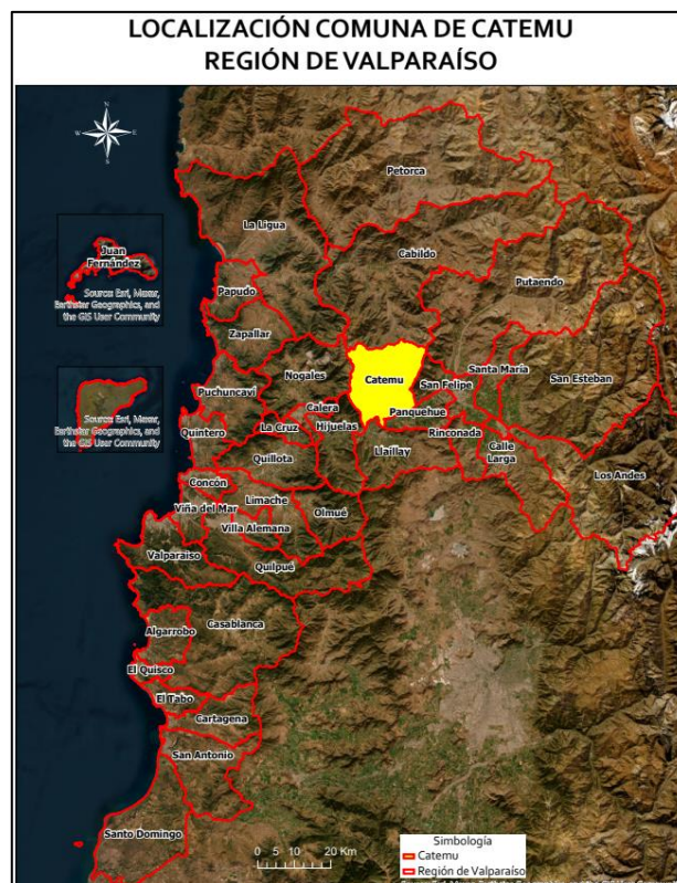
Límite comunal Catemu

La comuna fue fundada el 22 de diciembre de 1891 ( https://lc.cx/ooXttc ).