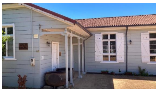
Museo de Rere

Cuenta con 13 salas de exposición permanente, con maquinarias y herramientas agrícolas y de educación, colección de billetes y monedas, utensilios domésticos antiguos, máquinas de oficina, objetos de imaginería religiosa, colecciones de joyas, utensilios y armas de la cultura mapuche, monedas antiguas, indumentaria criolla y fósiles ( https://lc.cx/hQDK-g ).