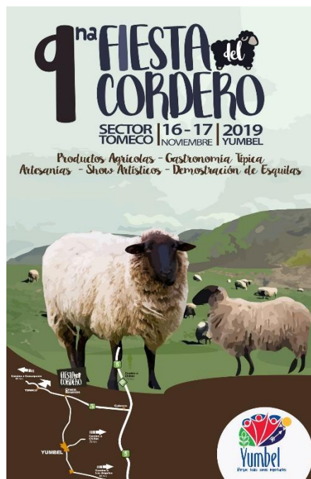
Fiesta del Cordero

Fiesta costumbrista que se celebra en el mes de noviembre en la localidad de Tomeco. Se realizan concursos de esquilado, tejidos, además se elaboran platos derivados del cordero. También se puede degustar otros productos y tragos típicos, todo en un entorno criollo con presentaciones de agrupaciones folclóricas y artísticas (Municipalidad de Yumbel, 2024).