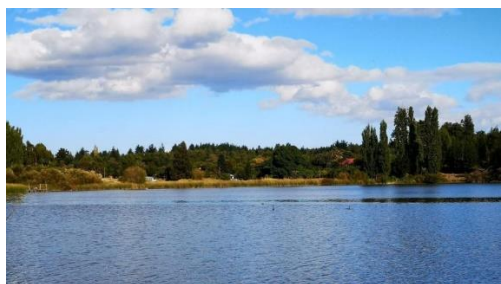
Laguna de Flores

Se ubica a 3 kilómetros de Yumbel Estación. Posee una longitud de un kilómetro aproximadamente. Los visitantes pueden disfrutar de un hermoso paisaje, paseos en botes a remos, ya que no es un lugar apto para deportes náuticos, pero si una buena manera de tomar fotografías, una caminata por las orillas, o disfrutar del canto de las aves ( https://lc.cx/YMFIllo ).