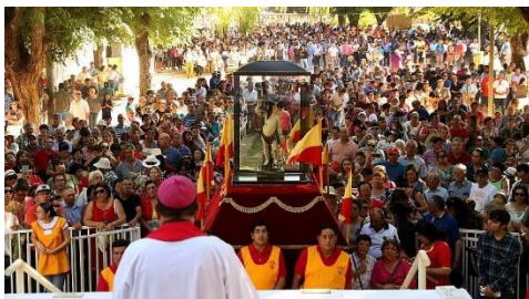
Festividad de San Sebastián

Se conmemora cada 20 de enero y 20 de marzo, época en que se reciben a cientos de peregrinos de las diferentes regiones del país. Durante la festividad la imagen de San Sebastián se traslada desde el templo al Campo de Oración, para recibir con más comodidad a los peregrinos que vienen a realizar sus mandas (Municipalidad de Yumbel, 2024).