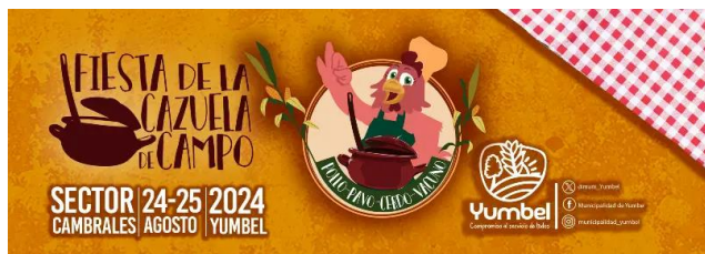
Afiche Fiesta de La Cazuela

Se celebra en el mes de agosto en el sector de Cambrales. En el evento se puede disfrutar de las cazuelas de pavo, vacuno, pollo y cerdo, además de otros platos típicos, en conjunto con la exposición de productos agrícolas y artesanales en un entorno criollo donde se desarrollan juegos tradicionales, carreras de perros y a la chilena, amenizado con agrupaciones folclóricas y espectáculos artísticos (Municipalidad de Yumbel, 2024).