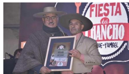
Fiesta del Chancho

Se celebra en el mes de julio en el sector de Misque, donde el visitante tiene la oportunidad de degustar todos los productos derivados del cerdo como chicharrones, asados, cocimiento, costillar, longanizas, prietas, pan con chicharrones, además de otros productos típicos. Al alero de actividades recreativas, tradicionales, circuitos turísticos, todo acompañado de espectáculos artísticos (Municipalidad de Yumbel, 2024).