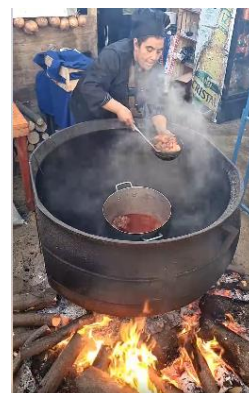
Estofado de San Juan

Se celebra en el mes de junio en la localidad de Rere, donde se disfrutan los platos típicos más tradicionales y criollos de la zona que consiste en pollo, cerdo, longaniza, conejo y vacuno, entre otros. Además, los visitantes podrán degustar de licores, mistela, pajaritos, y otros platos tradicionales. Todo esto amenizado con presentaciones artísticas y folclóricas (Municipalidad de Yumbel, 2024).