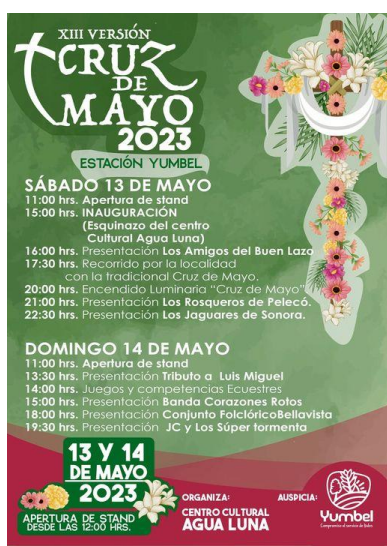
Afiche Festividad Cruz de Mayo

Se celebra cada 2 de mayo en la localidad de Estación Yumbel, en conjunto con la instalación de expositores de platos típicos, artesanos y productos agrícolas todo esto acompañado de espectáculos artísticos (Municipalidad de Yumbel, 2024).