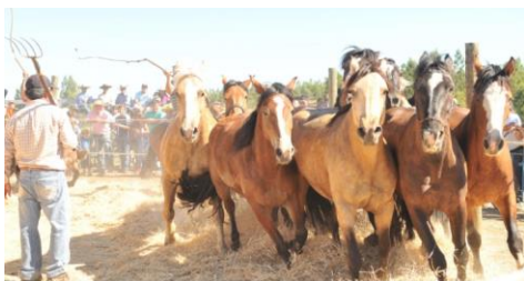
Trilla a Yegua Suelta

Fiesta costumbrista que rescata la antigua tradición del campo y que se celebra en el mes de enero. Evento donde los visitantes y los locatarios tienen la oportunidad de conocer el proceso de la corta, emparva y de la trilla en conjunto con la degustación de platos típicos y tragos típicos, todo esto al alero de agrupaciones folclóricas y espectáculos artísticos (Municipalidad de Yumbel, 2024).