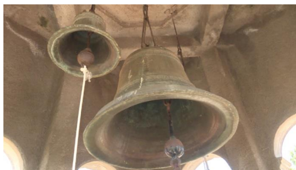
Campanas de Rere

Las campanas de Rere son una leyenda chilena sobre la localidad de Rere. Las campanas provendrían de un antiguo templo del pueblo de Rere, que resultó destruido luego de un fuerte terremoto (la parroquia del lugar se levantó en 1927, pero quedó destruida por el terremoto de 1960, por lo que se reconstruyó cerca de su antigua ubicación). Se dice que estas campanas pudieron hacerse gracias a las donaciones de diferentes personas, quienes entregaron para sus fabricaciones joyas, monedas de oro, plata, cobre, bronce y otros metales. La aleación de todos ellos les dieron un maravilloso tañido, e hizo que las hermosas campanas se escucharan a muchos kilómetros de distancia (Servicio Nacional de Turismo, 2012).