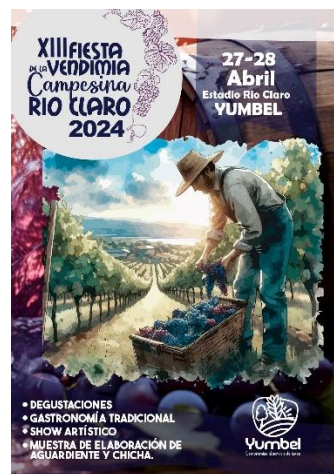
Afiche Fiesta de la Vendimia, 2024

Se celebra en abril en la localidad de Río Claro. El visitante tiene la posibilidad de conocer el proceso de elaboración de la chicha, el vino y el aguardiente, en conjunto con la degustación de platos típicos, todo esto amenizado de espectáculos artísticos. Además se realizan carreras a la chilena, coronación de candidatas, juegos tradicionales, entre otros (Municipalidad de Yumbel, 2024).