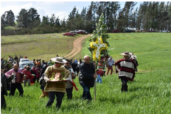
Cruz del Trigo

Se celebra el día 4 de octubre en el Cerro La Virgen con una liturgia, día donde el santoral católico conmemora a San Francisco de Asís. Durante la celebración se realiza una procesión, con el objeto de bendecir el sembrado del trigo y para recibir una cosecha fructífera, todo al alero de presentaciones de grupos folclóricos y con degustaciones de comidas y tragos típicos (Municipalidad de Yumbel, 2024).