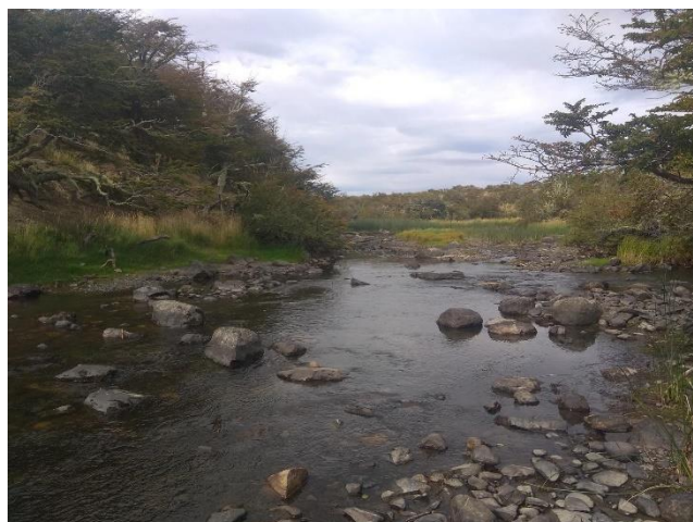
Río Hollemborg.

Es el río que vacía el Lago Balmaceda y se encuentra a 24 kilómetros de Puerto Natales. El acceso es por un camino de ripio en buen estado. Apto para la pesca deportiva de trucha marrón o café y trucha arcoíris. Se puede practicar la observación de distintas especies de aves. Desemboca en el golfo Almirante Montt (Servicio Nacional de Turismo, 2012).