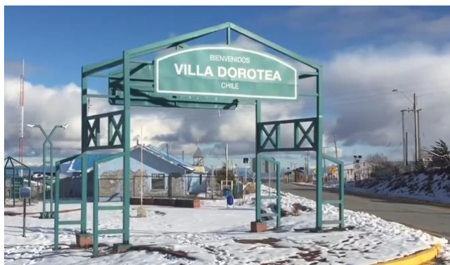
Villa Dorotea.

Caserío fronterizo. Comunica a Argentina con Chile vía terrestre, a través de servicio de transporte público de pasajeros y vehículos particulares, uniendo las localidades de Río Turbio de Argentina con Villa Dorotea y Puerto Natales (Servicio Nacional de Turismo, 2012).