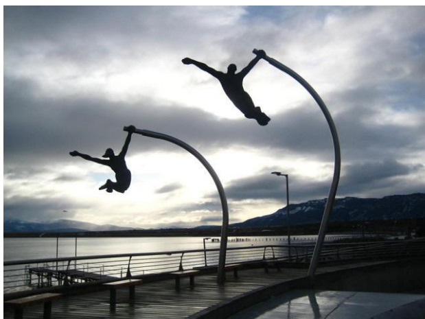
Amores de Viento.

Escultura ubicada en la costanera dentro de la Plaza de Los Vientos. Fue inaugurada el 1 de junio del 2012 y fue dedicada al viento característico de la zona. Se considera un monumento público de acuerdo al Consejo de Monumentos Nacionales.