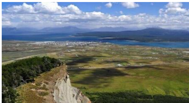
Mirador Sierra Dorotea

Hermoso cordón montañoso que constituye el respaldo paisajístico de origen glaciar de Puerto Natales. Se formó en el cretáceo superior hace 12 millones de años y tiene 600 msnm. Existe un mirador desde el cual se obtiene una panorámica del área (Servicio Nacional de Turismo, 2012).