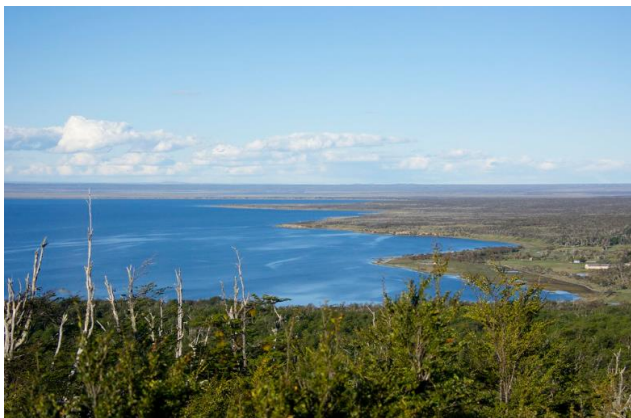
Lago Balmaceda.

Se pueden realizar actividades como hiking, navegación, pesca con mosca, picnic, contemplación de la flora y fauna, fotografía (Servicio Nacional de Turismo, 2012).