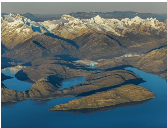
Reserva Nacional Alacalufes.

Alcanza una superficie aproximada de 2.320.000 hectáreas en un paisaje caracterizado por islas montañosas bajas, canales y fiordos. El clima es templado frío y tundra, con altas precipitaciones. Se presentan distintas especies de vegetación como herbazales, matorrales, coigües y turbales. Posee gran cantidad de aves. La única forma de acceso es por vía marítima desde Puerto Natales (Servicio Nacional de Turismo, 2012).