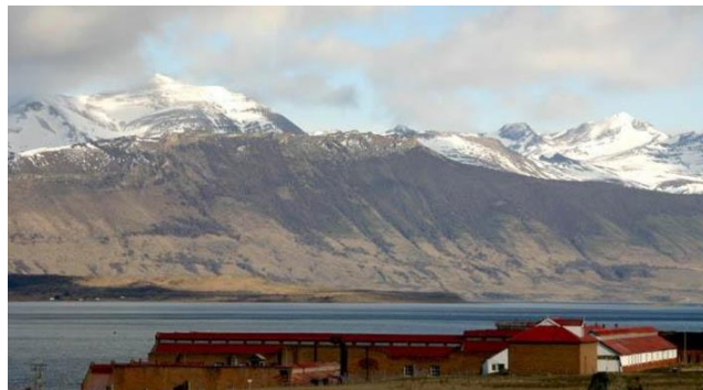
Frigorífico Boires.

Durante el año 2011 sus dependencias, maquinarias y mobiliario fueron restaurados y reutilizados como museo y hotel de lujo llamado The Singular (Consejo de Monumentos Nacionales).