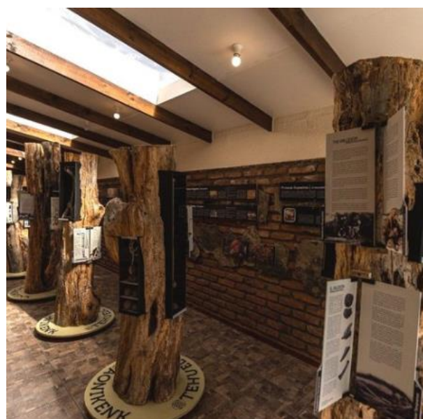
Museo Municipal de Natales.

El museo presenta sus exhibiciones en siete salas temáticas y a través de un guión bilingüe. En sus salas conserva una cantidad importante de objetos originales y réplicas, vinculadas a la vida de dos pueblos originarios que habitaron el territorio de Última Esperanza; los Aónikenk, nómades, habitantes de las pampas y los Kawésqar, navegantes del Pacífico. También, cuenta con una colección referente a la vida pionera y colona, formada por materiales y testimonios de Puerto Natales, desde sus orígenes como pueblo obrero-ganadero en 1911. El 80% de sus colecciones proviene de donaciones de los vecinos de Puerto Natales, el porcentaje restante es adquirido a través de fondos concursables ( https://lc.cx/CMV42R ).