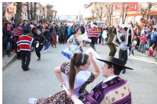
Fiesta de La Chilenidad

La celebración se realiza en el mes de septiembre, donde conviela cocia chilena con actividades típicas que conservan a identidad del lugar. Además se puede disfrutar de diferetes espectáculos artísticos del folclor chileno y popular ( https://lc.cx/q-xLxa ).