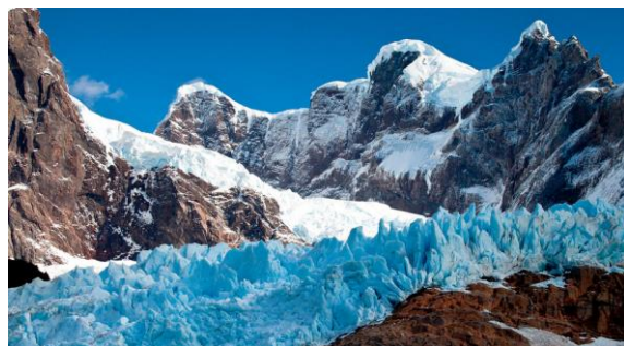
Glaciar Balmaceda y Serano.