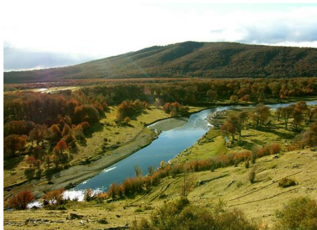
Río Rubens.

Ubicado en el sector Renovales, camino a Puerto Natales. Su curso de agua es ondulante y de fácil vadeo, lo que permite la pesca de truchas marrones (Servicio Nacional de Turismo, 2012).