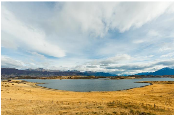
Puerto Prat.