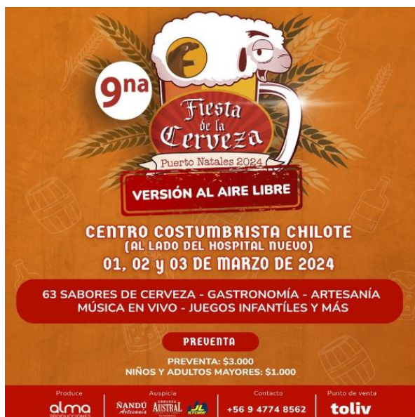
Afiche Fiesta de La Cerveza 2024.

En el evento se exponen diferentes productores de cerveza local y nacional, a lo que se suma la mejor gastronomía de la zona, artesanía local y espectáculos musicales. Además, cuenta con una zona infantil para los más pequeños. Este 2024 se realizó su novena versión ( https://lc.cx/GNNWDs ).