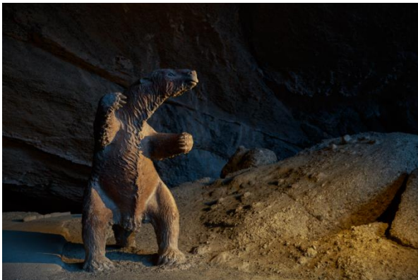
Cueva del Milodón.

Fue declarado Monumento Histórico en el año 1968 mediante el Decreto N°138 ( https://lc.cx/wqoPXM ).