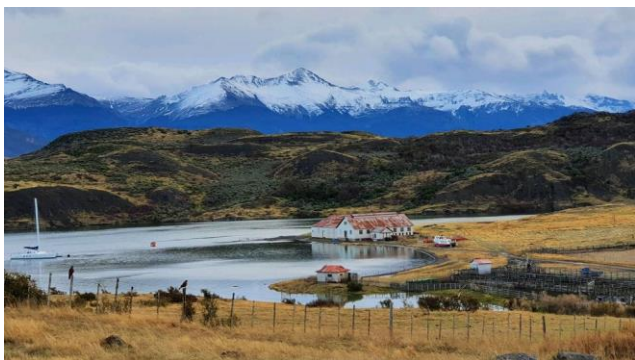
Estancia Puerto Consuelo.