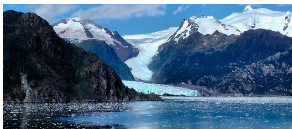
Campo de Hielo Sur.

En su vegetación está presente el bosque perennifolio, dominado por árboles siempre verdes, como: coigüe, canelo, lenga y ñirre. Dentro de la fauna se pueden encontrar: lobos, huemules, coipos, nutrias, cormoranes, patos, águilas, cóndores, gaviotas, entre otros. Especies en peligro de extinción: el huemul (Servicio Nacional de Turismo, 2012).