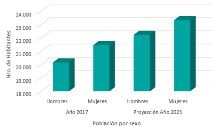
Población por sexo 2017 y proyección 2024, comuna de Parral