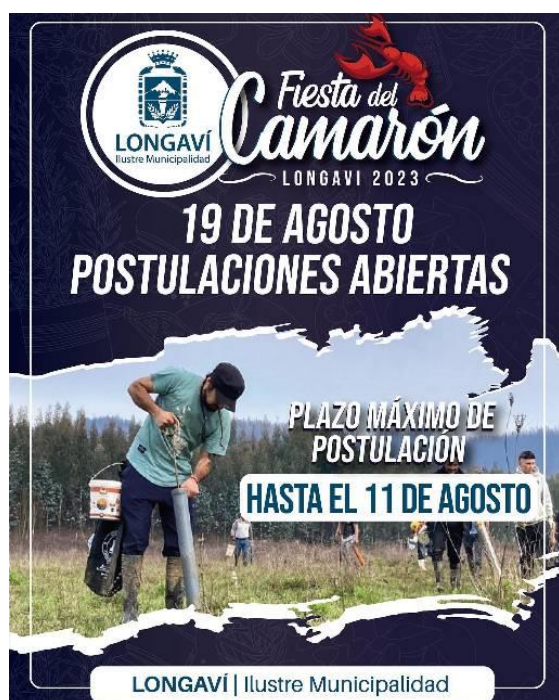
Afiche Fiesta del Camarón

Este camarón ( Parastacus pugnax ), es un habitante regular de terrenos semipantanosos denominados como vegas. Por su gran capacidad excavadora, éste crustáceo hace galerías de hasta dos metros de longitud, donde conviven varios ejemplares a la vez ( https://lc.cx/LMLPyj ).