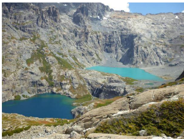
Cajón del Achibueno

El área protegida corresponde al cauce y zona de inundación de cuerpos de agua continentales y glaciares tributarios del río Achibueno y el mismo río (3.327 ha aproximadamente), así como laderas adyacentes y riberas de propiedad privada (1.262 ha aproximadamente), lo que en su conjunto suma una superficie total de 4.589 hectáreas aproximadamente. El Santuario se encuentra ubicado en las comunas de Linares, Longaví y Colbún, Región del Maule, a aproximadamente 20 kilómetros hacia el sureste de la ciudad de Linares. El objeto de conservación de dicho sitio prioritario es el denominado Bosque Maulino, caracterizado por la presencia de asociaciones de especies caducifolias pertenecientes al género Nothofagus con especies predominantes como Roble Maulino y Hualo ( https://lc.cx/7EkYnt ).