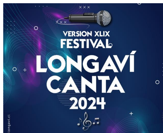
Afiche Festival Longaví Canta

En la actualidad el festival se realiza en febrero y es organizado por la municipalidad, donde se convoca a una competencia a nivel nacional para autores/as, compositores/as y cantautores/ras (Municipalidad de Longaví, 2024).