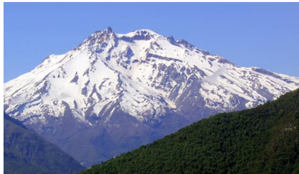
Nevado de Longaví.

Es un volcán relativamente pequeño, de 1800 metros de altura. Su cono, con nieves perennes en su cumbre, glaciares y neveros en todas sus caras, es un hito de gran belleza de la región del Maule. No tiene un cráter abierto, ni existe evidencia de erupciones formadoras de caldera ( https://lc.cx/y4eAu7 ).