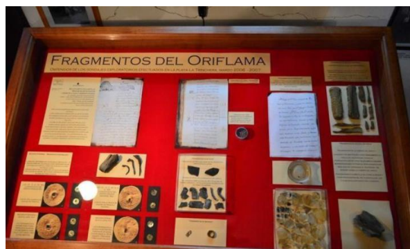
Sala Museo Oriflama

Espacio dedicado exclusivamente a los restos del ex navío “Nuestra señora del Buen Consejo y San Leopoldo”, mas conocido como Oriflama. Fue construido en Francia entre 1742 - 1743 y tras zarpar desde España con destino al Puerto del Callao, fue siniestrado en el año 1770, encallando en la desembocadura del río Huenchullami, en las costas de Curepto. La tempestad esparció sus restos y hoy se encuentra entre 9 y 13 metros bajo la arena de la playa La Trinchera, donde en su interior habría piezas invaluable (Municipalidad de Curepto, 2021).