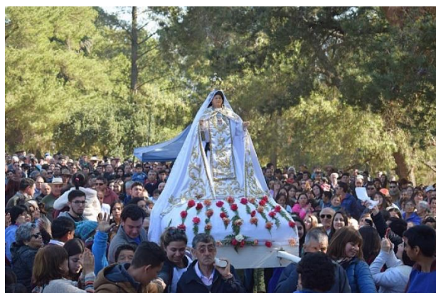
Nuestra señora de La Merced de Limávida

Se inicia con la primera misa, la que está dedicada al mundo juvenil. Luego, se realiza una celebración en el templo. Después la imagen de la virgen es sacada a la explanada y se preside la Eucaristía. Por la tarde, se realiza una procesión y misa final (Servicio Nacional de Turismo, 2012).