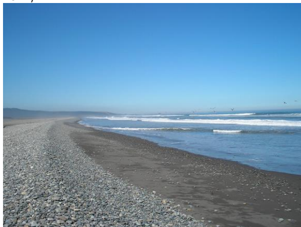
Playa La Trinchera.

Extensa y profunda playa expuesta a constante viento, localizada al extremo norte de las dunas de Putú-Quivolgo. Posee una extensión de 14 kilómetros, lo que permite realizar largas caminatas, acampar y efectuar pesca deportiva en la modalidad de orilla de corvina, lenguado y róbalo (Municipalidad de Curepto, 2021).