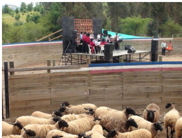
Fiesta de La Esquila

En noviembre se realiza esta fiesta congregando a vecinos y vecinas de la localidad de Rapilermo y sectores aledaños. En esta actividad se demuestra la destreza de los participantes en el proceso de la esquila, a su vez, se realizan actividades y espectáculos para los y las visitantes (Servicio Nacional de Turismo, 2012).