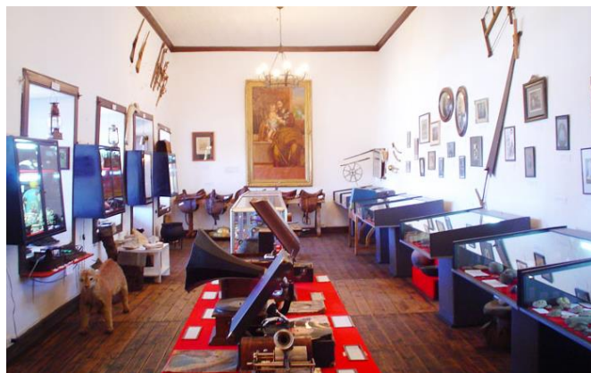
Museo histórico religioso.

En el corredor parroquial frente a la Plaza de Armas, se ubica el museo histórico y religioso de Curepto. En su interior se pueden apreciar gran cantidad de artículos que muestran la vida en otras épocas (Municipalidad de Curepto, 2021).