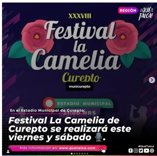
Afiche Festival de La Camelia 2024.

Son dos días de actividad festivalera, que se realizan en el gimnasio municipal de Curepto. Organizado por la Ilustre Municipalidad con el auspicio de diversas empresas y servicios de la zona, se desarrolla el Festival “La Camelia”, flor que por lo demás identifica a la comuna por su desarrollo en el área (Servicio Nacional de Turismo, 2012).