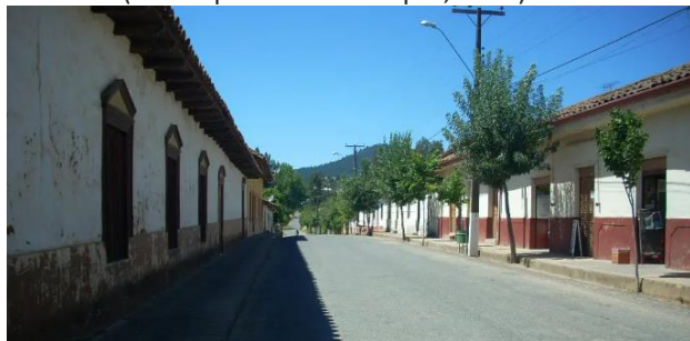
Calles de Gualleco.

Pueblo típico de la zona de estilo colonial. Su nombre viene del mapudungún gualle o hualle, que es como se denomina a una especie de roble y significa agua. En el sector se encuentran unos baños medicinales, los que cuentan con infraestructura básica para tomar baños de barro y aguas a las que se le atribuyen propiedades curativas (Municipalidad de Curepto, 2021).