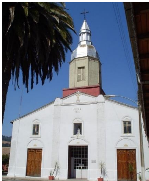
Iglesia Nuestra Señora del Rosario.

Inserta en la Zona Típica de Curepto D.S. N°803 del 21 de diciembre de 1990. En su interior se encuentra la Virgen del Rosario, Patrona de la Iglesia, que fue confeccionada en madera traída de Llongocura en el año 1755. Luego del terremoto del 27 de febrero de 2010, la iglesia sufrió graves daños, provocando el colapso y caída del muro lateral, con graves desprendimientos en los revoques de las fachadas y caída parcial de la estructura de techumbre. Por lo anterior fue declarada inhabitable (Municipalidad de Curepto, 2021).