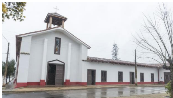
Parroquia Sagrado Corazón de Jesús de Gualleco

Declarada Monumento Histórico D.E. N°2657 del 28 de agosto de 2008. Los jesuitas se encargaron de la construcción de la iglesia y casa parroquial. Fue reconocida oficialmente en 1889 e inaugurada por el entonces arzobispo de Santiago, Mariano Casanova. Sufrió numerosos daños producto del terremoto del 27 de febrero de 2010, con el desplome de sus muros y pilares de la casa parroquial, siendo declarada inhabitable, actualmente se encuentra restaurada y también cuenta con un museo religioso (Municipalidad de Curepto, 2021).