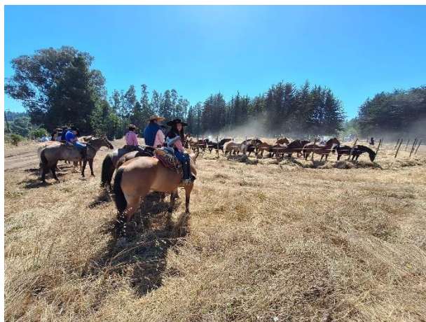
Trilla a Yegua Suelta

Es una antigua tradición campesina que se efectúa en Chile, y que actualmente, la mayoría de las comunas de la provincia, la realiza como tradición durante los meses de verano. Se usan yeguas y caballos que pisotean las gavillas para separar la paja del grano, una de las tantas versiones de un sistema de trabajo realizado por agricultores para cosechar sus trigos. En la Comuna de Chanco se realiza en el mes de febrero reuniendo a un gran número de vecinos y vecinas (Municipalidad de Chanco, 2019).