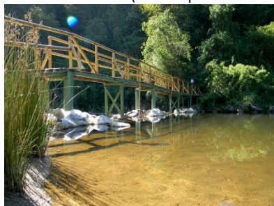
Río Santa Ana.

Se sitúa al límite con Constitución originando un hermoso paisaje fluvial encajonado entre unos cerros de la cordillera de la costa. El río se extiende hasta verter sus aguas en el océano, formando una gran laguna, la que alberga a un sin número de aves que viven en su desembocadura (Municipalidad de Chanco, 2024).