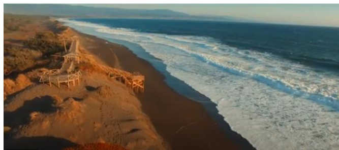
Playa El Monolito

Es el balneario principal de la ciudad, ubicado a 3 kilómetros desde la plaza de armas. Su acceso es un camino de tierra que se extiende por antiguos árboles, bordeando la reserva Federico Albert. Es ideal para realizar caminatas por su cercanía a las dunas, para disfrutar de baños de sol y la práctica de deportes. En su pasarela sobre el imponente cordón de dunas, se tiene una vista panorámica de la zona (Municipalidad de Chanco, 2024).