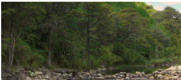
Reserva Nacional Los Ruiles

Su principal sendero de excursión es Los Ruiles, de un kilómetro y medio de extensión y una duración de recorrido a pie de 3 horas. Este sendero abarca parte de la reserva, bajo un bosque centenario de ruiles, hualos y coigües que le dan gran belleza e importancia educativa ( https://lc.cx/utlErx ).