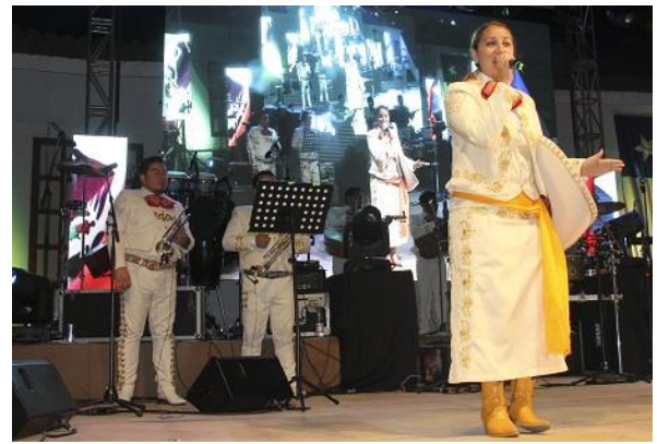
Festival del cantar mexicano Guadalupe del Carmen

Es el principal festival de música mexicana del país, el que surge en 1988 como un homenaje a la cantante chilena de música mexicana Guadalupe del Carmen. Este se realiza en el mes de febrero de cada año para recordar a la cantante homónima, nacida en Quilhuiné en 1931, comuna de Chanco. Constituye la actividad popular más importante de la comuna y es organizada por la municipalidad (Municipalidad de Chanco, 2019).