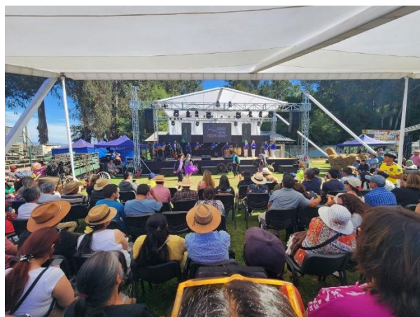
Feria del Queso

Se realiza principalmente en el mes de febrero con el fin de promocionar las actividades y productos del sector rural, la municipalidad convoca a distintos empresarios y microempresarios de la comuna, como también de otras regiones del país para ofrecer sus creaciones al mercado potencial de la zona. El evento cuenta con espectáculos de artistas locales de música folclórica y popular, como lo son grupos de cuecas y tonadas, y los infaltables de la zona, rancheras y corridos. Otro de los actos principales de la feria es la muestra de caballos pura sangre y animales de campo en una mini granja, donde se pueden apreciar ovejas, cerdos, gallinas y otras aves de criadero. Además, se pueden degustar platos típicos de la zona (Municipalidad de Chanco, 2019).