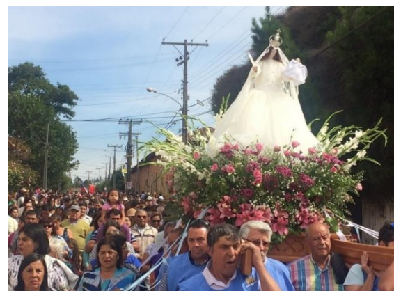
Fiesta de La Candelaria

La imagen que se venera tiene aproximadamente 250 años. Algunas de sus joyas debieron ser lamentablemente vendidas en una subasta pública para reconstruir la iglesia de la Villa, derribada por una salida de mar provocada por el terremoto de 1835. La imagen posee muchos vestidos bordados por las devotas al igual que pelucas hechas de pelo natural. La virgen lleva en su mano una vela (candela) que representa la luz y junto a su Hijo, están coronados (Servicio Nacional de Turismo, 2012).