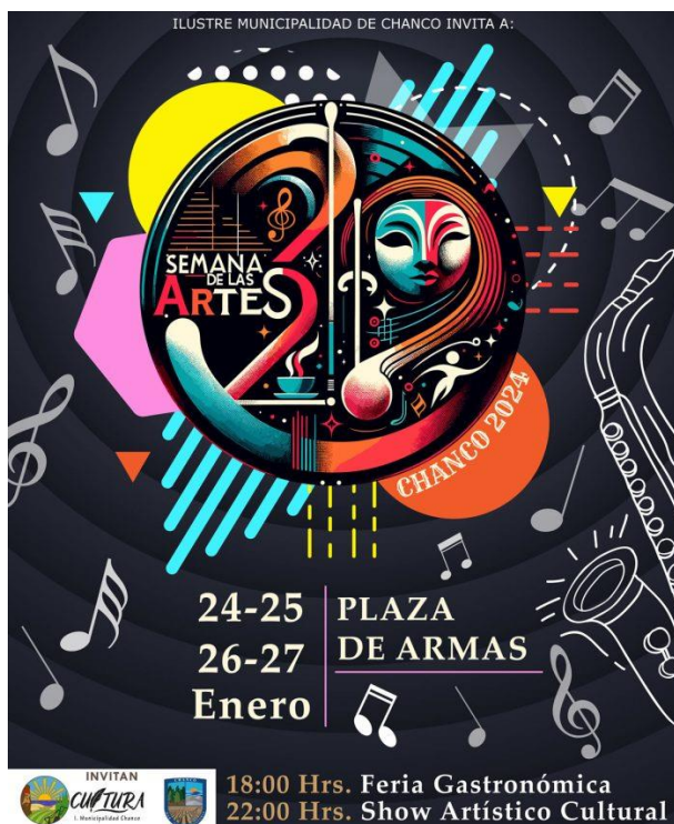
Afiche Semana de Las Artes

Se realiza durante enero en la plaza de armas, donde se desarrollan distintas actividades como: el festival del cantar Mexicano, “Guadalupe del Carmen” permitiendo a los y las asistentes disfrutar del folclore mexicano por medio de intérpretes chanquinos los cuales compiten dentro del certamen, también se presentan diferentes tonadas artísticas (noche lírica y cuerdas, tenores, entre otros). Además, dentro de la semana el humor también tiene su espacio, así como diversas presentaciones artísticas (danzas, teatro, mariachis y ballet). Cabe destacar que en la última fecha celebrada se incluyó la vega de la ciencia que por medio del circo y el teatro enseñan experimentos sencillos con el propósito de difundir y acercar a la comunidad a la ciencia y tecnología (Municipalidad de Chanco, 2019).