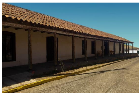
Museo de la Reconstrucción

Es un inmueble de adobe de valor patrimonial cedido en comodato a la municipalidad para que fuera transformado en infraestructura cultural para la comuna. El recinto denominado Corredor Manuel Rodríguez de Chanco fue construido en 1890, el cual no alcanzó a colapsar en el terremoto de 2010, pero sí quedó visiblemente dañado, por lo que la edificación se ha convertido en un ícono de la catástrofe natural. El inmueble data del siglo XIX, posee fachada continua con techumbre de teja de dos aguas, la organización de su estructura arquitectónica es neocolonial, en torno a un patio solariego. A través de este museo, la comuna busca generar conciencia sobre el carácter sísmico del país, así como poner en valor el patrimonio material e inmaterial (Municipalidad de Chanco, 2019).