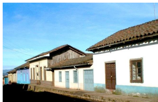
Pueblo de Chanco

Chanco se caracteriza por una trama de calles en damero tradicional, con una arquitectura de casas coloniales de fachadas continuas y corredores de un piso que conforman una fuerte imagen y continuidad urbana. Se destacan en sus fachadas la variedad de ventanas, puertas y postigo de elaborados detalles y proporciones, pilastras dinteles y alfeizares de ejemplar carpintería y un interesante tratamiento para las esquinas y los techos de arcilla rustica y pilares de maderas con asíntotas torneadas en una sola pieza, todo ello de gran valor arquitectónico (Municipalidad de Chanco, 2019).