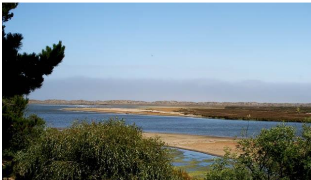
Humedal de Reloca