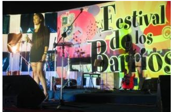
Festival de Los Barrios

La Municipalidad de Cauquenes organiza esta actividad que se realiza en diferentes sectores de la ciudad en el mes de enero. El evento es gratuito y tiene como objetivo de este festival es rescatar y destacar el talento artístico musical de los habitantes de la comuna ( https://lc.cx/sVkak ).