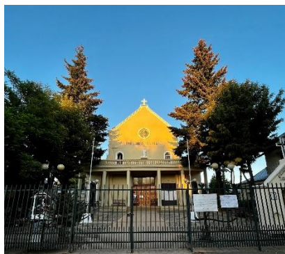
Parroquia San Pedro

Se ubica al frente de la plaza de armas. Es una antigua iglesia, de estilo moderno que ha ayudado al impulso y crecimiento de la ciudad. Destacan tres campanas en la entrada, las cuales fueron encontradas enterradas en un sector cercano a la ciudad (Municipalidad de Cauquenes, 2024).