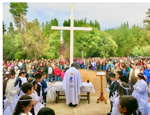
Fiesta de La Virgen de Mayo

La tradicional fiesta religiosa es en homenaje a la Virgen de Mayo. Se realiza hace más de 56 años en Cabrería, localidad rural de Cauquenes, hasta donde llegan cientos de devotos y devotas, quienes con esfuerzo se suelen hacer presentes en el lugar. Va acompañado de una tradicional misa y un almuerzo campesino (Municipalidad de Cauquenes, 2024).