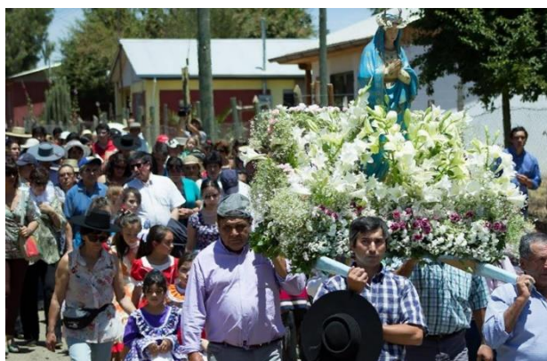
Pueblo de Pocillas celebrando el Día de la Inmaculada Concepción

Una aldea histórica que data de 1730 antes de la formación de la ciudad de Cauquenes, contaba con correos, tiendas y registro civil. Desde 1832 recibe a feligresas para celebrar a la Virgen de la Purísima cada 8 de diciembre. Además, fue pueblo minero que según los antiguos albergó la mina de oro Las Cardas explotada por gringos siendo luego abandonada. También registra información que fue el lugar de materia prima para la loza peneco. Hoy, es zona reconocida por sus mantas, chales y tejido en lana (Municipalidad de Cauquenes, 2024).