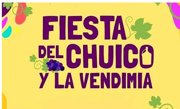
Afiche Fiesta del Chuico y La Vendimia

Este evento busca rescatar la cultura del festival del Río de Cauquenes y es conocido popularmente como el festival del Chuico, el cual se realiza en temporadas de verano. Es una actividad recreativa, cultural y de comercialización de los productos locales como artesanías, vinos. Además, realiza la vendimia como actividad principal y tradicional de la zona vitivinícola ( https://lc.cx/cvRWdG ).