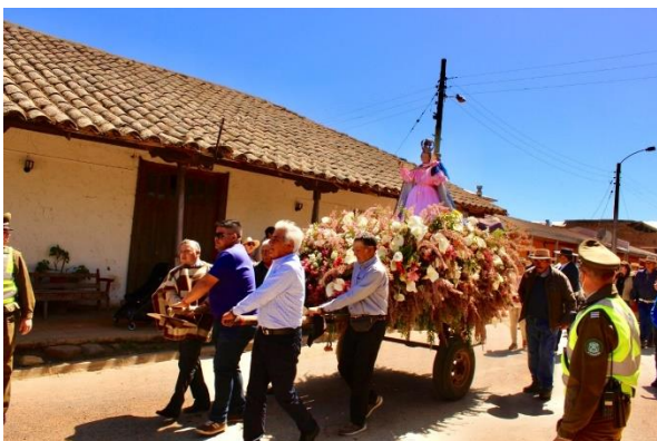
Fiesta de La Virgen del Rosario

Actividad religiosa que data de fines del 1.800. Cuenta con cientos de fieles que llegan a la comunidad rural de Sauzal, transformándose en una verdadera unión de personas alrededor de la fe. La festividad suele hacerse el 08 de septiembre de cada año (Municipalidad de Cauquenes, 2024).