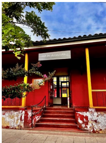
Casa de la Cultura

Edificación de tipo colonial y declarada como inmueble de conservación histórica. Para la comunidad es un lugar reconocido y relevante, debido a su antigüedad de más de 100 años. Esta edificación además alberga una pequeña recopilación patrimonial y cultural de la ciudad (Municipalidad de Cauquenes, 2024).