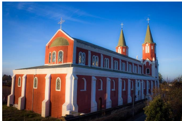
Iglesia San Alfonso

Ubicada en uno de los lugares más altos de la ciudad. Este lugar da testimonio perdurable de la cultura católica. Fue construida en 1892 y destaca por su original arquitectura con sus dos altas torres en punta de estilo románico mezclado con gótico. Los visitantes podrán conocer el templo, destacando además sus viñedos patrimoniales (Municipalidad de Cauquenes, 2024).