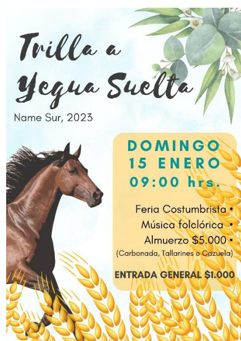
Afiche Fiesta Costumbrista Trilla a Yegua Suelta

En el sector de Name Sur en el mes de enero de cada año se realiza esta actividad que revive esta ancestral tradición campesina. En el evento se puede disfrutar de música folclórica en vivo, artistas invitados, feria costumbrista, y ricos almuerzos campestres ( https://lc.cx/5s5zMn ).