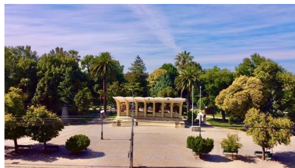
Plaza de Armas

Es el punto de encuentro de la ciudadanía, quienes aprovechan el espacio rodeado de árboles y hermosas áreas verdes. A media cuadra de la plaza, en la calle Victoria, se encuentra una amplia oferta de artesanía tradicional elaborada con materiales locales como cestería, crin, madera, totora y otros, así como locales de comida preparada con pescados, mariscos frescos y productos de la zona (Servicio Nacional de Turismo, 2012).