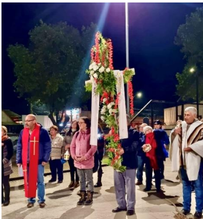
Fiesta de La Cruz de Mayo

Evento que se realiza los primeros días de mayo en el sector de plaza Pratt de Cauquenes. El origen de la Cruz de Mayo se remonta a la conquista española. Como los misioneros desconocían la lengua de los nativos, carecían de imágenes y no tenían suficientes predicadores, hicieron uso de la cruz y elementos locales para difundir el mensaje cristiano (Municipalidad de Cauquenes, 2024).