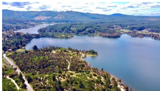
Museo y tranque Tutuvén

Este embalse se asemeja a un espejo de agua, rodeado por arboleda local, ubicado a 9 kilómetros al oeste de la ciudad en dirección a la costa. Es una excelente alternativa para realizar pesca deportiva, pasar un día de picnic o acampar en familia (Municipalidad de Cauquenes, 2024).