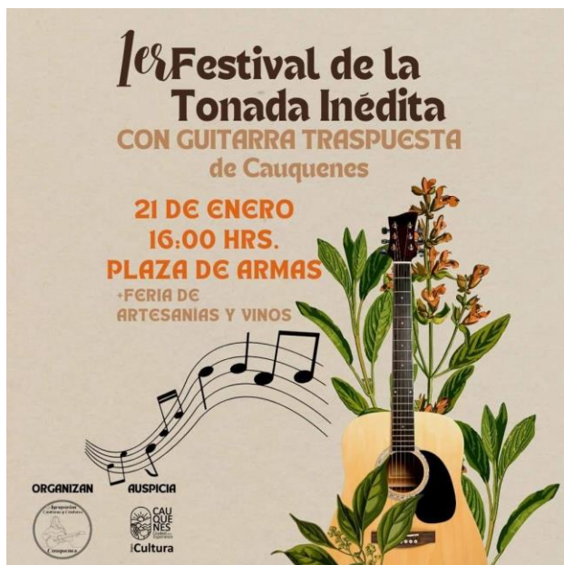
Afiche Festival de la Tonada Inédita

El evento se realiza en el mes de enero de cada año y tiene como objetivo realzar las raíces locales donde participan exponentes regionales y locales de la tonada campesina. Además, los y las visitantes, disfrutan de la feria de artesanías y vinos que acompañan la actividad ( https://lc.cx/JNDFxx ).