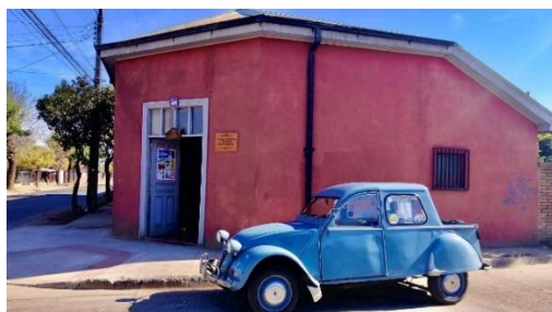
Museo Histórico y Cultural