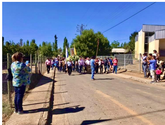
Fiesta de la Purísima

Esta celebración se remonta al año 1832, en el poblado de Pocillas, en el cual se encontraban minas de oro llamadas Las Cardas, las que posteriormente fueron abandonadas. Esta festividad se realiza en honor a la Virgen de la Purísima, la que convoca a miles de peregrinos y peregrinas un 08 de diciembre de cada año (Municipalidad de Cauquenes, 2024).