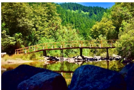
Reserva Nacional Los Riles

Se ubica a 29 kilómetros de Cauquenes. Destaca por la protección de flora y fauna, en específico del árbol en peligro de extinción, conocido como "Ruil", el cual crece de forma natural en pequeñas zonas costeras. También protege otras especies como el pato correntino, lechuza blanca, tucúquere, queltehue y la loica. Cabe señalar que aparte del Ruil, también hay otras especies arbóreas como coigüe, hualo, canelo, pítao, avellano, además de copihues. La reserva posee senderos para trekking y zona de picnic (Municipalidad de Cauquenes, 2024).