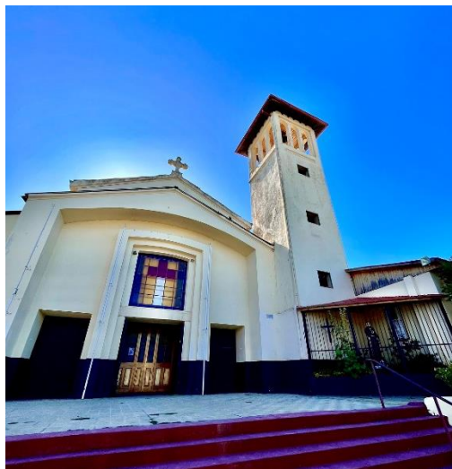
Iglesia San Francisco de Asís

Característica de la zona, esta congregación fue impulsada por los conocidos franciscanos. Un recinto que aún reúne a fieles desde hace 200 años. Es de estilo románico y se destaca la presencia de la Uva Franciscana (Municipalidad de Cauquenes, 2024).