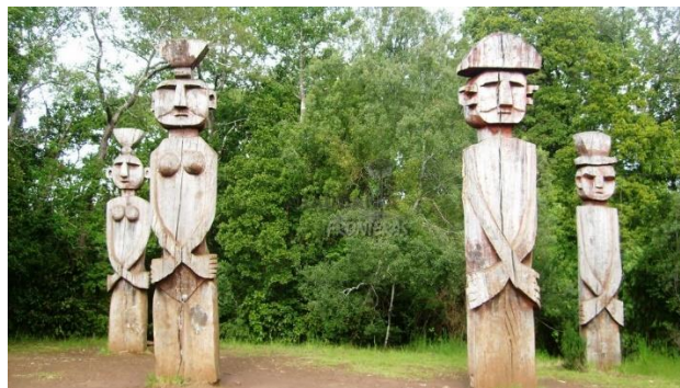
Monumento Natural Contulmo.

Ubicado a 6 kilómetros de Contulmo. Alberga 146 especies vegetales de las cuales 120 son nativas. En cuanto a la fauna, es refugio de 51 especies entre ellos zorros, pumas, monitos del monte, pudúes, chucaos, hued hued y chol-chif. Dentro de sus dependencias es posible encontrar senderos para caminatas y paseos, que permiten observar la flora y fauna del lugar, contanto al mismo tiempo con áreas de picnic habilitados (Municipalidad de Contulmo, 2023).