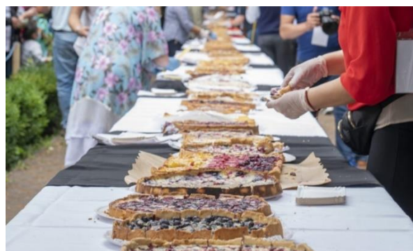
Fiesta del Küchen.

Impulsada por la Ilustre Municipalidad de Contulmo. En las últimas semanas de enero, se lleva a cabo esta celebración con las mejores y distintas preparaciones del clásico bizchoco, con crema y fruta; acompañado por música, ballet folclórico, stand de comida y talleres de repostería (Televisión Universidad de Concepción, 2023).