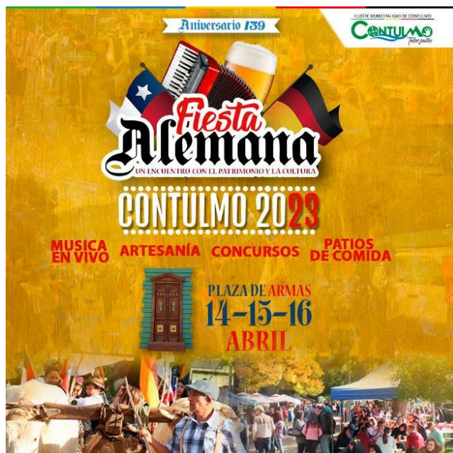
Fiesta Alemana de Contulmo.

También conocida como Fest der Kolonisten. Se lleva a cabo en abril y conmemora la llegada de los primeros colonos alemanes a Contulmo, con presentaciones de gastronomía típica, concursos, desfile de carretas. Además se puede disfrutar de espectáculos artísticos y música folclórica (Identidad y Futuro, 2023).