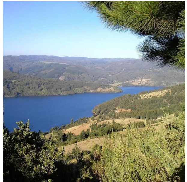
Lago Lleu Lleu.

Sus cristalinas aguas conforman la última reserva natural de la región y por ello su conservación es de tal importancia que los entes de turismo nacionales junto a la comunidad mapuche local regulan las actividades en la zona para reducir el impacto ambiental. Por sus características ambientales, el Lleu Lleu es un buen lugar para practicar pesca deportiva, ya que posee una gran variedad de salmones, truchas y pejerreyes. Los días de verano también se prestan para navegar por los cuatro brazos que se internan en el agreste paisaje y realizar canotaje, windsurf o natación, entre otras actividades. A su vez, las caminatas interpretativas y los paseos en carreta permiten contemplar mejor el encanto del Lleu Lleu (Municipalidad de Contulmo, 2023).