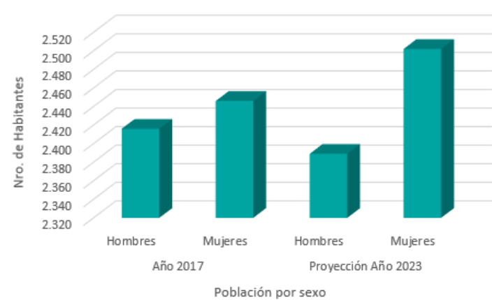
Población por sexo 2017 y proyección 2023, comuna de Portezuelo