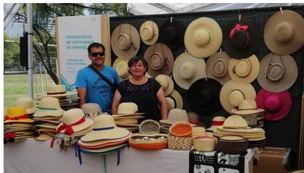
Fiesta de la Chupalla

En la comuna se fabrica artesanalmente, con inigualable maestría y arte, un producto típico: la famosa chupalla de Ninhue. Considerada una de las mejores del país, da tradicionalmente nombre y vida a esta fiesta costumbrista. Los asistentes podrán conocer el proceso de elaboración de la chupalla, admirar y adquirir ese y otros productos locales en los diversos puestos de artesanía, recorrer la Feria Agroproductiva, carreras de perros galgos, disfrutar de la deliciosa gastronomía típica y entretenerse asistiendo a competencias criollas y espectáculos folclóricos ( https://bit.ly/43B6fPr ).