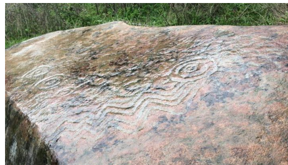
Petroglifos de Ninhue

Se encuentran en una gran piedra ubicada en el sector rural de Panguilemu. Los dibujos sobre ella tienen formas circulares concéntricas y figuras angulosas que han sido erosionadas por el paso natural del tiempo, además de líquenes y musgos ( https://bit.ly/46ccjPZ ).