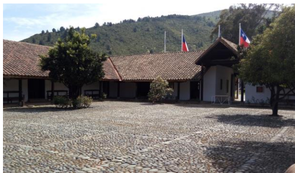
Casa cuna de Arturo Prat

Está ubicada a 2 kilómetros al oeste del pueblo de Ninhue y fue construida en 1780. En esta hacienda nació Arturo Prat en 1848, donde vivió su primer año de vida hasta mudarse a Santiago junto a su familia. Con el objetivo de recuperar el valor histórico de la hacienda, el 3 de abril de 1979 fue inaugurado el Santuario Cuna de Prat. Luego del terremoto de 2010, el museo debió cerrar por los daños sufridos, reabriendo para el público en 2014 luego de un proceso de reconstrucción. La Casa cuna de Arturo Prat y terrenos adyacentes fueron declarados monumento nacional en 1968 en la categoría monumento histórico (Municipalidad de Ninhue, 2022).