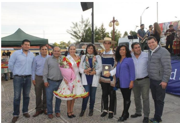
Fiesta de la Vendimia

Entre los platos de gastronomía típica que se pueden degustar se encuentran: asados, anticuchos, sopaipillas y pebre, empanadas fritas y de horno, tortillas y pan amansado, repostería y postres típicos, entre otros ( https://bit.ly/43MMtRg ).