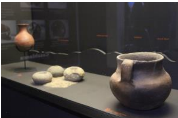
Museo Arqueológico y Antropológico, Casablanca

Se puede disfrutar en el recorrido del Archivo de la Paya y del Archivo Fotográfico de Casablanca y sus localidades. Además de las colecciones: Arqueología General, Quintay, Histórica, Paleontológica, Ciencias Naturales y Geología (Fundación Quintay, 2020).