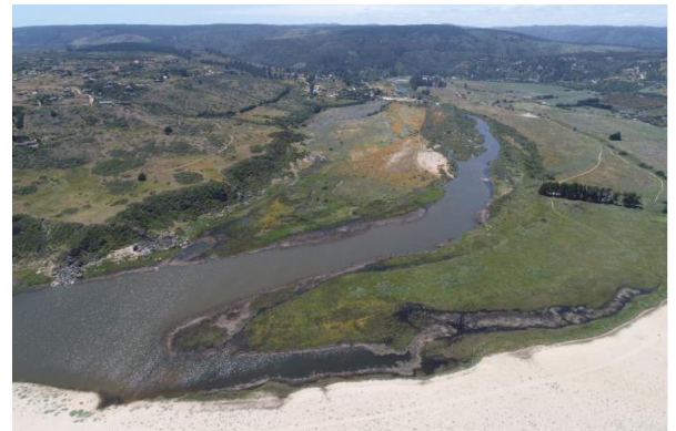
Humedal de Tunquén

La presencia de aves migratorias en el lugar entre primavera y verano es evidencia que este humedal es una ruta de aves provenientes del hemisferio norte y que visitan las costas de Chile para pasar el invierno boreal (Consejo de Monumentos Nacionales, 2023).