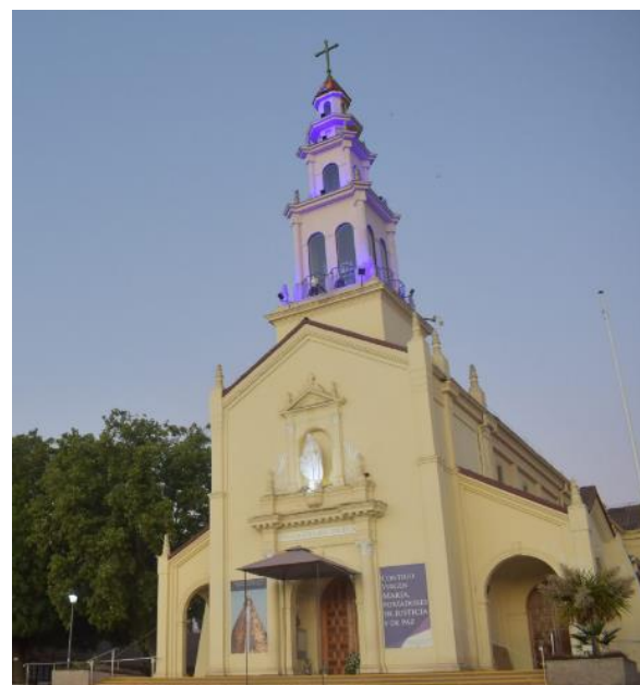
Santuario de Lo Vásquez

En la actualidad, las cifras de feligreses que se congregan el día de la Purísima en Lo Vásquez superan las 800.000 personas, llegando a ser la peregrinación mariana más importante del país, con la participación de muchas instituciones ( https://bit.ly/4274okk ).