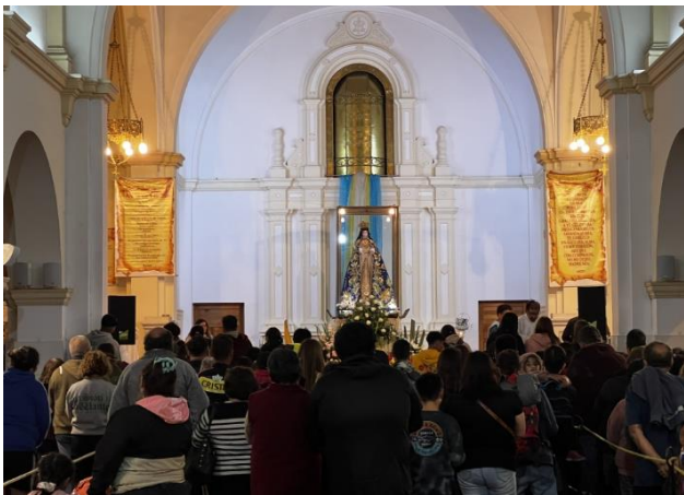
Fiesta Purísima de Lo Vásquez

Cada 8 de diciembre, miles de peregrinos se reúnen para celebrar la Fiesta de la Inmaculada Concepción y se acercan al Santuario de Lo Vásquez a pagar sus mandas y expresar su amor y gratitud a la Virgen María, cumpliendo así con el trato que personalmente tienen con Nuestra Señora Purísima de Lo Vásquez que tantas veces los ha escuchado y logrado interceder por su petición y les ha concedido el milagro que con tanta fe han pedido a ella ( https://bit.ly/4ON4Ra7 ).