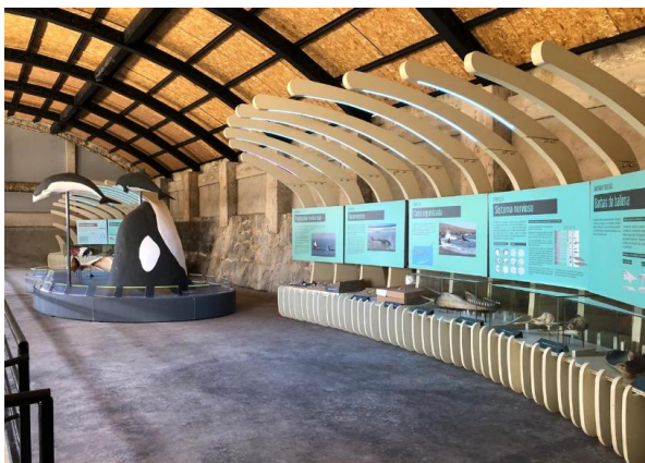
Museo Ballenera Quintay

En sus instalaciones está edificado el museo, que cuenta con espacios permanentes de exhibición: una sala audiovisual y otra de exposiciones temporales (Fundación Quintay, 2020).