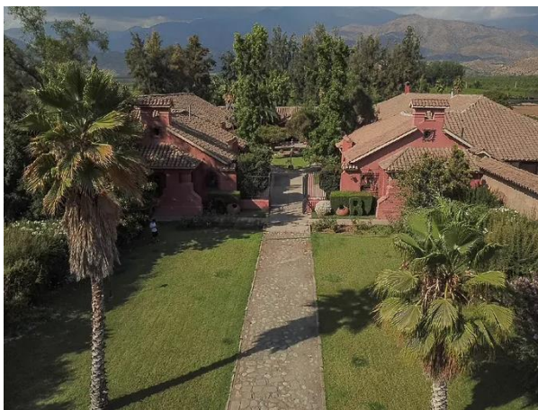
Casa San Regis

La construcción tiene una superficie de 3 mil metros cuadrados, mientras que la propiedad contempla 38 hectáreas. Se puede disfrutar de una bella piscina inserta en un acogedor y amplio jardín, rodeado de parrones y cordillera. El visitante puede recorrer las plantaciones de uva y participar en las labores agrícolas (Servicio Nacional de Turismo, 2012).