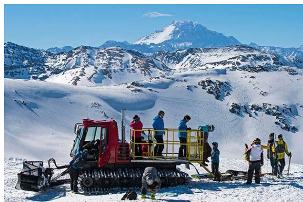
Centro de Ski El Arpa

Cuenta con un refugio donde funciona la cafetería y el arriendo de equipo. Una máquina pisanieves es la encargada de trasladar a los esquiadores hasta la amplia cima del Valle Alto, a 3.740 metros de altitud, puesto que no hay andarivel. Sus pistas son de dificultad intermedia y alta (Servicio Nacional de Turismo, 2012).