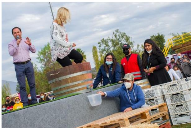
Gala del Vino San Esteban

Cabe resaltar que el “terroir” de la zona vitivinícola de Aconcagua ha permitido la producción de vinos de alta calidad premiados en Chile y el mundo. Lo anterior debido a las características de la tierra y del clima específico un valle regado por el río Aconcagua y donde las grandes variaciones de temperaturas entre el día y la noche favorecen una maduración única de la uva ( https://bit.ly/3YCkeBG ).