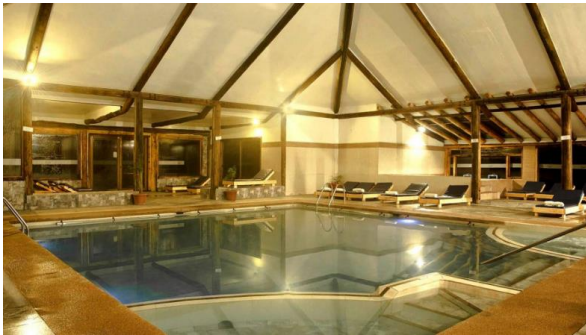
San Francisco Lodge & Spa

Los visitantes pueden disfrutar de distintas actividades como cabalgatas, canopy, kayak, stand up Paddle, pesca con mosca en lagunas, cosecha de vegetales, visitas a la granja, excursiones, clases de cocina y fogatas. Además, cuenta con piscinas de exterior y temperada con aguas minerales que se suman a los servicios del Spa (Servicio Nacional de Turismo, 2012).