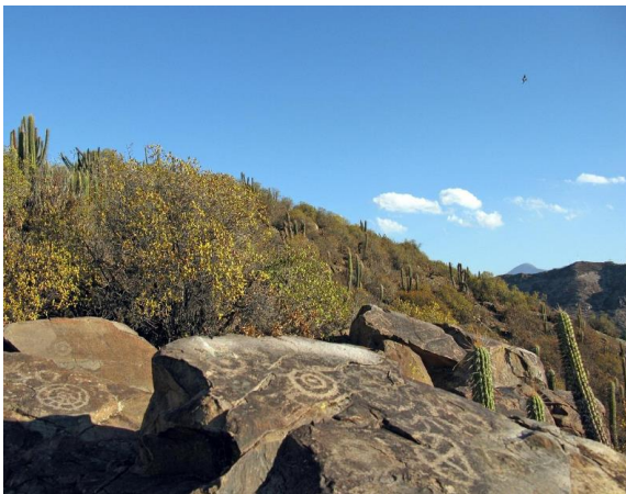
Parque arqueológico Paidahuén

Su valor radica en que en el sitio se pueden apreciar más de 500 petroglifos, dibujos grabados en roca que se adjudican a los pobladores prehispánicos de la Cultura de paidahuén Aconcagua. Los grabados más antiguos tienen más de mil años ( http://bit.ly/3xjdU6s ).