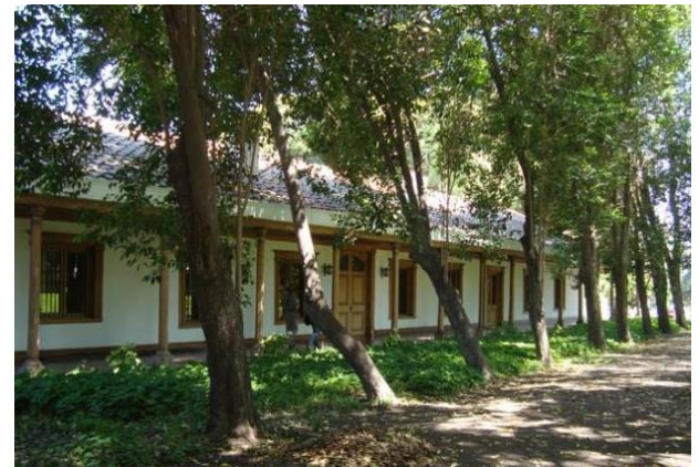
Sector antiguo ex Hacienda Vicente Ferrer

Dentro de las instalaciones destacan silos, galpones, bodegas y unos antiguos hornos tabaqueros, señalando la importancia de la zona de Los Andes en la producción de tabaco (Consejo de Monumentos Nacionales, 2023).