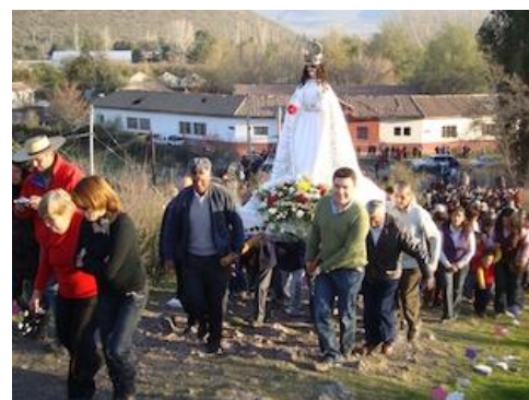
Fiesta religiosa de las Nieves de Pocuro

El primer domingo más cercano al 5 de agosto, se realiza en la iglesia Nuestra señora de Las Nieves de Pocuro esta tradicional fiesta religiosa, donde se realiza una procesión por todo Pocuro hasta llegar a la cima del cerro El Patagual. Fieles, y miembros de cofradías de bailes chinos, acompañan la imagen de la Virgen durante todo el recorrido (Municipalidad de Calle Larga, 2017).