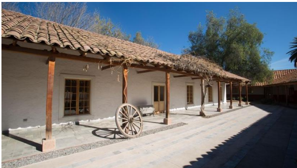
Casa expresidente Pedro Aguirre Cerda

Declarada Monumento Histórico en 1972. La casa se encuentra ubicada en el sector de Pocuro. Se trata de una casa de carácter rural, austera, pero de calidad, levantada en adobe, con un doble corredor exterior, que posiblemente data de mediados del siglo XIX. En ella vivió el expresidente durante su infancia y hasta los 18 años, entre 1879 y 1897, cuando partió a Santiago para convertirse en profesor de castellano. Se encuentra rodeada por otra construcción, también de carácter rural y edificada en adobe, en la que el expresidente fundó la Escuela Granja Agrícola F-511, en el año 1938, al comienzo de su mandato (Consejo de Monumentos Nacionales, 2023).