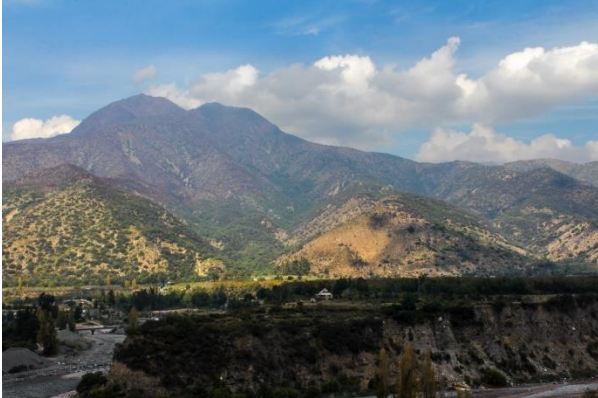
Cerro Purgatorio.

La forma del cerro Purgatorio es característica y se distingue claramente sobre la ribera sur del río Maipo a la altura de las localidades de Las Vertientes, El Canelo y El Manzano, sobre los llanos de San Juan de Pirque. Su altura es de 2.458 msnm (Servicio Nacional de Turismo, 2012).