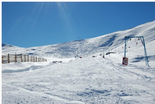
Centro de esquí Lagunillas. Fuente: https://n9.cl/hmpzm

Emplazado a 2200 metros de altura, el centro cuenta con 200 hectáreas destinadas a la práctica de esquí con 13 pistas para novatos, para esquiadores de nivel medio y para expertos, además de cuatro andariveles de arrastre. Lagunillas es administrada por el Club Andino y permite la práctica del deporte sobre nieve durante la noche. (Servicio Nacional de Turismo, 2012).