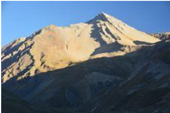
Cerro Puntiagudo.

Con una altitud de 4.126 msnm es un cerro bastante seco y con poca vegetación. Destaca por la presencia de fósiles marinos en sus laderas. (Servicio Nacional de Turismo, 2012).