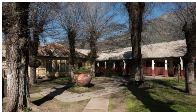
Ex Sanatorio Laennec.

El edificio del ex Sanatorio Laennec está formado por un conjunto de dos edificios, construidos en distintas épocas, con sistemas constructivos y características diferentes que en su totalidad abarcan 5.200 m 2 . El edificio original era de adobe y fue construido en 1896. Albergó entonces al Hotel Francia, cuyos propietarios encontraron en el Cajón del Maipo un clima similar al de Los Alpes, lo que aprovecharon fomentando el turismo y las terapias para tratar enfermedades respiratorias. Los beneficios del clima para el tratamiento de la tuberculosis, enfermedad que en esa época afectaba a un número importante de la población, hizo que los turistas se quedaran por largas temporadas transformando el Hotel paulatinamente en un sanatorio. En 1920 este edificio fue traspasado a la Caja de Seguro Obrero transformándose en sanatorio para pacientes tuberculosos (Consejo de Monumentos Nacionales de Chile).