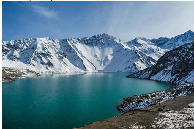
Embalse El Yeso.

A una altitud de 2.500 msnm. Se forma al capturar las aguas del río Yeso, uno de los afluentes más importantes del río Maipo. La represa fue construida por diez años, siendo inaugurada en 1964. El embalse tiene una capacidad de 253 millones de metros cúbicos, siendo la principal fuente de abastecimiento de agua potable para la Región Metropolitana y la conurbación de Santiago. Durante el verano, en sus aguas color turquesa se puede practicar windsurf y pesca de truchas arcoiris. Más al interior, está el acceso a las Termas del Plomo. Durante el período invernal, es extremadamente difícil el acceso debido a los fuertes nevazones. (Servicio Nacional de Turismo, 2012).