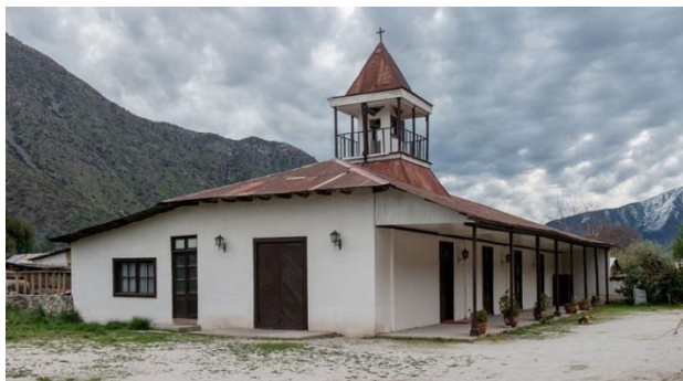
Capilla y casa del Ex Fundo El Manzano.

Ambas construcciones poseen muros de adobes, corredores porticados, de traza colonial, estando rodeadas de pequeños potreros cercados de tradicionales pircas de piedras, que representan testimonios históricos y arquitectónicos de la zona (Consejo de Monumentos Nacionales de Chile).