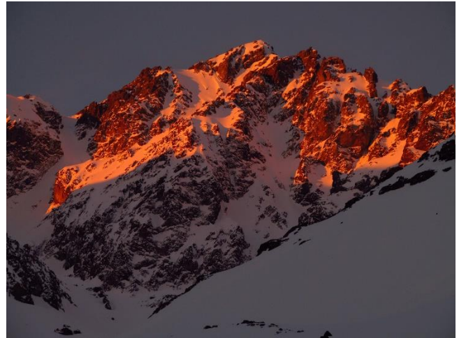
Cordón de Los Picos Negros.