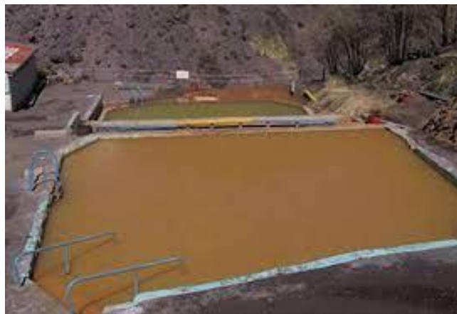
Baños Morales.

Se encuentra a una altura de 1.800 msnm, junto a un entorno precordillerano en el Cajón del Maipo. Estas aguas termales poseen propiedades curativas para el reumatismo, la artritis, lumbago, afecciones a la piel. La temperatura es de aproximadamente 25°C. Baños de Tina; Baños de Barro. (Servicio Nacional de Turismo, 2012).