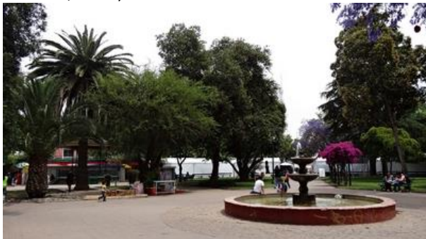
San José de Maipo.

El centro histórico de la ciudad fue declarado Zona Típica en julio de 2010. Fue fundada por Ambrosio O'Higgins, el 16 de julio de 1792, con el nombre de Villa San José de Maipo, en honor de San José. Hacia finales de siglo se convierte en un polo de desarrollo para el ecoturismo, gracias a su caudaloso río muy apto para la práctica del rafting. El Centro Histórico presenta el característico esquema tradicional de manzanas cerradas a la calle por volúmenes horizontales de un piso en fachada continua, con predominio del muro lleno por sobre el vano, de expresión simple con reminiscencias neoclásicas en elementos ornamentales de puertas, ventanas, balcones, antechos y zócalos. (Servicio Nacional de Turismo, 2012).