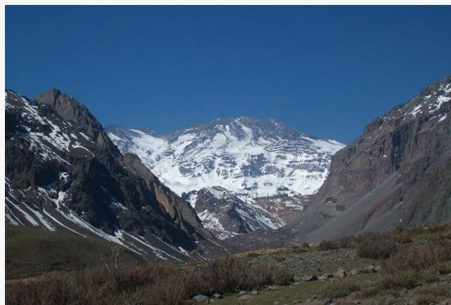
Volcán San José.

Se encuentra ubicado en la frontera de Argentina (Provincia de Mendoza) y Chile (Región Metropolitana de Santiago), en cuyo territorio se encuentra la cumbre. Se trata de una estructura volcánica emplazada en un cordón eruptivo de unos 8 kilómetros de largo. Su cumbre está conformada por cuatro cráteres que se traslapan, estructurando una depresión cratérica de unos 2 kilómetros de largo, por 0,5 kilómetros de ancho, dentro de la cual se emplaza el cráter activo con un pequeño domo en su interior, el cual está cubierto por intensas fumarolas.