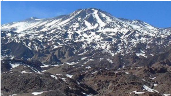
Volcán Tupungatito.

Volcán que posee una rugosa y gruesa cúpula de nieves eternas, el cual se ubica en el cordón limítrofe, en el origen del río Colorado, a una altura de 6550 msnm. tiene un cráter de 3 kilómetros de diámetro y en su fondo se observa gran cantidad de nieve. Se caracteriza por su redondeada cúpula de hielo (Servicio Nacional de Turismo, 2012).