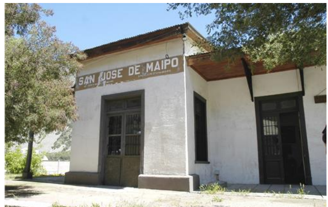
Estación de Ferrocarriles de San José de Maipo.

Declarada Monumento Nacional en 1991, junto a todas las construcciones del trazado del ex ferrocarril Puente Alto- El Volcán- Cajón del Maipo. La antigua estación de San José de Maipo, del tren militar que corría desde Puente Alto, hasta la localidad de El Volcán. Hasta la década de los 80 operó este ferrocarril que solo tenía una trocha de 40 centímetros. Solo quedan algunos vestigios, sobre todo, puentes y estaciones. (Servicio Nacional de Turismo, 2012).