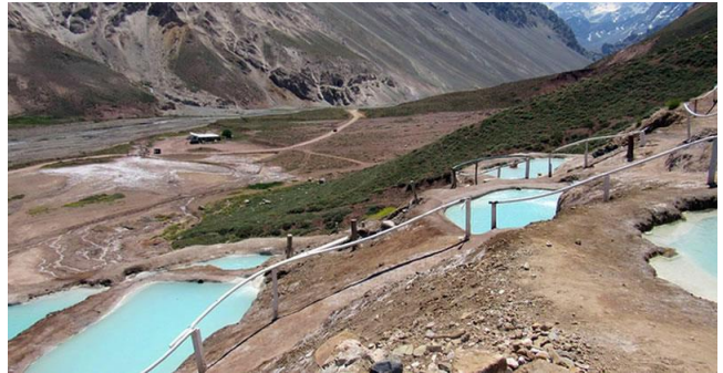
Baños Colina.

A 3.500 msnm, en estas pozas naturales dispuestas como terrazas al aire libre, formadas por los depósitos calcáreos de agua termal, con temperaturas de hasta 70°C, puede disfrutar de un relajante y terapéutico baño de aguas minerales y barro, observando el fascinante entorno natural cordillerano junto al río (Servicio Nacional de Turismo, 2012).