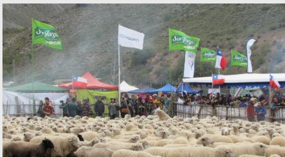
Fiesta de la Esquila.

Esquila asociativa, donde arrieros y pastores de la comunidad del Relvo comienzan la bajada de lanares para su posterior esquila. Evento que se realiza con la llegada de la primavera y al ritmo de payadores y cantores locales, además de muestra gastronómica y artesanía local. (Servicio Nacional de Turismo, 2012).