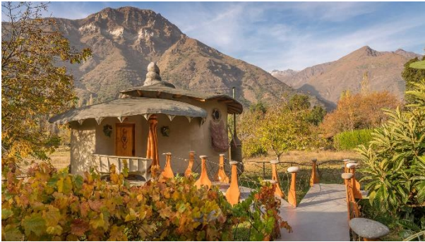
Cascada de las Ánimas.

Declarado Santuario de la Naturaleza en 1995. El predio se encuentra en la zona precordillerana andina, que se caracteriza por poseer quebradas de abruptas laderas que sirven de cauce natural para el escurrimiento del sistema hidrográfico de la zona y altas cumbres, los cuales dan lugar a parajes de gran belleza escénica. El Río Maipo y el Estero El Manzanito son los principales cursos fluviales que atraviesan Cascada de las Ánimas; otros menores dan lugar a diversos esteros y cascadas, como la que da su nombre al predio. El clima y las características del terreno dan lugar a una vegetación donde dominan los matorrales espinosos bajos. (Servicio Nacional de Turismo, 2012).