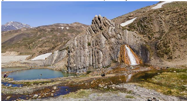
Termas del Plomo.

Las Termas del Plomo son unas rústicas pozas naturales de aguas termales provenientes del Volcán San José, insertas en medio de la Cordillera de los Andes, a una altura aproximada de 2.900 msnm. Estando en las Termas, se pueden realizar diversas actividades, como las caminatas por los alrededores, en donde, a una hora de caminata normal, encontrará la Laguna de Los Patos. También se puede realizar trekking, o simplemente tomar bellas fotografías. (Servicio Nacional de Turismo, 2012).