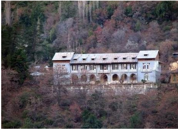
Casa de Salud de Mujeres Carolina Deursther.