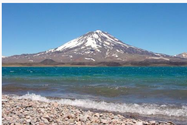
Volcán Maipo.

Estratovolcán cónico activo desarrollado sobre una caldera, en estado pasivo temporal, de 5.323 msnm de altitud, localizado en los Altos Andes, en la frontera entre Argentina y Chile. (Servicio Nacional de Turismo, 2012).