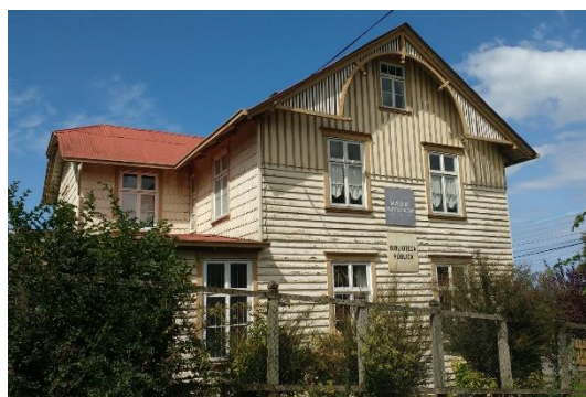
Museo El Colono

En este museo se puede conocer un poco más de la historia de Puerto Octay, el cual cuenta con registros fotográficos, objetos y maquinaria que dan testimonio del desarrollo de la comuna desde sus orígenes hasta la llegada en 1852 de los colonos alemanes a la zona, cuando se establecieron las primeras 12 familias en la localidad hoy conocida como Playa Maitén ( https://bit.ly/3NVrX9a ).