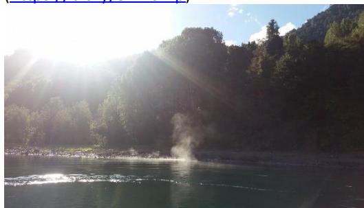
Termas del Rupanco

Termas naturales ubicadas a orillas del lago Rupanco, sobre cuyas aguas se reflejan los volcanes Puntiagudo y Osorno ( https://bit.ly/3zBfcMp ).