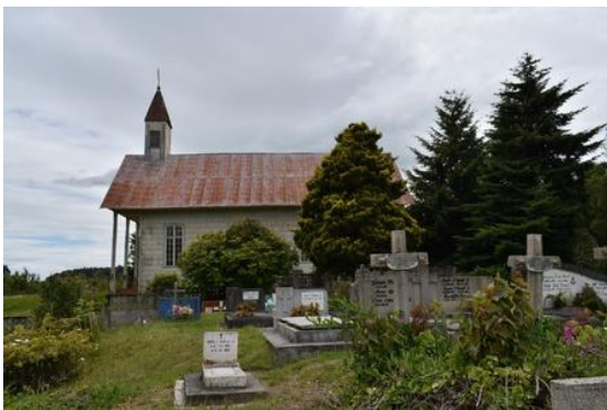
Capilla y Cementerio Católico de Playa Maitén

Erigida como recordatorio de la llegada de las primeras familias alemanas en 1852 como parte del proceso de la colonización. ( https://bit.ly/3zBfcMp ).