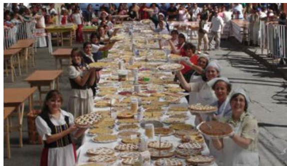
Fiesta Costumbrista “Rescatando Nuestros Orígenes” Fuentes: https://bit.ly/3xufJNo

En enero se lleva a cabo esta fiesta costumbrista con una amplia gama de actividades y muestras gastronómicas, como platos típicos, curantos, asados al palo de cordero, cerdo, pulmay, sopaipillas, empanadas, repostería, cerveza artesanal, muday entre otros ( https://bit.ly/3xufJNo ).