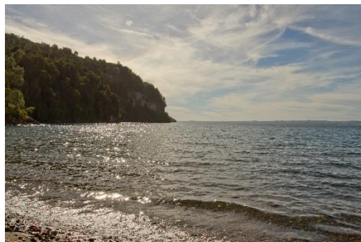
Playa Islote Rupanco

Playa de arena fina, cuenta con áreas de picnic. En ella se ubica el Club de Pesca y Caza con servicio de restaurante y alojamiento. Especial para la práctica de deportes náuticos (Servicio Nacional de Turismo, 2012).