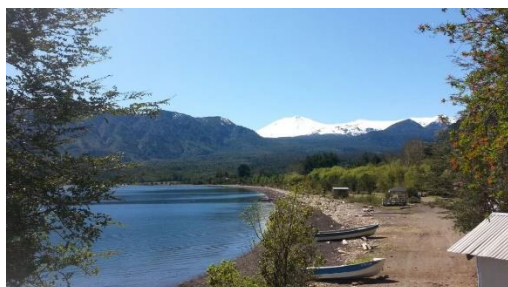
Las Gaviotas de Rupanco

En el Sector Las Gaviotas se pueden realizar numerosas actividades, relacionadas con la hermosa naturaleza que ofrece este lugar: cabalgatas, pesca deportiva, caminatas, observación de flora y fauna (Servicio Nacional de Turismo, 2012).