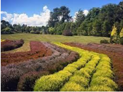
Vivero Los Ulmos

Ubicado en el sector La Picada a 29 kilómetros de Puerto Octay, frente al lago Llanquihue. Ofrece un hermoso campo de ericas de colores, una especie originaria en su mayoría de Sudáfrica ( https://bit.ly/3NvrX9a ).