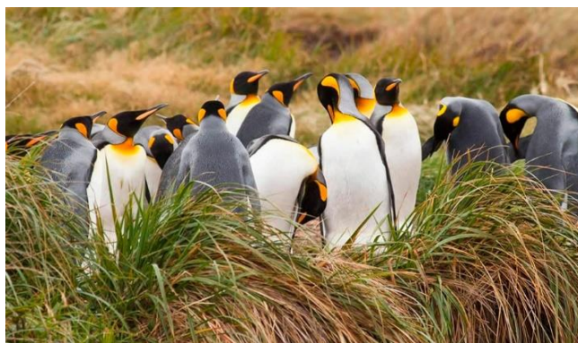
Parque Pingüino Rey.