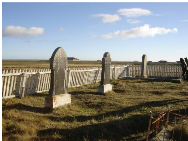
Cementerio Onaisin.

Declarado Monumento Histórico D.S. 556 del 10/06/1976. El cementerio corresponde a los pobladores y colonos de la estancia “Caleta Josefina” de la Sociedad Explotadora de Tierra del Fuego, fundada en 1893. (Servicio Nacional de Turismo, 2012).