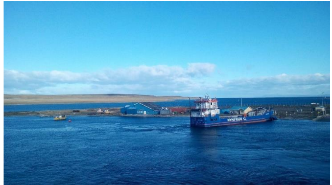
Bahía Chilota.

Se ubica en el canal que comunica el Estrecho de Magallanes con la Bahía Porvenir, en la ribera oriental del Estrecho de Magallanes. En el sector de Bahía Chilota viven 73 personas (Censo 2002), las cuales se dedican esencialmente a actividades de pesca artesanal y comercio minorista. La actividad naviera de Bahía Porvenir se centra entre Bahía Chilota y la entrada a la bahía, la cual es transitada por embarcaciones menores (artesanales) y por la Barcaza Melinka (Transbordadora Austral BROOM S.A.), que realiza principalmente faenas de cabotaje entre Punta Arenas y Puerto Porvenir. (Servicio Nacional de Turismo, 2012).