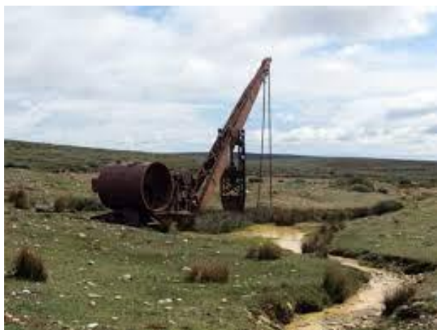
Cordón Baquedano.

Reconocido por sus pintorescas rutinas de extracción aurífera, el Cordón Baquedano se instala en medio del escenario austral con 115 kilómetros de recorrido, que revelan viejas prácticas de los pirquineros de la zona. Dotado de una maravilla paisajística, en el lugar además es posible encontrar antiguas construcciones que utilizan el pasto como material arquitectónico, convirtiéndolo en un hermoso atractivo en Tierra del Fuego. (Servicio Nacional de Turismo, 2012).