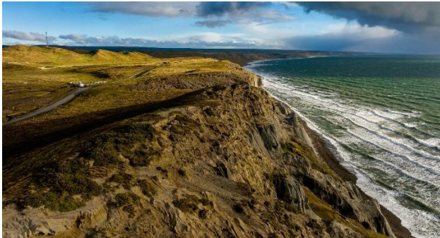
Bahía Inútil.

En la costa occidental de la isla grande de Tierra del Fuego. Es una extensa bahía bordeada de costas planas. Un camino costero bordea la bahía en un interminable recorrido por caseríos y pequeñas caletas como Caleta Rosario, Armonía, Caleta Jorquera, Puerto Nuevo, Onaisin (Ex Estancia Caleta Josefina), Estancia La Florida, Cameron y Timaukel. (Servicio Nacional de Turismo, 2012).