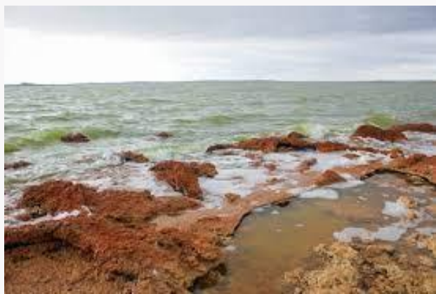
Monumento Natural Laguna de Los Cisnes.

Creado en 1982, comprende los siete islotes interiores de la Laguna de los Cisnes; con una superficie de 25,3 hectáreas. Esta unidad está conformada solamente por islotes que se encuentran casi desprovistos de vegetación y que se caracterizan por la presencia de una variada avifauna terrestre - marina. Entre estas especies destaca un número indeterminado de cisnes de cuello negro, cisnes de cuello blanco, flamencos, canquén, caiquén, carancho o traro y diversas especies de patos (Servicio Nacional de Turismo, 2012).