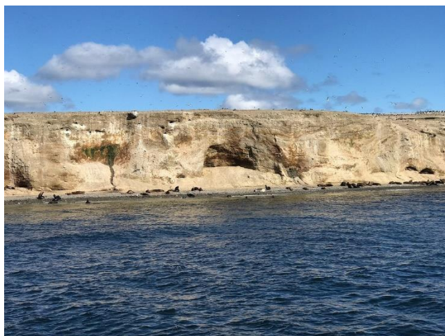
Isla Marta.