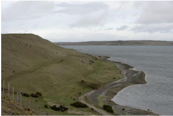
Bahía Gente Grande.