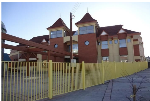
Museo Fernando Cordero Rurque.