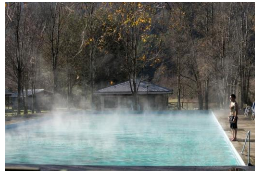
Termas de Liquiñe

Centro del Servicio Bienestar Social de la Armada de Chile, implementado con 18 cabañas, comedores, bar, sala de juegos y 2 piscinas (Servicio Nacional de Turismo, 2012).