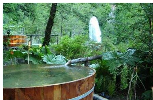
Termas del Rincón

Con 5 amplias tinajas de madera y piscina en medio del bosque nativo. Cuenta con servicio de baños de barro, masaje, esencias florales, reiki y cafetería (Servicio Nacional de Turismo, 2012).