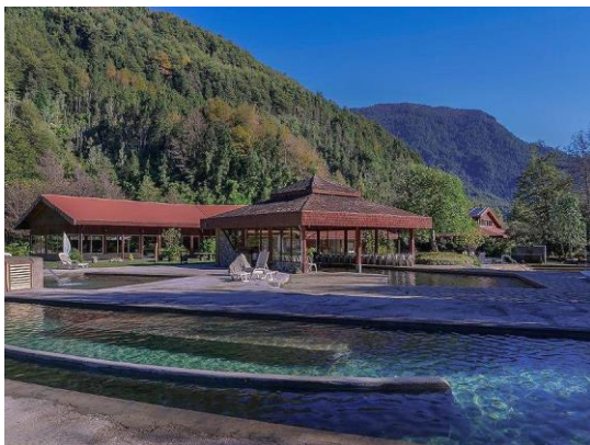
Termas de Coñaripe

Tiene piscina termal techada, hidromasaje, 4 piscinas termales al aire libre, baños privados con hidromasaje, cafetería, restaurante, hotel y cabañas (Servicio Nacional de Turismo, 2012).