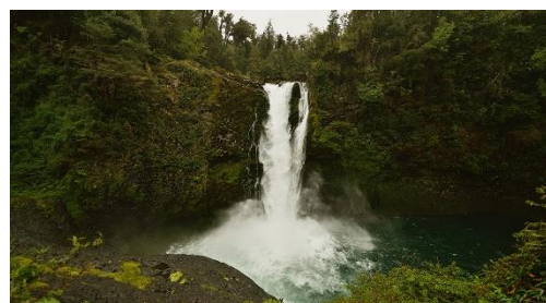
Salto del Puma

Bravío y ancho salto del río Fuy que se ubica en medio de la Selva Valdiviana. El sendero La Leona tiene un recorrido de acceso de baja dificultad (Servicio Nacional de Turismo, 2012).