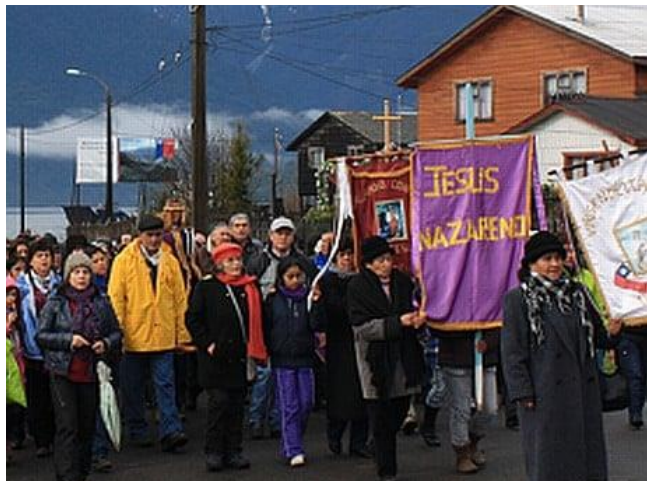
Fiesta Religiosa Jesús Nazareno

Los habitantes de todo el sector costero asisten a la misa y a la procesión del Jesús Nazareno en Rolecha, siendo la fecha de celebración cada 30 de agosto. Por otra parte, en la localidad de La Arena, también se realiza esta festividad el 30 de agosto. Además, debido a que un 8 de febrero, llegó la figura del Jesús Nazareno a esta zona, desde entonces se celebra una misa dicha fecha, la procesión hasta el lugar al que llegó la imagen y posteriormente la celebración. (Municipalidad de Hualaihué).