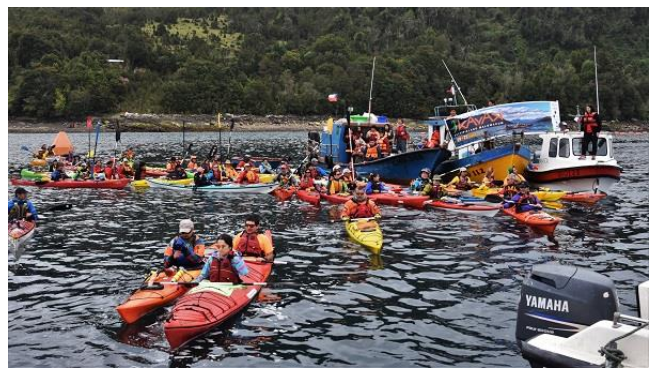
Travesía en Kayak por el Archipiélago Malomacun

En enero se realiza una travesía en kayak la por los hermosos parajes de los canales de Hualaihué, Puerta Norte de la Patagonia Austral. La navegación se desarrolla recorriendo islas y canales místicos cargados de historia ancestral; donde se puede apreciar las loberías del sector, aves acuáticas, la flora prístina y endémica; y toda la historia que envuelve este majestuoso territorio. El evento tiene una duración de 3 días, primer día charla técnica, el segundo comenzar la navegación en el sector El Cobre de la localidad de Hornopirén, para luego recorrer los canales Hualaihué y Malomacún, disfrutar de baños termales en las Termas de Llancahué y finalmente regresar a la costa de Hornopirén. (Municipalidad de Hualaihué).