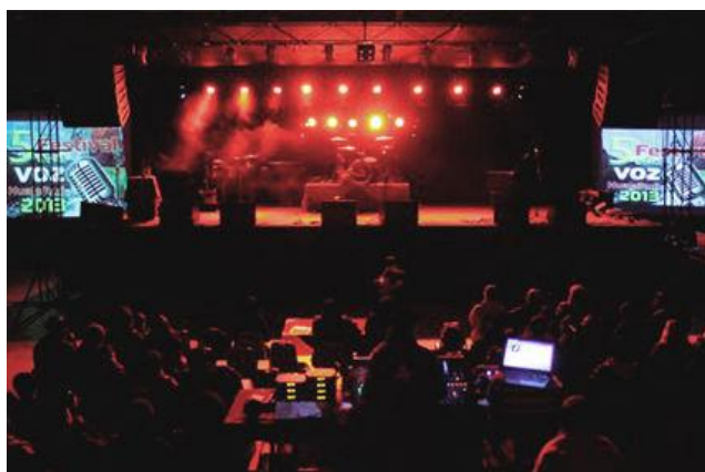
Festival de la Voz Hualaihué “Alerce y Carretera Austral”

Esta actividad destaca en el territorio a través de la música; el estímulo a los artistas de la zona sur y la transformación de Hualaihué en un foco artístico, cultural y turístico. Consta de una competencia de cantantes locales y otra competencia nacional, además de traer artistas y grupos musicales de alto nivel (Municipalidad de Hualaihué).