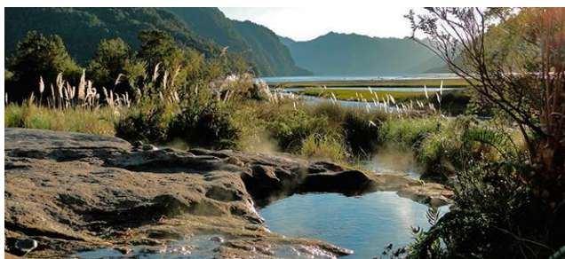
Termas de Cahuelmo

Ubicadas en el fiordo de Cahuelmó, compuestas por una serie de pozos donde se acumula agua termal que a su vez es distribuida a los baños que reciben a los turistas. Las termas de Cahuelmó están equipadas con quinchos para realizar asados, además de baños y lugares adaptados para el camping (Servicio Nacional de Turismo, 2012).