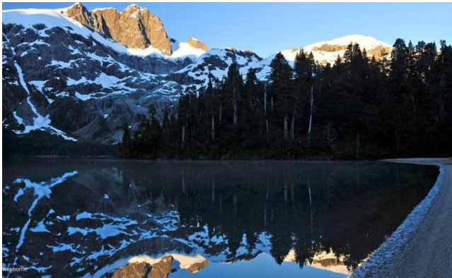
Parque Nacional Hornopirén

Aproximadamente la mitad del parque está cubierto por vegetación, constituida principalmente por alerce, lenga, coigüe de Magallanes, luma, entre otras especies (Servicio Nacional de Turismo, 2012).