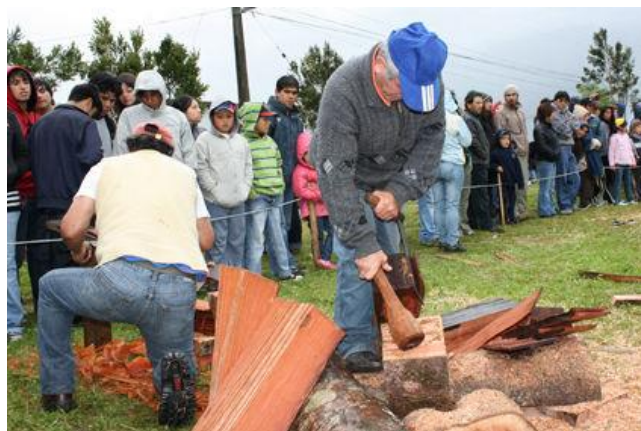
Semana Cordillerana

La Semana Cordillerana es un homenaje a las costumbres y tradiciones que van perdurando en el tiempo, ya que son parte de la cultura y celebración familiar de las actividades tradicionales (Municipalidad de Hualaihué).