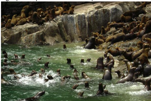
Loberías Isla Lilihuapi

Se puede acceder por vía marítima desde Hornopirén en una travesía de 1 hora de navegación. Aquí se podrá apreciar la flora y fauna marina, cientos de lobos marinos aglomerados en rocas y los bellos Liles, característicos del lugar (Municipalidad de Hualaihué).