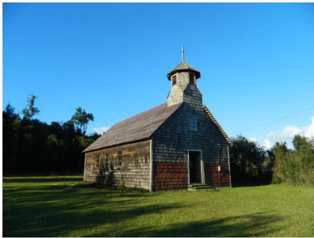
Iglesia de la Poza

Capilla de San Nicolás de Tolentino. La Capilla San Nicolás de Tolentino de la localidad costera de La Poza es una de las más antiguas de la comuna de Hualaihué. Su fecha de construcción sería anterior a 1890 y es una de las pocas capillas de la comuna que conserva casi intacta su estructura y materiales originales. Edificada por completo en madera de alerce. En proceso de declaratoria de Monumento Histórico (Servicio Nacional de Turismo, 2012).