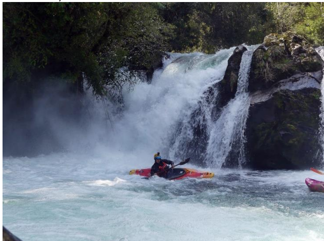
Festival del Río Hornopirén

Este evento nació del interés de los kayakistas locales y la comunidad con el objetivo de celebrar el deporte al aire libre, la sana competencia, la protección de los recursos naturales y potenciar la zona y sus atractivos turísticos. Este festival se caracteriza por ser una competencia de kayak de aguas blancas, en donde los kayakistas compiten por ser los mejores en sus distintas categorías. Junto con lo anterior el evento busca poner en valor los atractivos naturales que la comuna posee, como el río Negro y río Blanco, junto con mostrar el potencial culinario de la zona al incorporar comidas típicas (curanto) y Mai Mai (Municipalidad de Hualaihué).