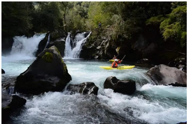
Cascadas del Río Negro

Ubicadas en el sector de Chaqueihua y en medio de la naturaleza, estas hermosas caídas de agua tienen aproximadamente 3 metros de altura. Además, se puede disfrutar de un entorno con bosques frondosos, riachuelos y un ambiente lleno de paz y tranquilidad. Se ubican a unos 10 minutos de Hornopirén, donde se encuentran distintos centros turísticos que ofrecen servicios de camping, alimentación y senderos, los que después de un corto recorrido permiten ver las cascadas que componen las múltiples caídas de agua. El río Negro es también un lugar perfecto para las actividades de deportes acuáticos como el kayak. (Municipalidad de Hualaihué).