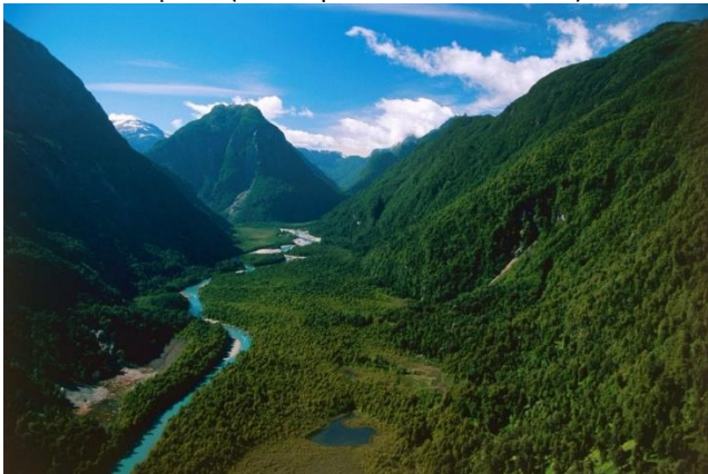
Parque Nacional Pumalín

El parque protege un Bosque Templado Lluvioso, rico en flora, el cual es hogar de muchas especies endémicas, incluyendo algunos de los últimos ejemplares que quedan en el planeta del amenazado, enorme y milenario Alerce, protegidos como Monumento Natural. Dentro de la comuna se encuentra la zona del PN Pumalín Norte, específicamente las Termas de Cahuelmo, donde también se encuentra un sendero establecido hacia el Lago Abascal. A este sector se puede llegar a través de una navegación desde Hornopirén (Municipalidad de Hualaihué).