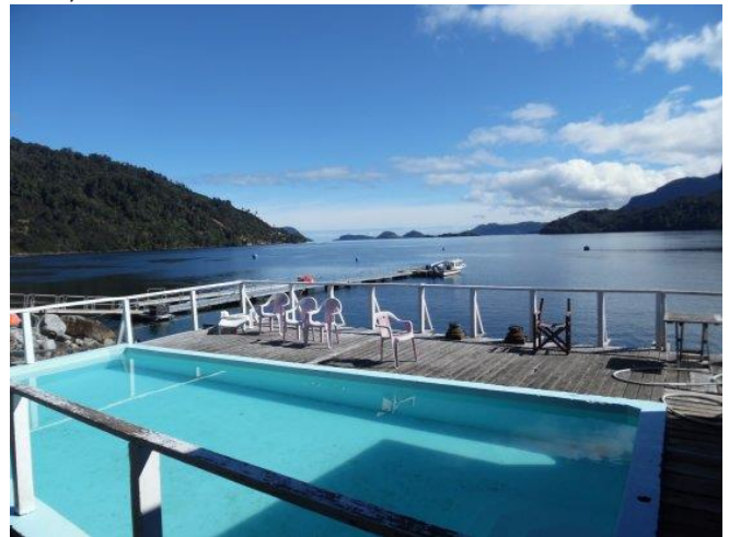
Termas de Llancahue

Están emplazadas en la Isla del mismo nombre. Aquí encontrará alojamiento, comida casera. Podrá visitar el archipiélago de Llanchild, la iglesia y el cementerio para realizar actividades de esparcimiento como fotografía, excursiones y observación de flora. Hay tres variedades de baño termal: en tinas, a 52°C, en una piscina al aire libre o en la playa, donde existen vertientes que temperan el agua, aun en los días de lluvias. Este tipo de termas están recomendadas para el reumatismo y dolores musculares y están abiertas todo el año (Servicio Nacional de Turismo, 2012).