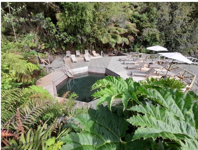
Termas de Pichicolo

Fuentes termales con revestimientos de madera nativa de distintas dimensiones, situadas en medio del bosque y circundadas por el estero de Pichicolo y afluentes de este (Servicio Nacional de Turismo, 2012).