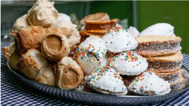
Dulcerías chilenas de Curacaví.

Con casi 120 fábricas, los dulces chilenos de Curacaví son uno de los más famosos del país, los que se caracterizan por su producción artesanal, utilizando clásicas recetas caseras de la época de la Colonia. En muchas de estas dulcerías, el visitante no solo podrá degustar de sus variedades gastronómicas, sino que también podrá realizar visitas guiadas para conocer el proceso de producción (Chileestuyo.cl).