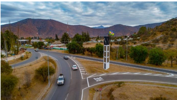
Pueblo de Curacaví.

La historia de Curacaví se remonta a las primeras invasiones incas a la zona, sin embargo, no fue hasta la conquista española que construyeron el pueblo como se conoce hoy. Es por ello que recorriendo el poblado es posible encontrarse con casonas antiguas, calles de tierras, carretas tiradas por caballos, entre otros atractivos (Chileestuyo.cl).