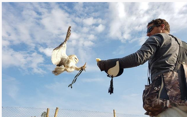
Mauco Rapaz.

Busca dar a conocer la riqueza biológica de Chile, enfocada principalmente en las aves de presa que lo habitan. Entre los servicios que ofrecen se encuentra el paseo entre rapaces, el cual consiste en visitar el Fundo Los Quilos en Curacaví, en un espacio rodeado de naturaleza y con el objetivo de dar a conocer estas aves, se enseña lo que es un ave rapaz, su rol dentro de los ecosistemas y se hace vivir la experiencia de un ave rapaz volando al puño de los visitantes. Se realizan vuelos en absoluta libertad de las aves que posee el fundo para que así los huéspedes puedan apreciar en primera persona las habilidades aéreas de las aves rapaces (Mauco Rapaz).