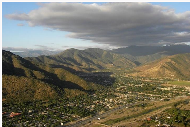
Valle de Curacaví.

A 47 kilómetros de Santiago, el Valle de Curacaví es el punto de conexión por excelencia entre la capital y Valparaíso. Se caracteriza por sus campos frutales, parronales, dulces y restaurantes. La comuna del mismo nombre es afamada por su repostería y chicha, ambas tradiciones sumamente arraigadas a la cultura del lugar (Turismo en Chile).