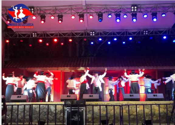
Fiesta de la Chicha de Curacaví.

Tradicional fiesta costumbrista de la Chicha de Curacaví, actividad que convoca a más de 10 mil personas de diferentes regiones del país. Se realizan distintas actividades para entretener a los asistentes, y participan más de 40 grupos folclóricos de todo Chile. La festividad es gratuita, para que pueda asistir toda la familia. Además, se convoca a diversos artesanos, productores y expositores para que sean parte de los stands. (Servicio Nacional de Turismo, 2012).