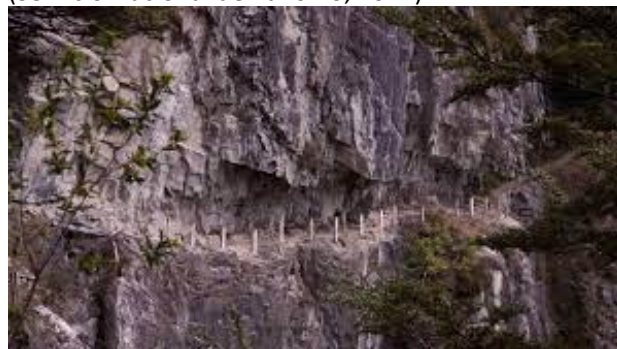
Paso San Carlos o Lucas Bridge.

Es un sendero, semi túnel y túnel cortado en roca de 645 metros de largo en un acantilado rocoso de 200 a 250 metros sobre el río Baker frente a El Saltón. Este paso formaba parte de la primera senda caminera construida en la región por la Comisión Chilena de Límites, entre 1900 y 1902 y que iba desde el Puerto San Carlos en el río Baker hasta el Lago Cochrane, con 76 kilómetros de longitud, más ramales de 55 kilómetros hacia el río Chacabuco y lagos Bertrand y Buenos Aires (hoy General Carrera) (Servicio Nacional de Turismo, 2012).