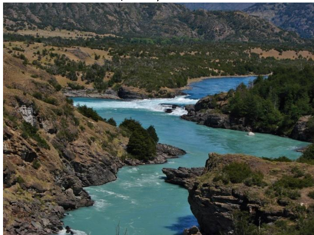
Confluencia ríos Baker y Nef.

Un desnivel en los cursos de agua de más de 10 metros en la confluencia de los ríos Nef y Baker provoca un salto de agua de magnitud, debido a los caudales de ambos ríos, y con un marcado contraste entre las turquesas aguas del río Baker y las lechosas aguas del río Nef, debido a la gran cantidad de material sedimentario que arrastra desde su nacimiento en los campos de hielo norte. Su paisaje circundante corresponde a la estepa patagónica. No es un sector apto para la navegación ni para el desarrollo de actividades acuáticas (Servicio Nacional de Turismo, 2012).