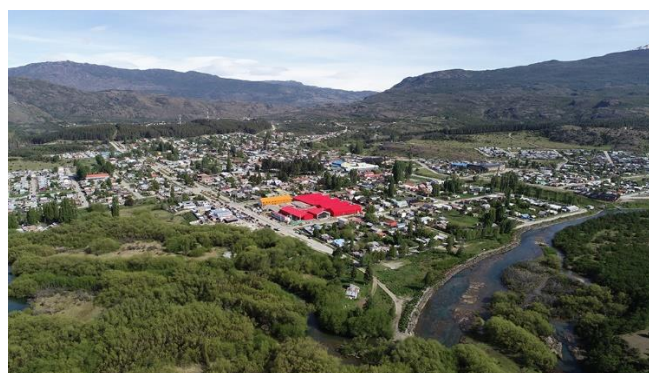
Cochrane.