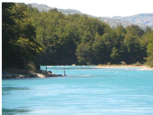
Río Baker.

Con aguas caudalosas de color verde esmeralda, el río que tiene su origen en el lago Bertrand, es otro de los pasos obligados para turistas nacionales y extranjeros. Con una extensión de 200 kilómetros, es el indicado para las prácticas deportivas y de recreación, indicado para la pesca con mosca, el rafting y el kayak de río, a lo largo de toda su extensión hasta que finaliza en Caleta Tortel (Servicio Nacional de Turismo, 2012).