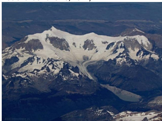
Monte San Lorenzo.

Es una de las principales cumbres patagónicas, se ubica en el cordón oriental de la cordillera de los Andes, con una altura de 3.706 msnm. Sus faldeos y acceso están cubiertos por vegetación nativa y sus cumbres presentan glaciares y abundante nieve todo el año, características que lo hacen apto para la práctica de actividades de montañismo en sus distintos niveles de dificultad. Su acceso es terrestre desde el camino austral por el valle del río Tranquilo y del Salto (Servicio Nacional de Turismo, 2012).