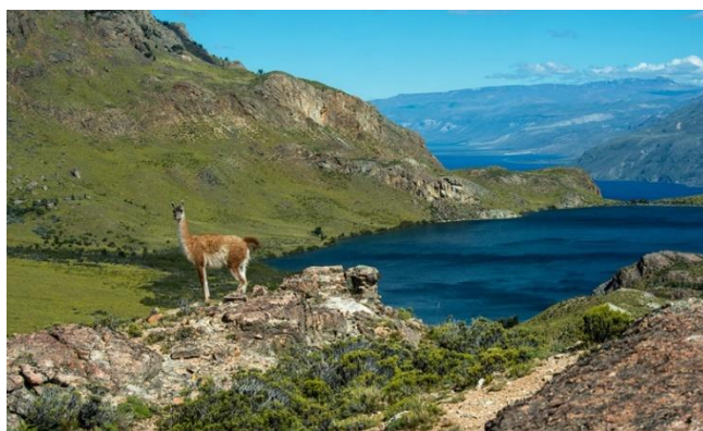
Parque nacional Patagonia.

Si se quiere acceder al sector de Tamango, llegar primero a Cochrane y desde la Plaza de Armas, para dirigirse por 4,3 kilómetros hacia el noroeste. Para acceder al sector de Jeinimeni, se debe tomar en dirección hacia a Chile Chico, desde donde se toma la ruta X-753 (misma que lleva al aeródromo) por alrededor de 65 kilómetros hasta llegar al lago Jeinimeni (Corporación Nacional Forestal).