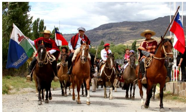
Fiesta Costumbrista de Cochrane.

Este tradicional encuentro busca rescatar y difundir las costumbres más antiguas de la Patagonia Chilena, siendo el evento de estas características más antiguo de la región de Aysén. Cuenta con puestos, donde se ofrecen tortas fritas y el mate amargo, cebado por pobladores antiguos de la comuna. También se puede apreciar una muestra de esquila de oveja con tijerón y maquinaria. Destaca el desfile de los colonos, donde más de un centenar de personas a caballo y con carretas recorren la ciudad, y comparten una gran mateada. El cierre del evento está a cargo de los músicos locales (Servicio Nacional de Turismo, 2012).