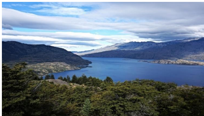
Lago Cochrane.

Es un lago cordillerano que se comparte Argentina, la porción perteneciente a Chile es de 173 km 2 . Sus aguas son de color azul intenso. Sus características geográficas permiten el desarrollo de un microclima que afecta los sectores inmediatamente más cercanos al lago. Presenta condiciones para el desarrollo de la pesca deportiva y deportes náuticos. En su ribera norte se localiza la Reserva Nacional Tamango de la Corporación Nacional Forestal, donde se puede apreciar el lago y fauna nativa (Servicio Nacional de Turismo, 2012).