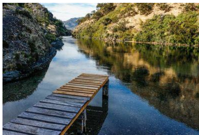
Reserva Nacional Tamango.

Se caracteriza por un cordón montañoso denominado Divisadero, formado por volcanitas que cubren la mayoría de las cumbres extra-andinas orientales de la región. En ella se encuentran los cerros Tamango de 1.722 metros y Tamanguito de 1.485 metros. Producto de los esteros que caen al lago Cochrane la topografía es ondulada con quiebres frecuentes y en la parte oriental está cubierta por amplias superficies rocosas. En esta reserva se encuentra una de las mayores colonias de huemules de la región (Servicio Nacional de Turismo, 2012).