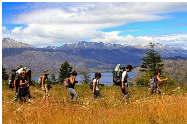
Ruta del Huemul.

Se realiza cada año durante el tercer fin de semana del mes de enero, reuniendo a una gran cantidad de participantes nacionales y extranjeros amantes del ecoturismo y la vida al aire libre. Consiste en una caminata de dos días que parte en valle Chacabuco y finaliza en la Reserva Nacional Tamango, principal centro de estudio y conservación del Huemul en el país. Cada año participan cerca de 100 personas, contando con cupos limitados en cada versión (Servicio Nacional de Turismo, 2012).