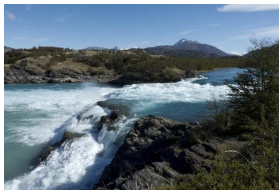
Salto Río Baker.

Se localiza a 10 kilómetros aguas abajo de la confluencia del río Baker y Ñadis. Lugar donde el río Baker se estrecha considerablemente permitiendo que ese gran caudal concentre toda su energía en un trayecto de aproximadamente de 200 metros, terminando estos rápidos en un salto de aproximadamente 20 metros que precipita estrepitosamente las aguas con gran energía, generando un notable espectáculo de fuerza del río mas caudaloso de Chile. Se accede caminando o en caballo (Servicio Nacional de Turismo, 2012).