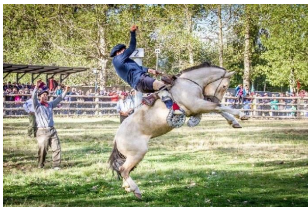
Festival de Jineteadas “Coraje y Amistad”.

El Club “Los Refalosos del Baker” integrado por campesinos y amantes de las jineteadas, organiza este evento en conjunto con la municipalidad cada año en marzo, donde se puede disfrutar de dos días de competencias de jineteadas en las categorías Basto con encimera. También se llevan a cabo montas especiales a cargo de destacados jinetes regionales e internacionales. De igual modo, se realizan competencias de apialadas de yeguas (Fundación Río Baker, 2019).