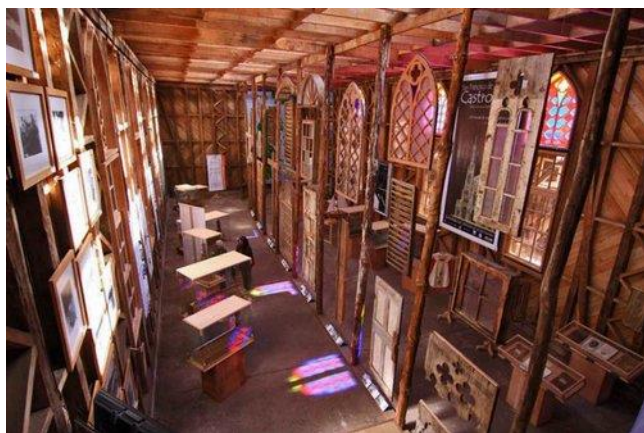
Museo Pioneros del Baker.