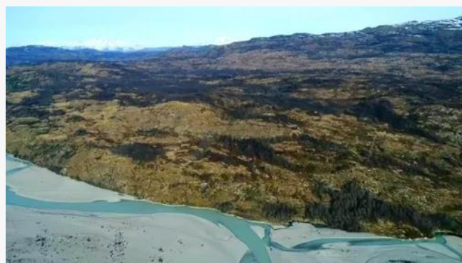
Río Colonia.

Es uno de los tributarios importantes del río Baker. Nace en los ventisqueros y lagos localizados en el límite este del campo de hielo norte como, Cachet, Colonia y Arenales. En su corto recorrido este río nace en un estrecho valle que luego se abre para unirse al Baker, el cual permite el acceso a los lagos y ventisquero ubicados en su parte superior, donde se puede desarrollar una serie de actividades relacionadas con turismo de aventura, ecoturismo y de intereses especiales (Servicio Nacional de Turismo, 2012).