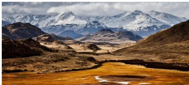
Valle Río Chacabuco.

Valle transversal donde se manifiesta la transición de montaña a pampa. Debido a sus características ambientales de excepción, la mayor parte del territorio de este valle se encuentra bajo protección privada y algunos sitios se han identificado como prioritarios para la conservación de la biodiversidad. Entre las especies animales con mayor presencia se encuentra el guanaco, huemul, puma, piche, vizcacha y una serie de aves típicas de la pampa patagónica (Servicio Nacional de Turismo, 2012).