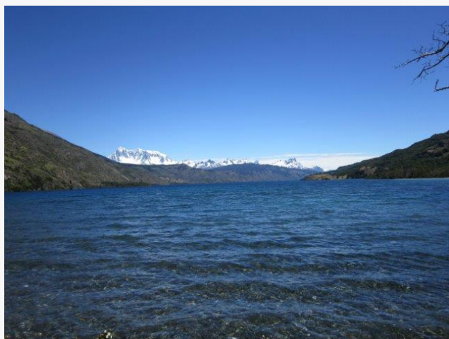
Lago Brown.

Este lago es de origen glaciar y desagua sus aguas al lago Cochrane ubicado más al norte. Este lago tiene gran potencial para la pesca recreativa y en su entorno se pueden desarrollar una serie de actividades como trekking y cabalgatas. Actualmente su acceso terrestre en vehículo está restringido a los meses de mejores condiciones climáticas (Servicio Nacional de Turismo, 2012).