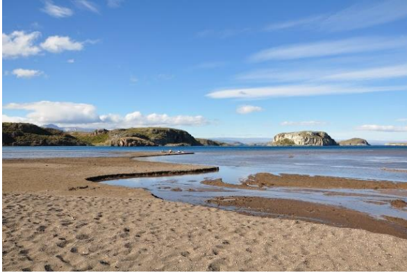
Bahía Jara.

Bahía Jara es una hermosa playa lacustre del Lago General Carrera, frente a la Península de Levicán. Probablemente sea el lugar de la comuna más apto para el baño y la práctica de deportes náuticos por su ubicación protegida del viento. Este hecho ha motivado diversas iniciativas para potenciar el balneario y condicionarlo como zona de camping. Se ha realizado la plantación de un bosquecillo de sauces junto a la implementación de fogones, quinchos, bancas, baños, un portal con una garita y servicio telefónico (Servicio Nacional de Turismo, 2012).