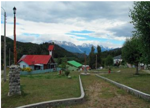
Mallín Grande.

Es una localidad pequeña pero muy bien equipada, cuenta con escuela, posta, teléfono y servicios básicos. Es el punto de partida del tramo de 31 kilómetros, inaugurado en 1991, que permite conectar directamente el Camino Austral con el sector oriental de la Comuna y con el territorio argentino, a través del Paso Las Llaves, ruta que cruza un enorme acantilado rocoso a 600 metros de altura y desde donde se obtiene una vista espectacular del Lago General Carrera. La zona de Mallín Grande es habitada por abundante fauna silvestre, se pueden encontrar aves como caiques, faisanes silvestres y distintas especies de patos. Es un lugar excelente para la pesca y para realizar cabalgatas (Servicio Nacional de Turismo, 2012).