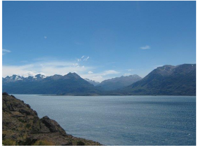
Lago General Carrera.

Declarado Zona de Interés Turístico. Es un lago de origen glaciar, segundo en Sudamérica en cuanto a superficie, es compartido con Argentina y la superficie que le corresponde a Chile se aproxima a los 978 km 2 . Este lago de aguas color turquesa presenta condiciones óptimas para la pesca recreativa, actividades de navegación en diversas modalidades como vela y kayak. En su entorno se origina una serie de paisajes y ambientes naturales de extraordinaria belleza. En sus riberas se localizan una serie de villas y puertos lacustres (Servicio Nacional de Turismo, 2012).