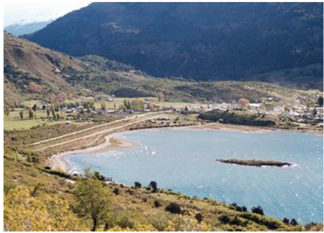
Puerto Guadal.

Emplazada en una bahía del Lago General Carrera, Puerto Guadal se caracteriza por la agradable temperatura de sus aguas, su gran playa de arena y un excelente clima en la temporada primavera-verano, virtudes que le han dado el nombre de “la perla del lago”. Puerto Guadal comenzó a poblarse hacia 1918. En las últimas décadas, las respectivas habilitaciones del Camino Austral y del Paso Las Llaves, han permitido la conexión terrestre de Puerto Guadal con el resto del país y con el territorio argentino. La principal actividad económica en Puerto Guadal es la ganadería ovina y bovina. Se debe destacar la producción local de miel, mermeladas y licores (Servicio Nacional de Turismo, 2012).