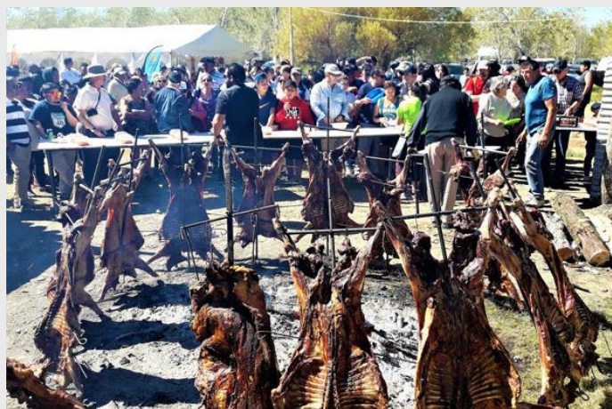
Fiesta Costumbrista de Bahía Jara.

Un evento esperado por la gente de la comuna y también por los visitantes es la Fiesta Costumbrista de Bahía Jara, la cual, durante dos días se congregan las familias para disfrutar de actividades acuáticas, jineteadas, juegos para niños, comidas típicas y los esperados asados populares (Radio Las Nieves, 2019).