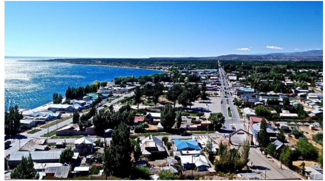
Chile Chico.

Capital provincial y comunal. El pueblo se ubica a orillas del gran lago General Carrera y muy cerca de la frontera con Argentina, casi contiguo a la localidad argentina de Los Antiguos. En Chile Chico existe un microclima muy soleado y de temperaturas invernales atemperadas por el gran cuerpo de agua, lo cual permite cultivar muchas de las especies que también se producen en la zona central de Chile, pero logrando hacer solo aquí en todo el sur chileno. Se originó gracias a un grupo de colonos que entraron por Argentina en 1909, país del cual dependió para su abastecimiento hasta 1952, año en que se abrió el camino entre Coyhaique y Puerto Ingeniero Ibáñez (Servicio Nacional de Turismo, 2012).