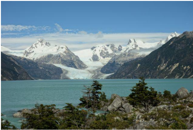
Ventisquero Leones.

Ventisquero proveniente del campo de hielo norte que dio origen al lago Leones. A través de este ventisquero se accede al campo de hielo siendo la ruta más utilizada para cruzarlo con dirección a laguna San Rafael. Para acceder se debe navegar el lago Leones después de caminar un tramo de aproximadamente 4 kilómetros. El lugar es muy atractivo paisajísticamente y las actividades turísticas que se pueden desarrollar están asociadas al escalamiento y caminatas en hielo, montañismo o simplemente la observación y fotografía (Servicio Nacional de Turismo, 2012).