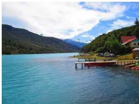
Lago Bertrand.

La localidad de Puerto Bertrand, rodeada de montañas y bosques de lenga, está precisamente en el sector sur del Lago Bertrand, donde el río Baker tiene su nacimiento. Puerto Bertrand cuenta con la mayor concentración de oferta turística de la zona: varios complejos con cabañas bien equipadas, lodges de pesca, restaurantes, alquiler de caballos y una gran diversidad de excursiones. El pueblo tiene un emplazamiento privilegiado, que lo convierte en un centro natural para realizar múltiples actividades entre las que destacamos las siguientes: pesca deportiva, cabalgatas guiadas, caminatas, visitas a los ventisqueros, navegación, rafting, entre otras (Servicio Nacional de Turismo, 2012).