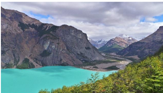
Reserva Nacional Lago Jeinimeni.

La Reserva Nacional Lago Jeinimeni fue creada el año 1967 y abarca una superficie de 161 mil hectáreas. Se caracteriza principalmente por proteger y conservar la estepa patagónica de Aysén. La vegetación de la unidad varía desde el oriente, donde es más esteparia, hacia el sector occidental más húmedo, reconociéndose dos formaciones vegetacionales: la Estepa Patagónica de Aysén y el bosque Caducifolio de Aysén. Respecto de la fauna, el grupo más abundante lo constituyen las aves como el Cóndor, Águila, Cernícalo, Pato Anteojillo, Carpintero Negro, Zorzal, Tordo y la Cachaña. Entre los mamíferos es posible encontrar Huemul, Guanaco, Vizcacha austral, Puma, entre otros (Servicio Nacional de Turismo, 2012).