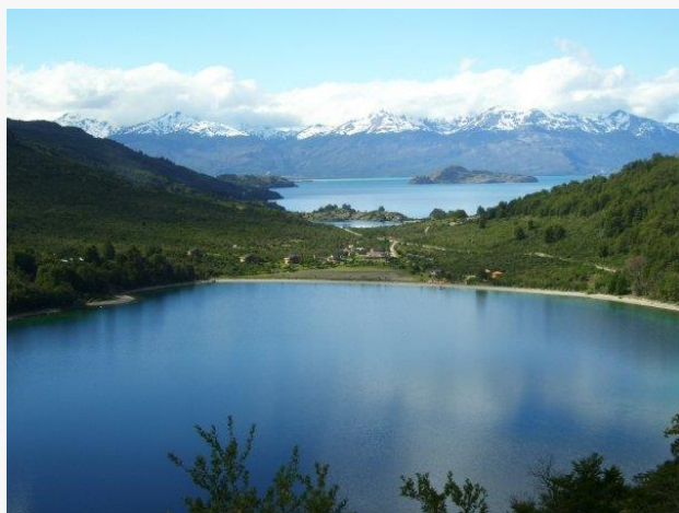
Lago Negro.

Se ubica entre el lago General Carrera y el lago Bertrand. Es un pequeño lago que debe su nombre al color de sus aguas debido a su gran profundidad. En la ribera norte de este lago se localizan establecimientos de alojamiento especializados en pesca recreativa de muy buen nivel (Servicio Nacional de Turismo, 2012).