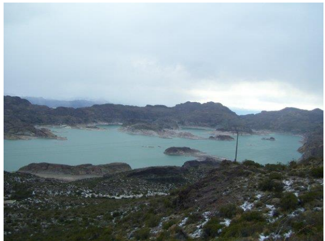
Laguna Verde.

Es una laguna de aguas verdes con características propias de un cráter volcánico, sus aguas son salobres y los lugareños le atribuyen propiedades medicinales. Esta laguna es apreciable del camino que un Chile Chico con Puerto Guadal. Para apreciarla y tomar fotografías, existe un mirador construido por la Compañía Minera que explota yacimientos de oro existentes en las proximidades de este atractivo. En ocasiones se pueden apreciar flamencos rosados en sus orillas (Servicio Nacional de Turismo, 2012).