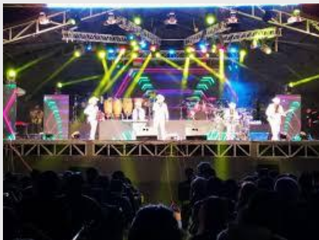
Festival de la Voz de Chile Chico.

El Festival es organizado por la Municipalidad, tiene una duración de dos días, donde se realiza una competencia popular y folklórica, con participantes regionales (Servicio Nacional de Turismo, 2012).